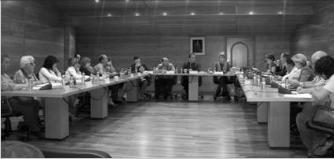
En Consejo Comarca en el salón de plenos de la sede

El Consejo luz verde a la cesión de la residencia para mayores por parte del Ayuntamiento de Illueca a la Comarca