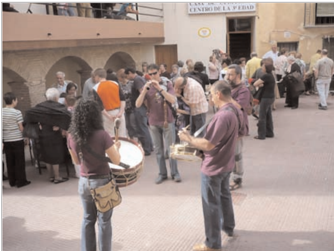
La muestra de los Oficios contó con una alta participación vecinal

Un nutrido programa de actos generó un ambiente festivo en la localidad