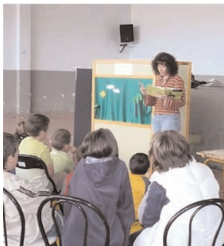
El Cuentacuentos estuvo a cargo de las madres del CRA