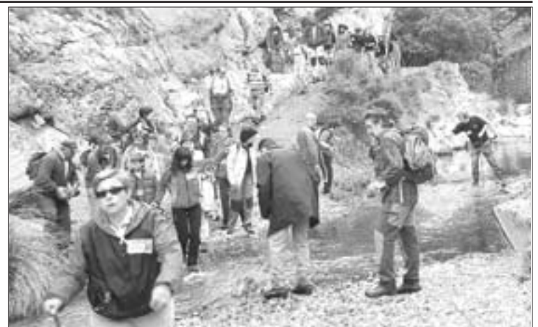
Decenas de senderistas participaron en la marcha

caudales a los ríos Manubles, Ribota, Isuela y Aranda. Los grupos que se oponen a esa mina mantienen desde hace tres años una serie de acciones periódicas de protesta con el fin de evitar que la empresa obtenga los permisos necesarios para abrir esa explotación, que todavía se encuentra en fase de investigación de los rendimientos geológicos. La ruta que ayer se realizó recorrió los municipios de Ciria, Torrelapaja y Berdejo. Desde que se conoció la intención de instalar la