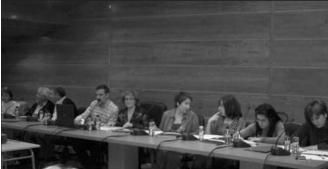
Diferentes colectivos de la comarca estuvieron representados

La directora general de Familia del Gobierno de Aragón, Rosa Pons presentó, el 30 de abril, en la comarca del Aranda el Plan Integral de Apoyo a la Familias 2006-2009.