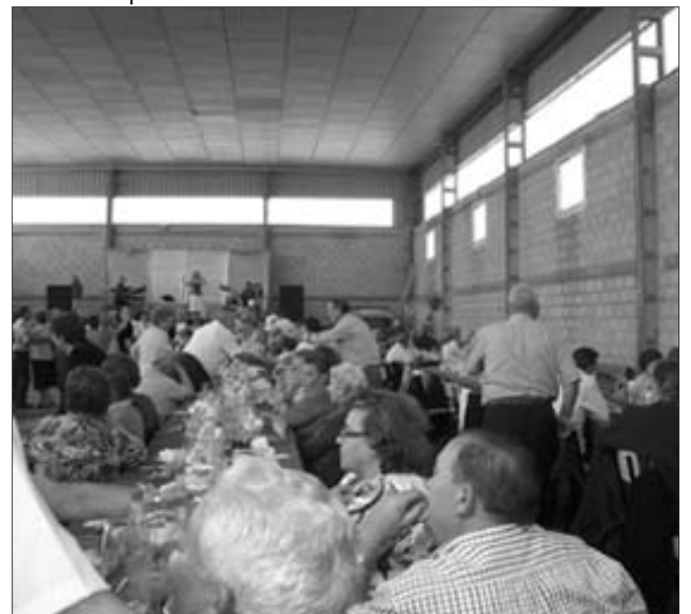
El año pasado en el Encuentro se realizó en Trasobares