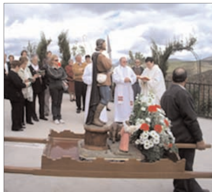
La bendición del término se hizo desde el mirador