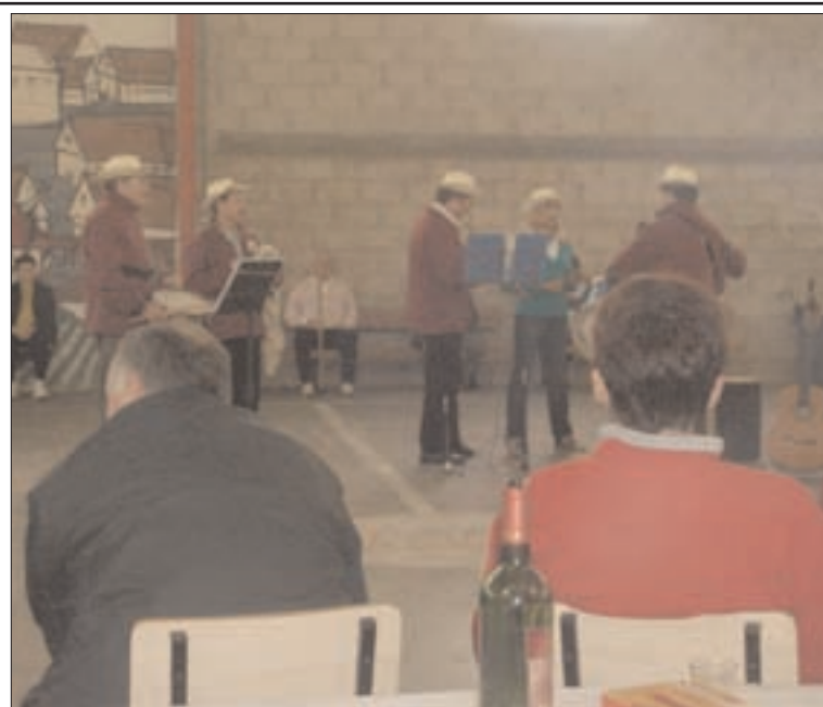
La ascensión a la ermita se realizará próximamente

de Morroprieto y por la noche, la actuación de la orquesta Ciclón. Por unas horas, los trasobarinos consiguieron olvidarse al ritmo de la música de lo que fuera estaba cayendo. Fuentes municipales han informado, a esta publicación, que esperan realizar la ascensión a la ermita de San Cristóbal, en las próximas semanas, para celebrar la mítica misa.