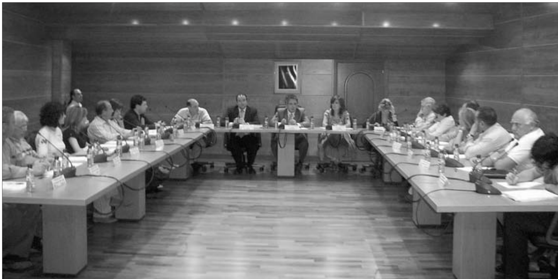
El Consejo Comarcal escuchó atentamente las explicaciones del consejero de Política Territorial a cerca del traspaso de nuevas competencias a la s comarcas

Transferencia del segundo bloque de competencias