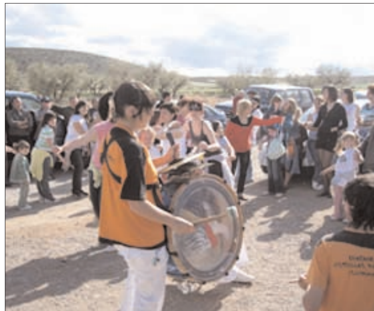
Un día completo de diversión y alegría

principales calles de la localidad. A media mañana, todos los vecinos de Tierga comenzaron a concentrarse en el pabellón municipal para comenzar el camino,