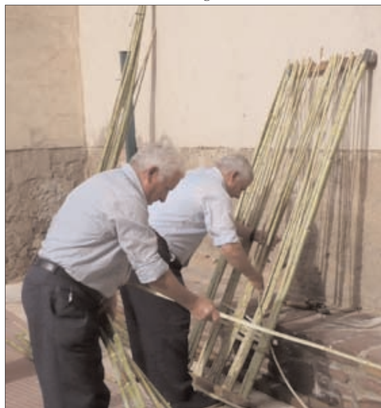
Los vecinos recuperan sus antiguos trabajos