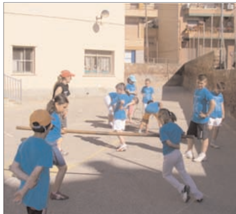
Una mañana repleta de diversión

como broche final a un largo curso, los alumnos del centro escolar de Illueca disfrutaron del deporte como actividad principal en el patio del