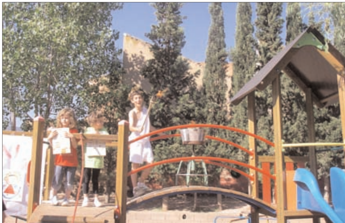
Como en toda Olimpiada no faltó la encendida de la antorcha olímpica

El objeto es fomentar la práctica deportiva