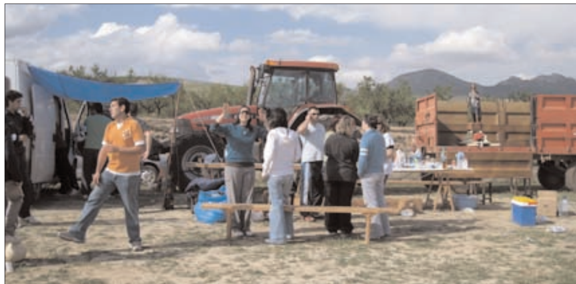
San Isidro presidió la romería en Camplañes

El día de romería se trasladó al sábado para hacerlo coincidir con el fin de semana