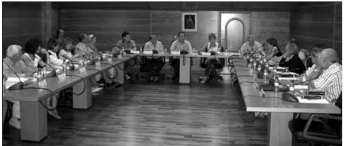
El Consejo Comarcal se reunió en el Salón de Plenos de la Sede Comarcal

Por otra parte el Consejo Comarcal aprobó por unanimidad la reversión del uso de las caballerizas del Castillo Palacio del