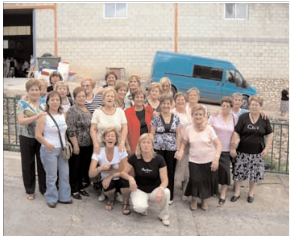
Asociación de mujeres "Virgen del Carmen" de Sestrica