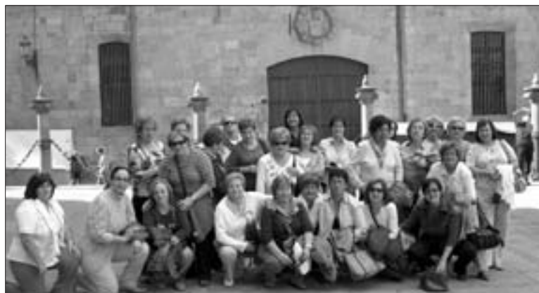
Un total de 27 mujeres participaron en el viaje

La asociación de Mujeres Rona de Illueca ha continuado a lo largo de estos meses con sus diferentes actividades y dinámicas. De esta forma, los pasados días 27 y 28 de septiembre organizaron un viaje a Salamanca y Valladolid "tuvimos visitas guiadas por los principales monumento y lugares emblemáticos de las ciudad, hemos venido muy contentas", indican desde la organización.