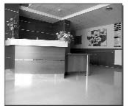
En Illueca, eres protagonista

No es lo mismo estar en una Residencia que vivir en ella. Ven a vivir con nosotros.