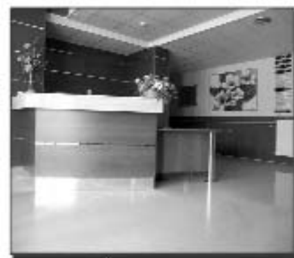
En Illueca, eres protagonista

No es lo mismo estar en una Residencia que vivir en ella. Ven a vivir con nosotros.