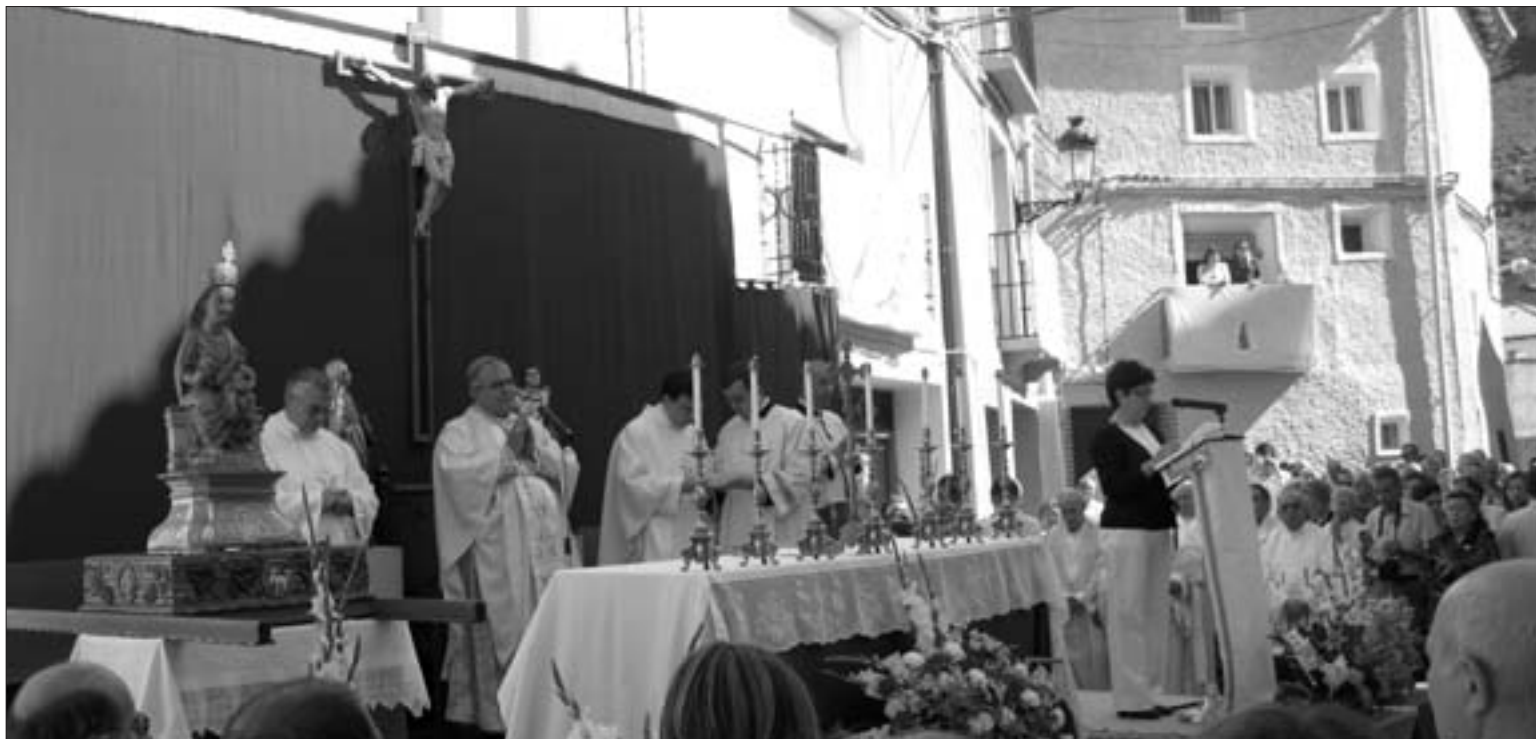
Los actos religiosos se trasladaron a la plaza Mayor dado el número de fieles congregados

En la homilía, Demetrio Fernández, obispo de Tarazona, recordó que coronar a la Virgen no es un acto baladí, sino que es signo del deseo de un pueblo de que la Virgen sea su reina. A las 12,30 de la mañana se colocó la corona de plata sobre la cabeza de