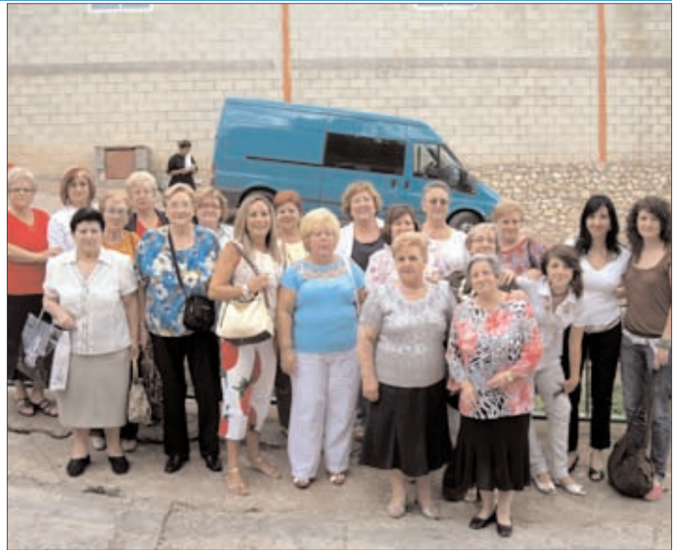
Asociación de mujeres "Zadarrincón" de Oseja