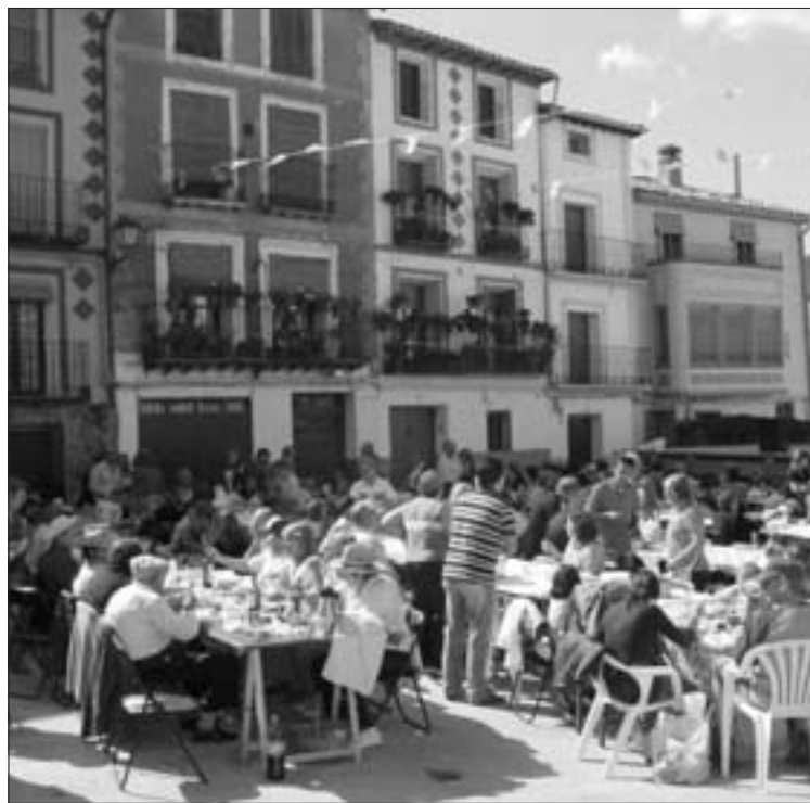
El buen tiempo acompañó durante toda la comida popular

festejos continuaron con una disco móvil. El acto más popular se celebró el domingo a las 14.30 en la plaza con la concentración de vecinos y visitantes para disfrutar de una comida popular. Según han informado fuentes municipales, entorno a 240 personas disfrutaron de un magnifico guiso estofado.