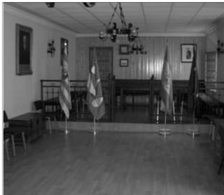
El Salón de Plenos luce una imagen renovada

do de cornisas también se han forrado los laterales de la sala con madera junto con el suelo. Por otro lado, también se han instalado las cuatro banderas previstas en la normativa: (Europa, España, Autónoma y Local). "Estamos muy satisfechos de como ha quedado el nuevo Salón de Plenos", comenta la máxi-