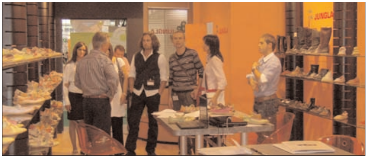
Las empresas aragonesas intentan abrirse nuevos mercados en MICAM

"Nuestra mejor campaña de marketing es nuestra presencia en el mercado, que debemos a la calidad que acompaña a la gran aceptación de nuestras