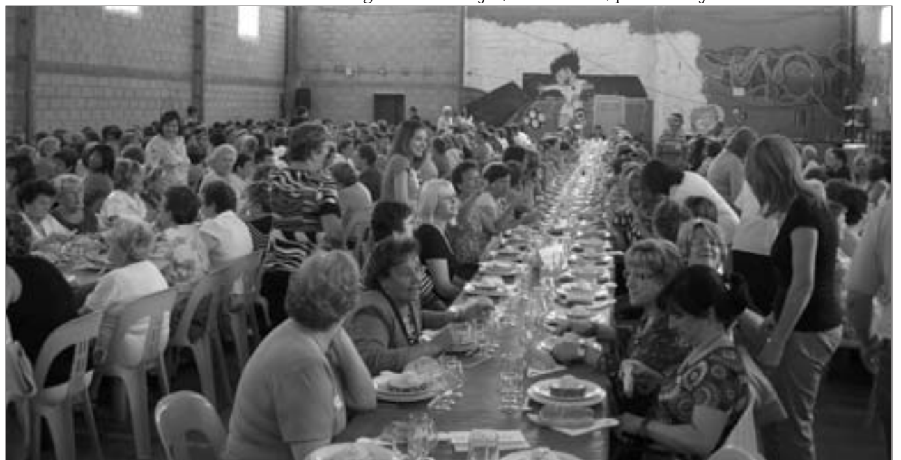
Un día de convivencia entre las asociaciones de mujeres de la comarca

tar de una comida de hermandad en la que las risas y la diversión de las mujeres fueron los grandes protago-