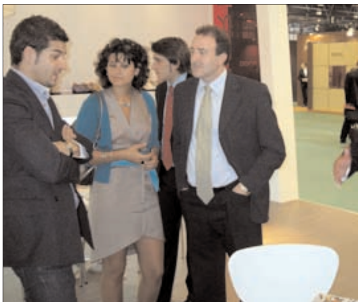
Las empresas mostraron sus apuestas en Madrid

COMARCAL La Comarca estrena nueva Web PÁGINA 4