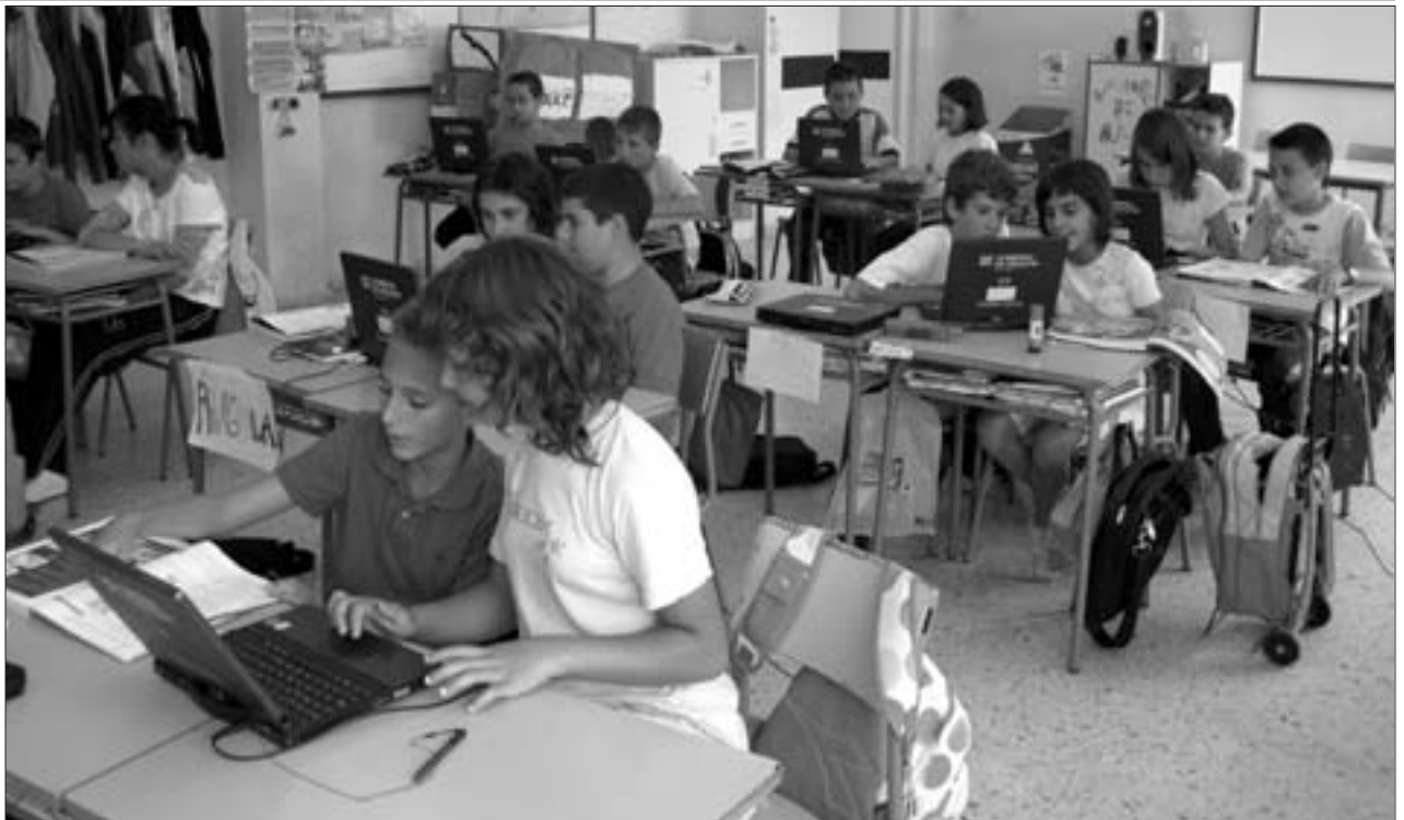
El C.P. de Illueca mantiene la doble vía salvo en el primero de infantil

A lo largo del verano, el Ayuntamiento de Illueca ha llevado a cabo obras en el patio del recreo así como la sustitución de las antiguas ventanas por otras nuevas con las que se ha mejorado la acústica de todas las clases, además de