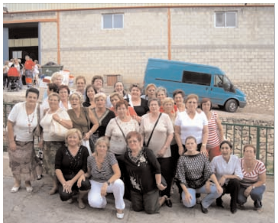
Asociación de mujeres Xiarchum de Jarque de Moncayo