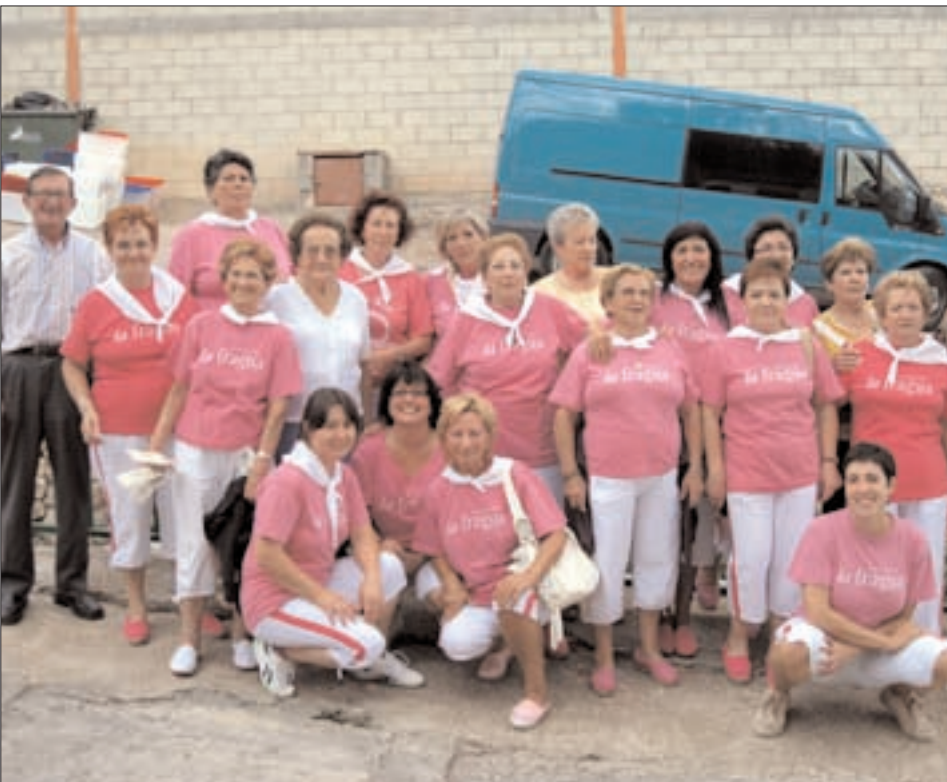
Asociación de mujeres "La Fragua" de Pomer