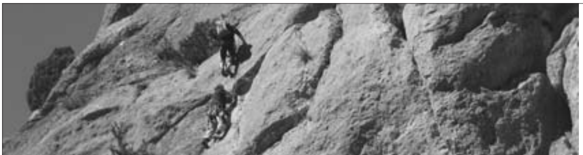
Una jornada de escalada en la Cara Oculta del Moncayo

En esta edición se batió el récord de participación