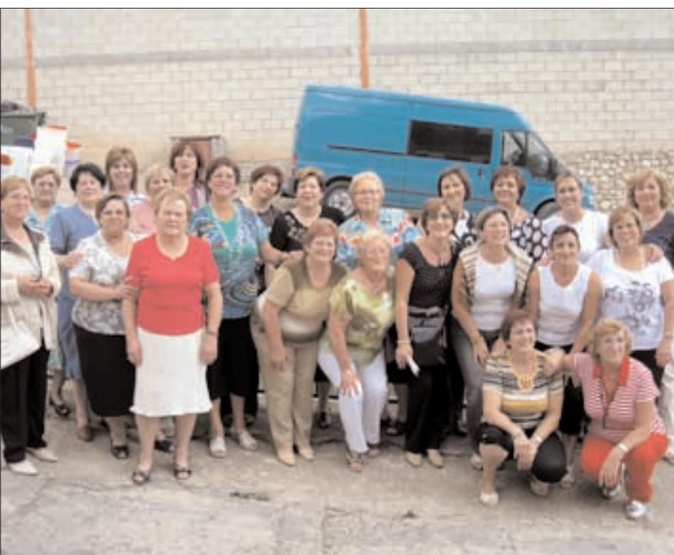
Asociación de mujeres "Santa Rosa de Lima" de Tierga