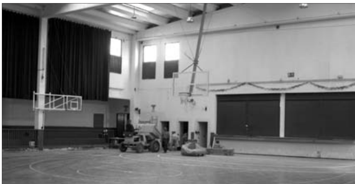
Las reformas en el pabellón municipal continuarán con el pintado de la fachada

En cuanto a la pintura tanto del interior como de la fachada las obras se iniciarán una vez finalizadas