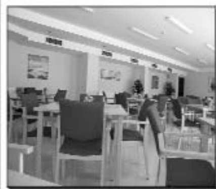
En Illueca, a cuerpo de rey

Por otra parte, el Servicio Comarcal de Juventud va a ofertar a los trece municipios que componen la comarca, una serie de talleres lúdicos que llevarán a cabo desde el 20 de octubre al 21 de diciembre. Todas las actividades serán gratuitas y de libre asistencia. Entre la oferta destacan los talleres de percusión africana, risoterapia, break dance, abalorios y batuka, entre otros.