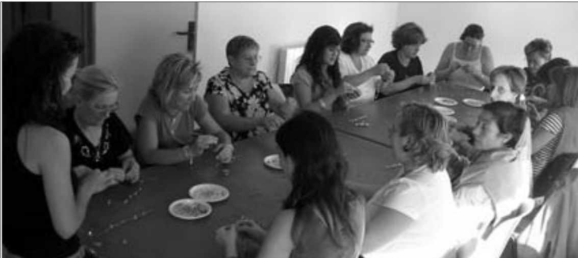
La oferta de actividades continuará durante los próximos meses

A través de la Diputación Provincial de Zaragoza