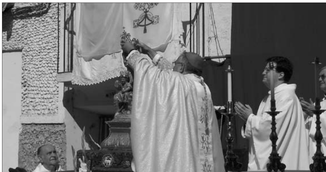
La Coronación de la Virgen estuvo a cargo del obispo de Tarazona

la Virgen, que fue arropada por los aplausos de cientos de asistentes. Por último, el Obispo impartió la bendición