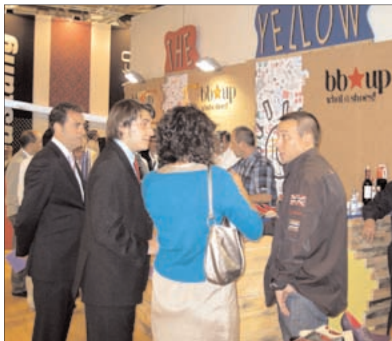
The Yelow Stone Company se centra en la novedad