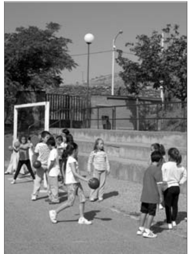
El C.P. de Brea inicia las clases con normalidad

ilustración de cuentos e historias de cada uno de los países asociados para después intercambiarlos. Los alumnos de Brea han inventado y redactado más de veinte historias de las que ahora disfrutaban los niños británicos y alemanes. Durante este curso, los alumnos diseñarán su particular Flat Stanley, un muñeco plano que está recorriendo todo el mundo y que se ha convertido en el gran protagonista de las historias de los centros que participan en este tipo de