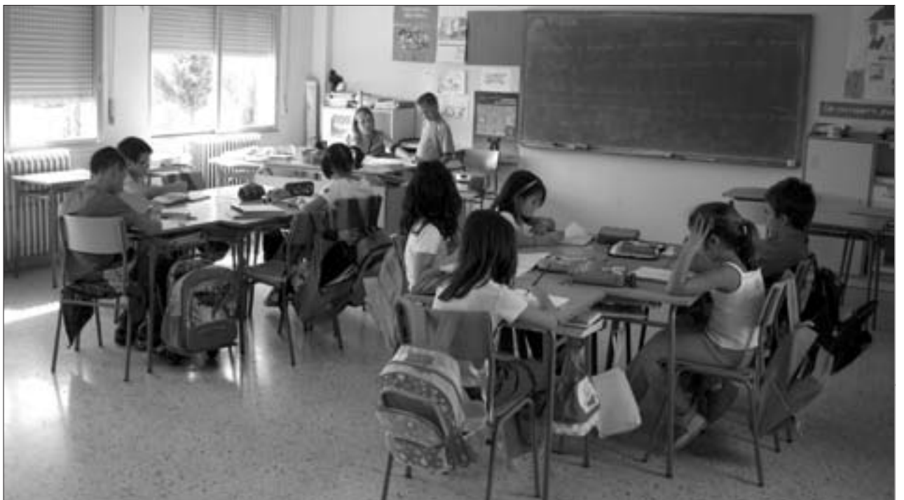
El CRA Aranda-Isuela se enfrenta al gran problema de la falta de nuevas matrículas