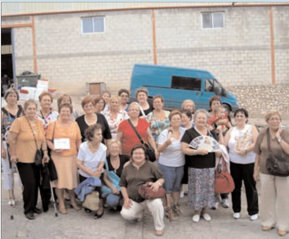
Asociación de mujeres "Santa Águeda" de Mesones de Isuela