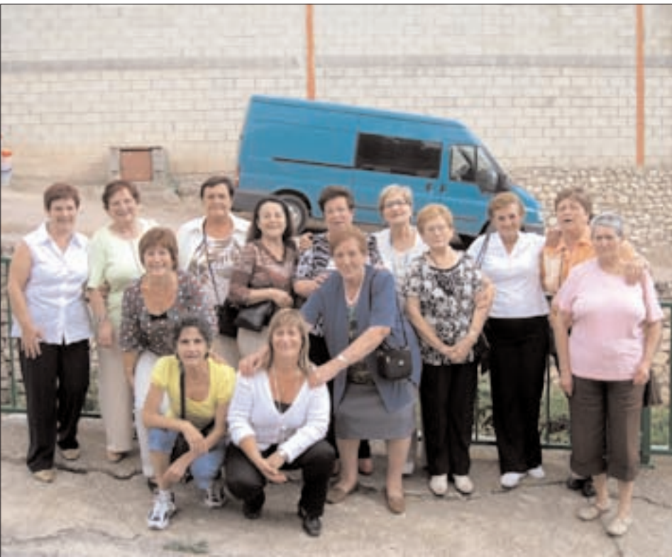
Asociación de mujeres de Calcena