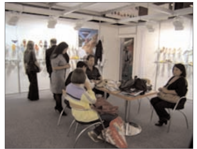
Una apuesta en firme

colecciones en nuestros clientes por todo el mundo" comenta Benedí.