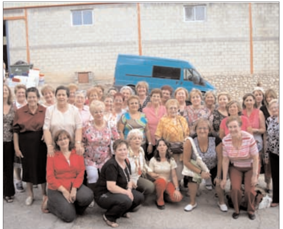
Asociación de mujeres "Fuente la Rosa" de Gotor