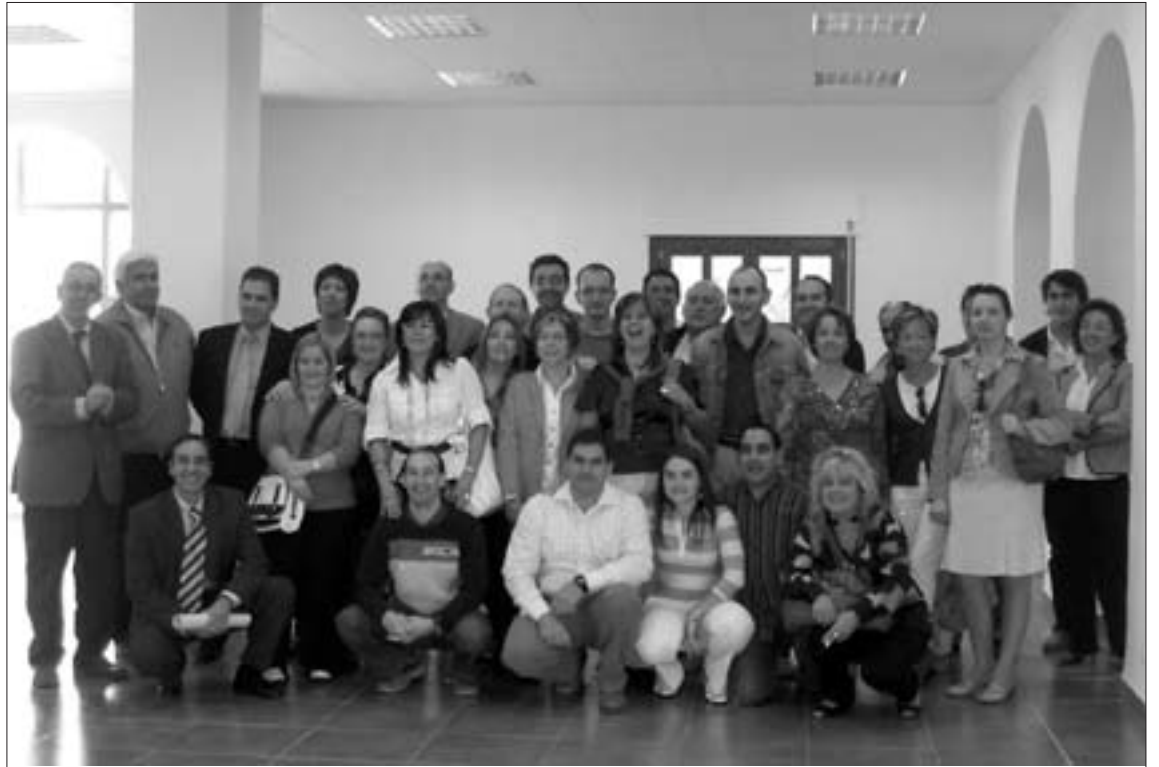
Los responsables y alumnos de taller visitaron las obras realizadas en centro cultural polivalente

El director del taller, explicó en el acto los detalles de los trabajos realizados, centrados en la restauración y acondicionamiento del centro cultural polivalente (la antigua casa de los maestros). "Se han llevado a cabo las obras necesarias para trasladar el acceso del edificio a la parte trasera así como las mejoras necesarias para instalar pró-