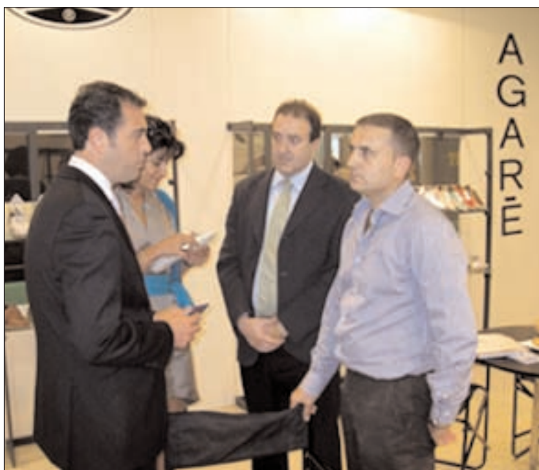
Calzados Cioma con su firma Agaré, no faltó a la cita en Modacalzado