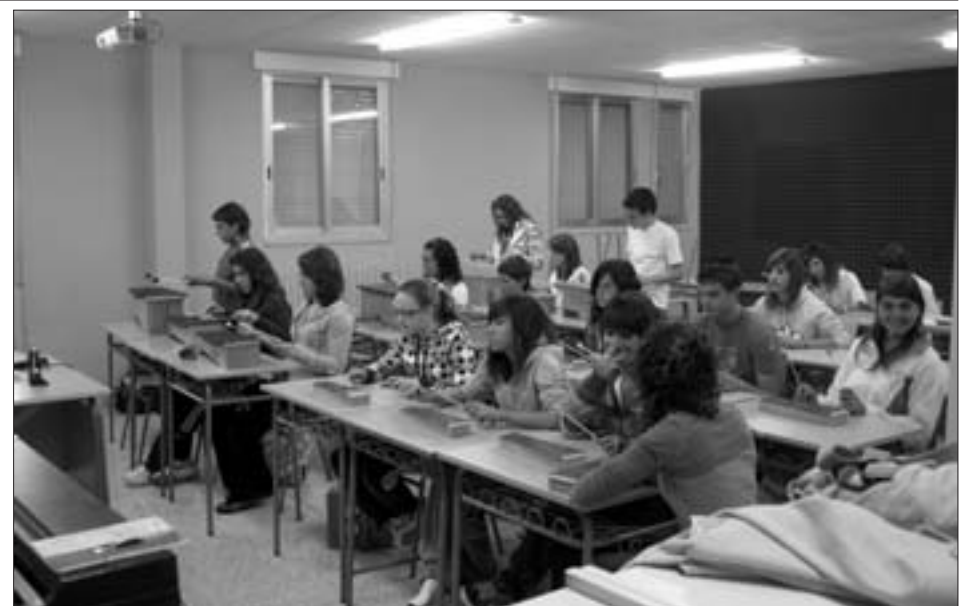
Las clases comienzan con una nueva aula de música

En lo referente al número de matrículas, el centro ha descendido ligeramente en