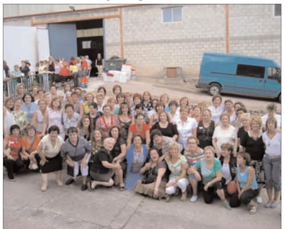
Asociación de mujeres "Virgen del Capitulo" de Trasobares