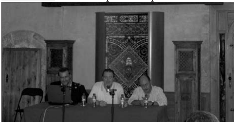
El nuevo sitio Web se pondrá en marcha en las próximas semanas