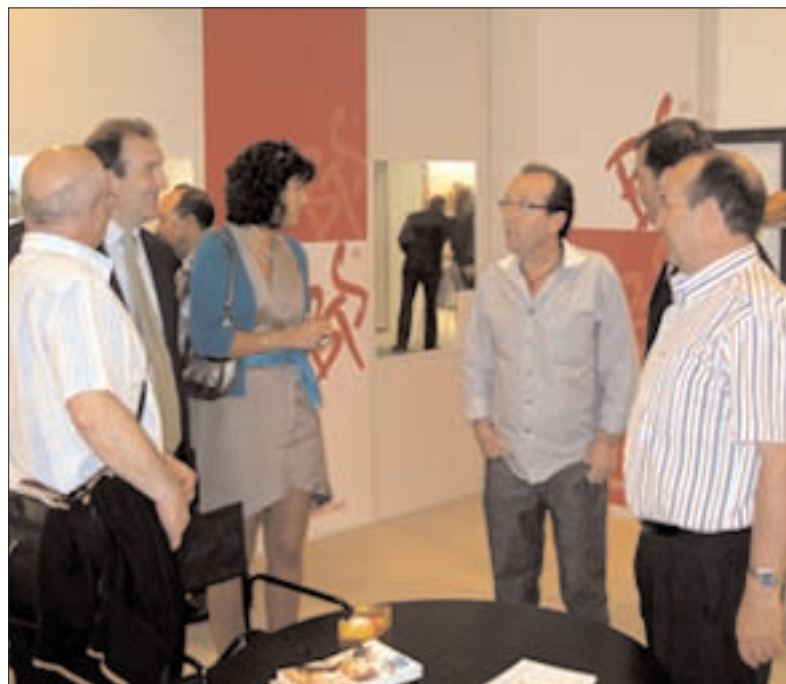
Botanas mostró su colección para la primavera- verano 2009