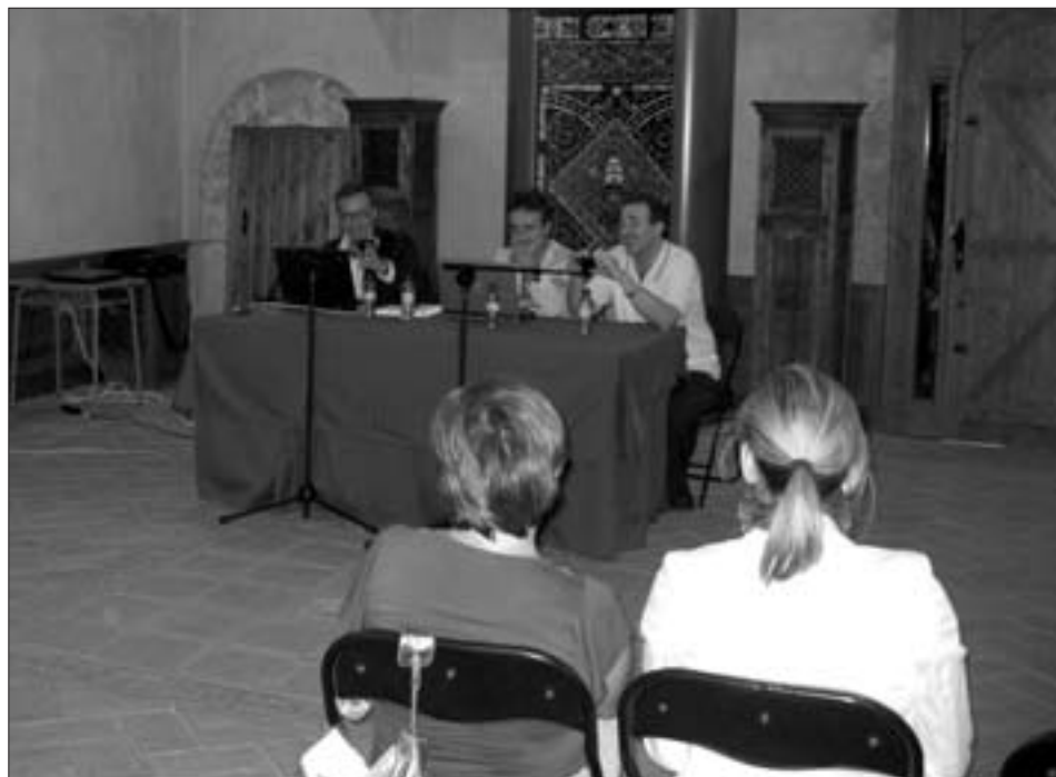
El Plan se presentó en la Sala Dorada del Castillo Palacio del Papa Luna

El proyecto apuesta por el turismo especializado en la comarca