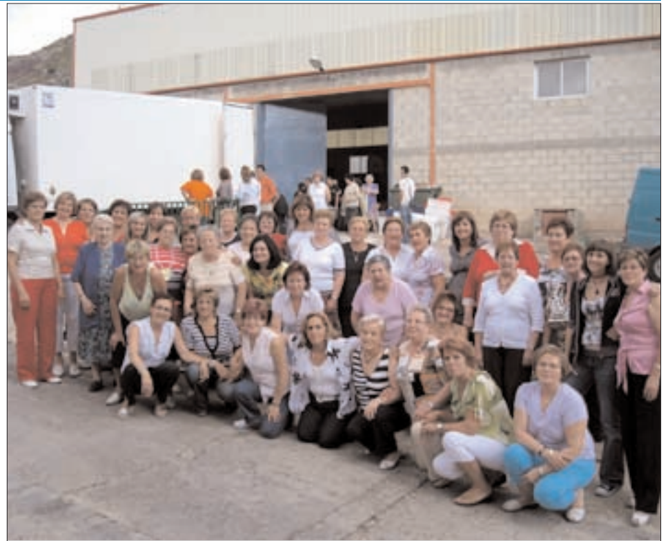
Asociación de mujeres "mujer breana" de Brea de Aragón