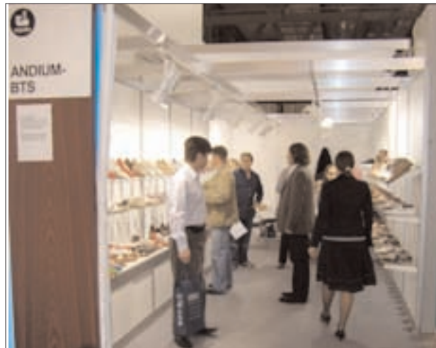
El objetivo es conseguir nuevos clientes