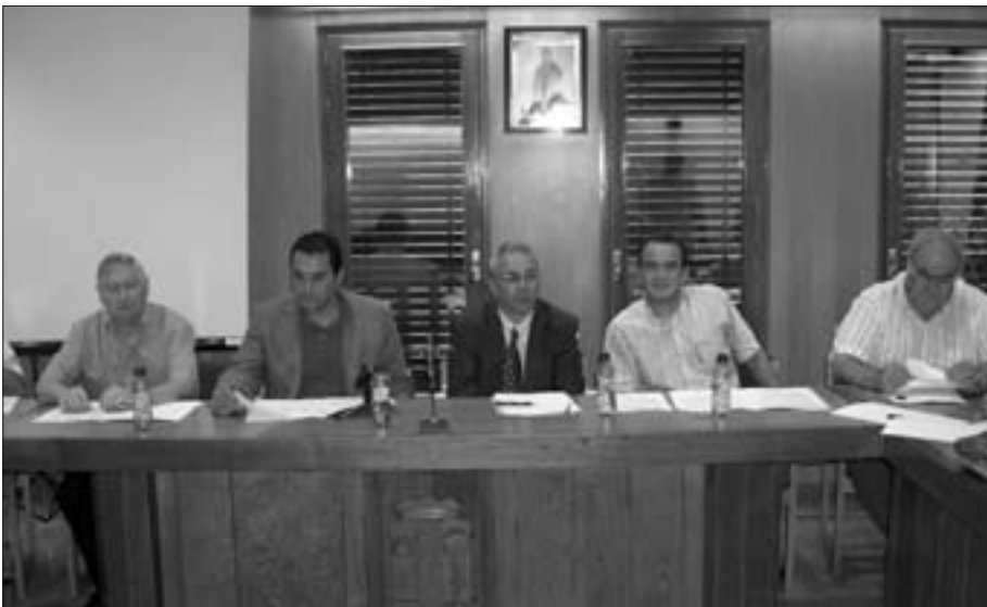
La reunión se llevó a cabo en el Ayuntamiento de Illueca

La Asociación para el Desarrollo Rural Integral (ADRI) de las comarcas de Calatayud y del Aranda, encargada de gestionar los fondos de ayudas de la UE, va a promover un plan de industrialización en la zona de Aranda. Este proyec-