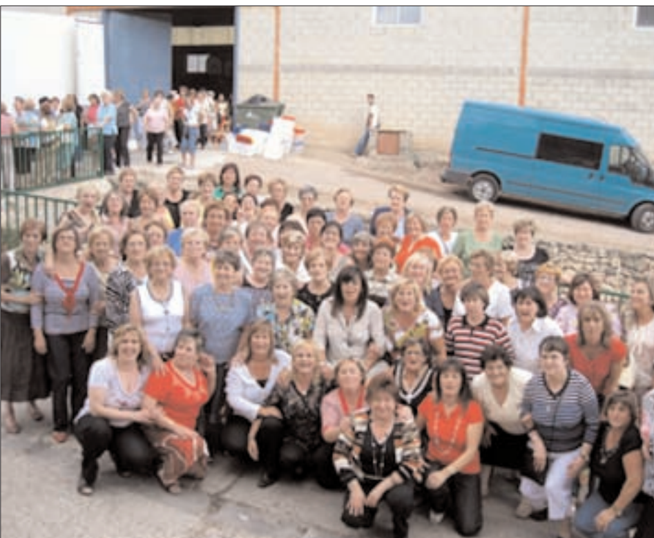
Asociación de mujeres RONA de Illueca