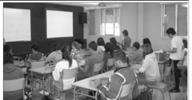
El programa de apertura de centro se llevará a cabo en la nueva sala del IES

Esta actividad es totalmente gratuita y está dirigida fundamentalmente a jóvenes con edades comprendidas entre los 12 y los 16 años. Como novedad, se ha estimado conveniente que se lleve a cabo en una sala anexa al centro que se ha habilitado para ello con juegos recreativos como ping-pong y futbolines además de, una pantalla para pro-