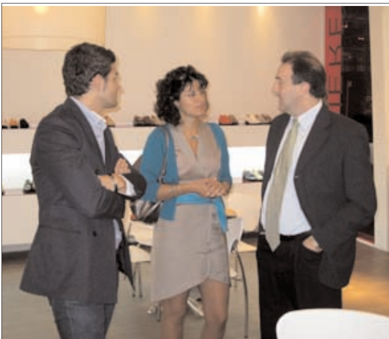
Zampiere continua apostando por el diseño y la calidad