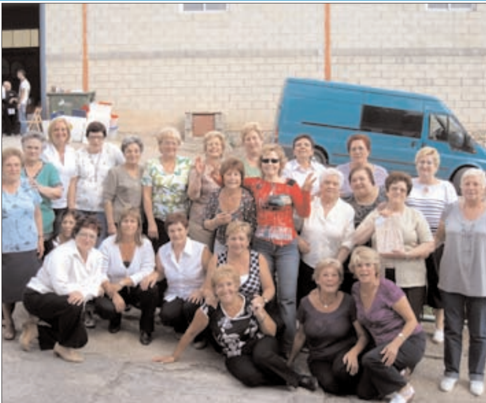
Asociación de mujeres "Fuente Lagüen" de Aranda de Moncayo