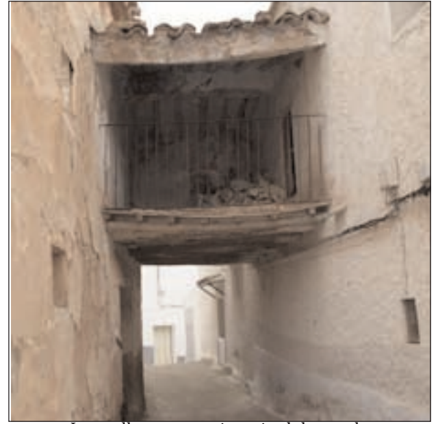
Las calles son testimonio del pasado