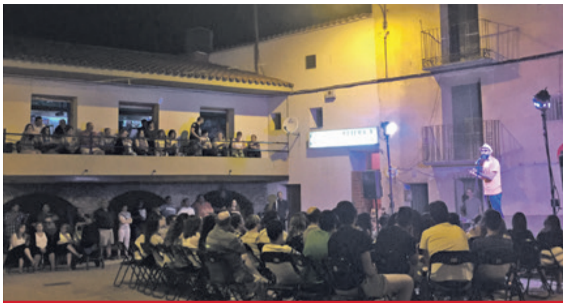
Jarque durante una actuación de las Noches del Aranda.

Teatro, circo, humor y magia para amenizar las noches de verano