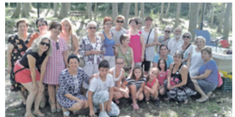
Mercado del trueque en Tierga.

vista de la creciente participación con la que cuenta. El año pasado, alrededor de 140 personas disfrutaron de esta actividad.