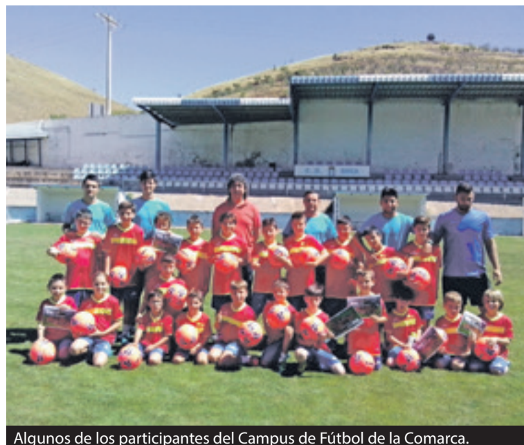
Algunos de los participantes del Campus de Fútbol de la Comarca.

El Campus finalizó el 15 de julio con una merienda fin de curso, entrega de premios y muchas sorpresas más. ◀