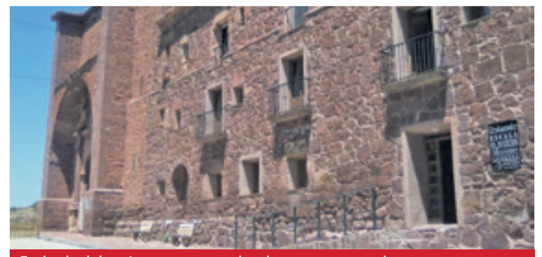
Fachada del antiguo convento donde se encuentra el restaurante.