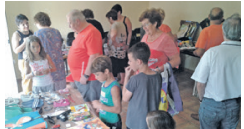
Mercado del trueque en Sestrica.

El trueque en nuestra comarca está más presente que nunca; una práctica rescatada del pasado que año a año va ganando adeptos, a la