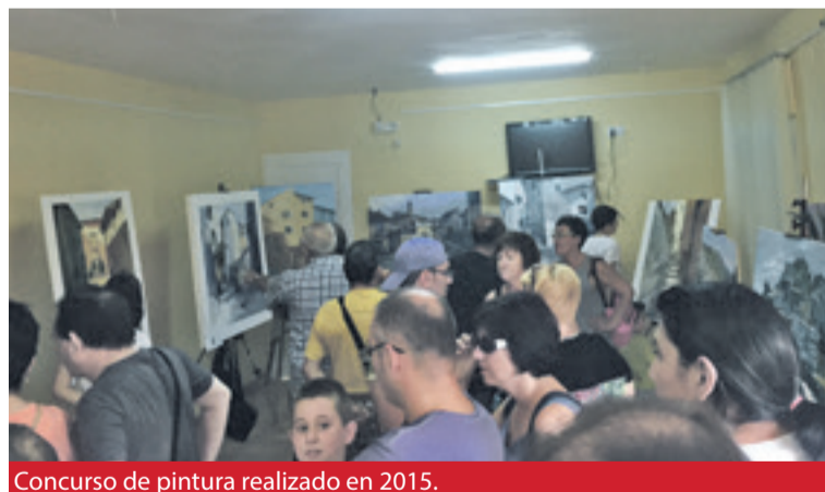
Concurso de pintura realizado en 2015.

Es un concurso abierto a todos los artistas que deseen participar y el tema en el que se basa está relacionado con un motivo de la localidad o de su entorno: paisaje, rincones, monumentos, ambientes, costumbres, tradiciones, gente, etc.