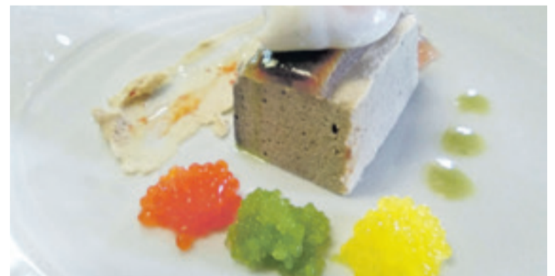
Uno de los platos elaborados por David.

Contacto para información y reservas: 639 963 322