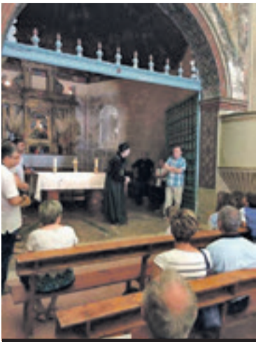
Visita en el Castillo de Mesones.

Por quinto año, y dado el éxito de años anteriores, la Comarca del Aranda a través de su Departamento de Turismo apuesta por las visitas guiadas teatralizadas durante todos los sábados del mes de agosto