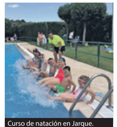
Curso de natación en Jarque.

Mesones de Isuela, Tierga, Sestrica, Trasobares, Aranda, Jarque o Gotor han sido las localidades que han suscrito a los pequeños a los cursos acuáticos. Uno de los objetivos que se pretende conseguir con estos cursos es que los niños "pierdan el