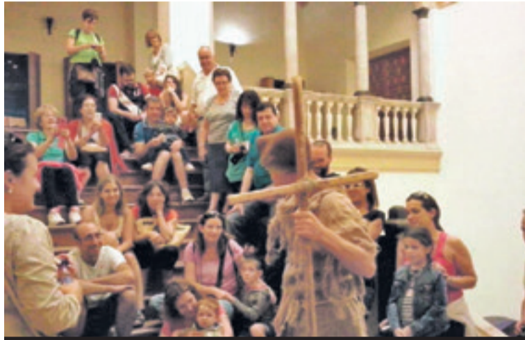
Visita teatralizada en el Castillo de Illueca.