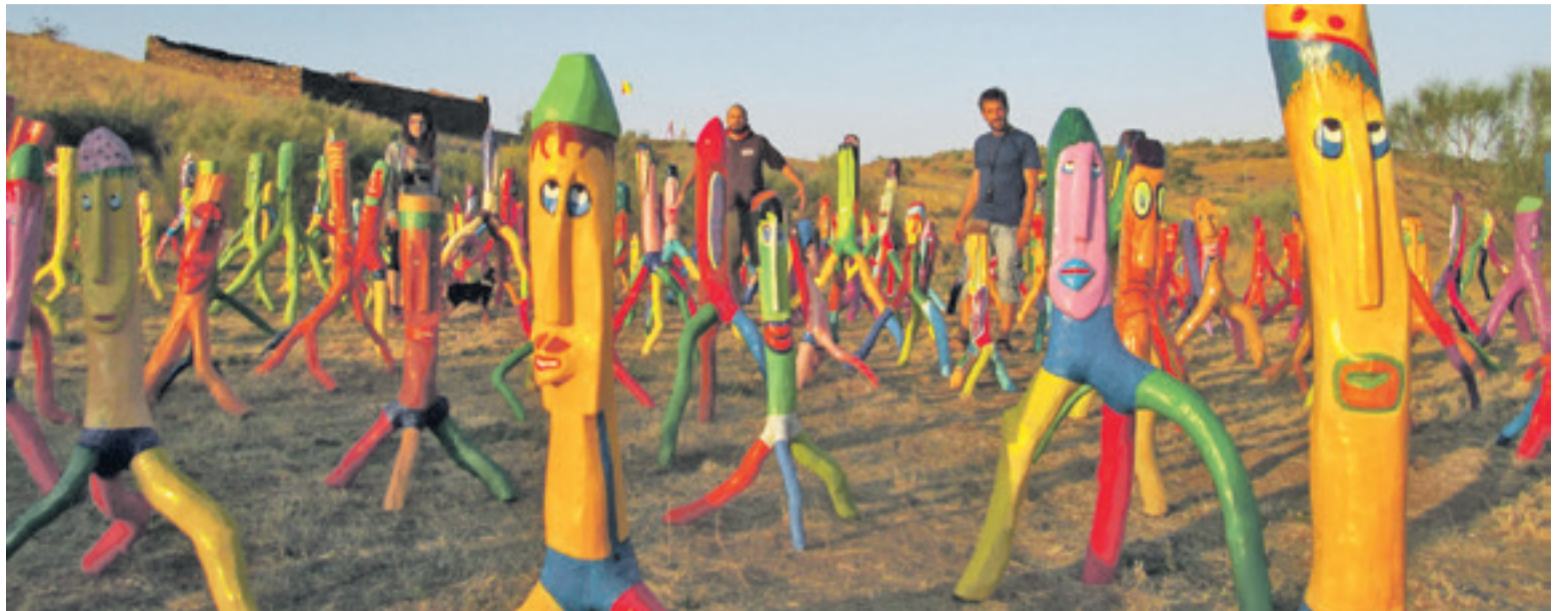
Exposición Wera-Art en la finca "La Venta".

A los más de 300 troncos reconstruidos se suma ahora una colección de divertidas sillas "con sus espíritus propios", realizadas también con troncos de madera. La exposición invita al visitante a rodearse de estos mágicos espíritus y dejarse llevar por el deseo de la tranquilidad.