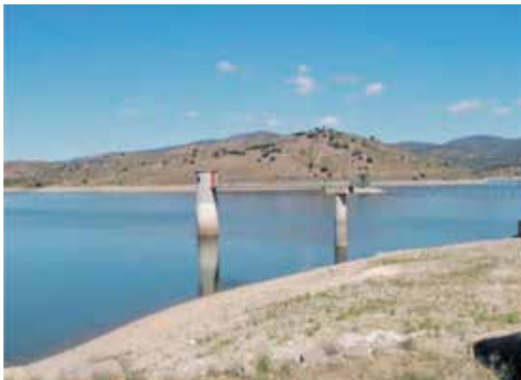
Embalse de Aranda de Moncayo.

En todos los informes emitidos se detecta la presencia de manganeso en el agua, algo habitual por otra parte. Si bien las mediciones en el punto de entrada de agua bruta a la ETAP arrojan niveles mayores de manganeso, tras el tratamiento del agua en la planta, los niveles de manganeso en agua en el punto de salida de la potabilizadora están en todos los