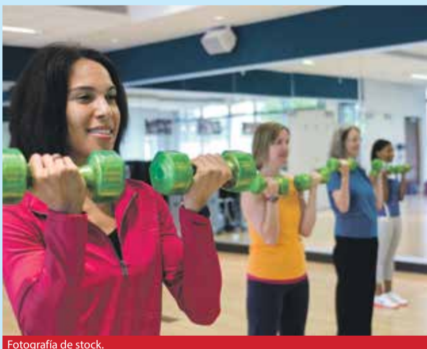
Fotografía de stock.

Tras haber finalizado el periodo de inscripción, las actividades deportivas que finalmente se llevarán a cabo durante el curso 16/17 son las que aparecen a continuación. Todas ellas darán comienzo a partir del 17 de octubre y continuarán hasta el 16 de junio de 2017*: