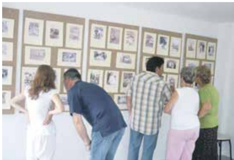
Exposición de fotografías antiguas en Jarque.

la exposición de fotografías antiguas de Jarque de Moncayo se ha consolidado como un referente para habitantes y visitantes, que disfrutan con las instantáneas expuestas y muchas veces se sorprenden y emocionan al descubrir rostros conocidos. ☛