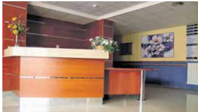
Recepción de la Residencia de Personas Mayores "Comarca del Aranda".

centro acudieron con firmas recogidas para solicitar la renovación automática del actual contrato de gestión y evitar así la denuncia del contrato. Si bien los trabajadores de la residencia se vieron afectados en el pasado por la situación económico-financiera de la Fundación concesionaria, ahora afirman que la situación financiera de la entidad no presenta