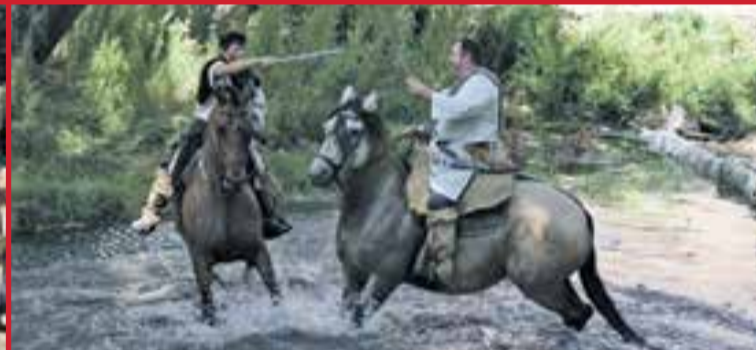
Fotos tomadas durante las II Jornadas de la Celtiberia celebradas el pasado 10 y 11 de septiembre.