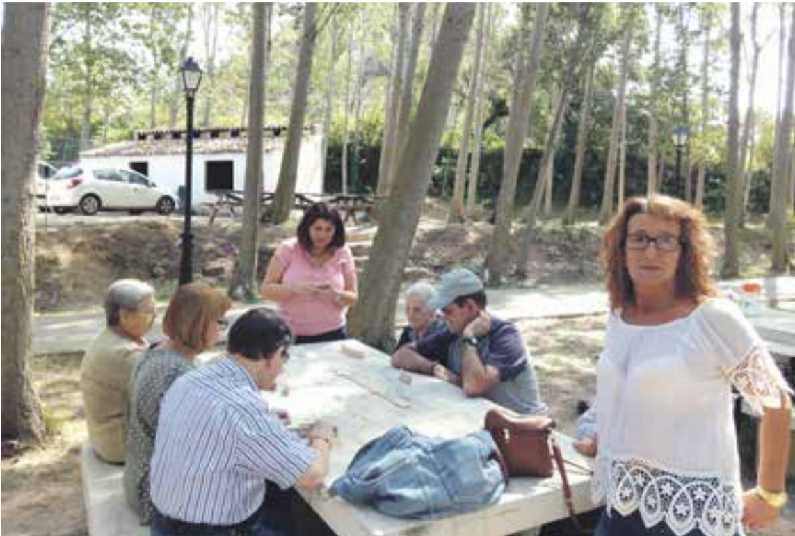
Excursionistas jugando una partida de dominó.

Alrededor de 30 escolares de la Comarca del Aranda aprovechan estas “becas comedor”.