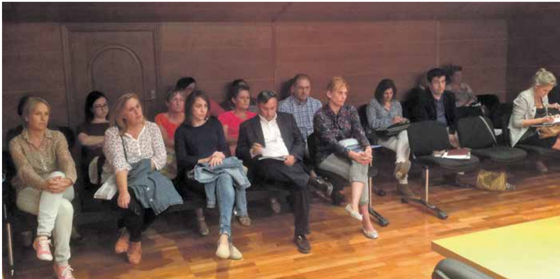
Debate del contrato de servicios de la residencia en el Consejo Comarcal.

La Comarca del Aranda apuesta por mejorar el servicio a los usuarios y ajustar el contrato de servicios de la Residencia de Mayores "Comarca del Aranda" de Illueca a las nuevas condiciones económicas y sociales