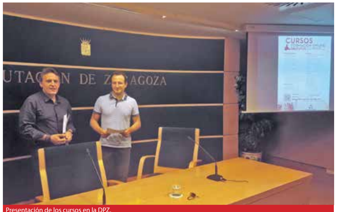
Presentación de los cursos en la DPZ.

cursos pueden completarse en la página web de la Diputación de Zaragoza. No obstante, los vecinos de los municipios de la provincia tienen prioridad sobre los de la capital. ◀