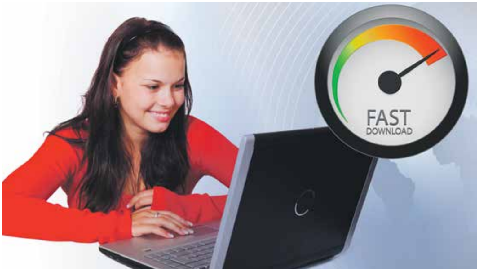
Fotografía de archivo.

La inversión realizada por el Gobierno de Aragón asciende a 36,5 millones de euros y es la mayor realizada por esta legislatura en materia tecnológica. Más info. en: www.conectararagon.com