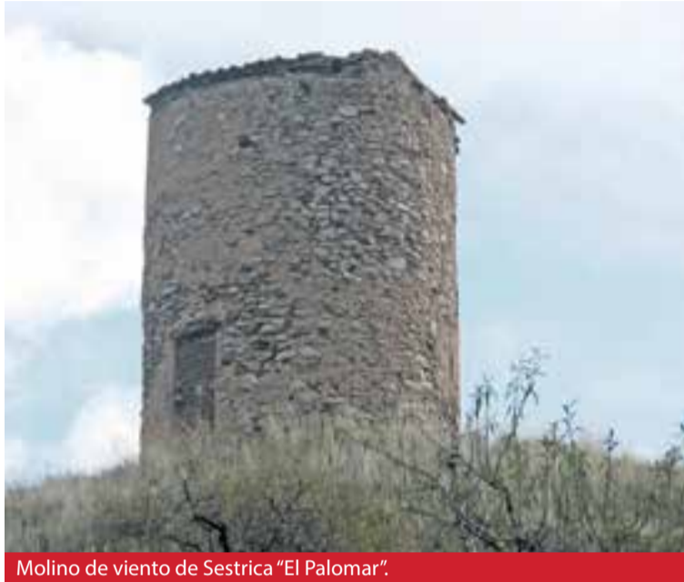
Molino de viento de Sestrica “El Palomar”.

La estructura del molino está en un estado aceptable, pero el mayor problema que presenta es su tejado, el cual se encuentra en muy mal estado, por lo que la restauración se prevé de urgencia para evitar un posible derrumbamiento. ◀