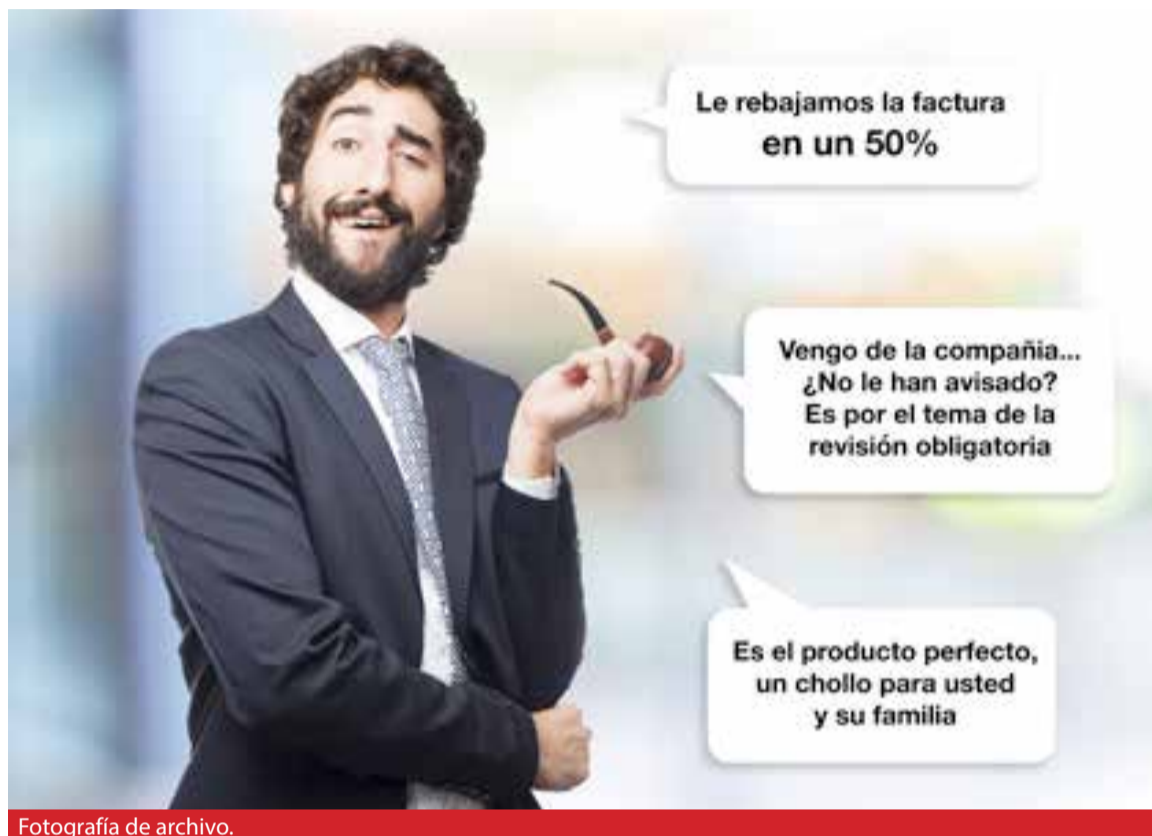
Fotografía de archivo.

Las sugerencias para estos casos son: desconfiar de productos que parecen "perfectos", no dejar entrar en casa a personas de