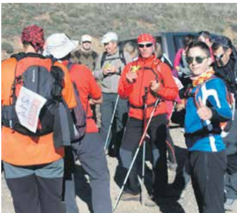
Participantes durante la Calcenada de 2015.