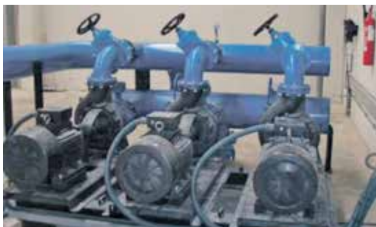
Equipo de bombeo.

Las principales funciones del manganeso en el organismo se centran en la actividad antioxidante, el desarrollo del tejido óseo, la regulación de los niveles de azúcar, la regulación del metabolismo, la absorción de vitaminas, la cicatrización de heridas y la adecuada producción de hormonas tiroideas y sexuales.