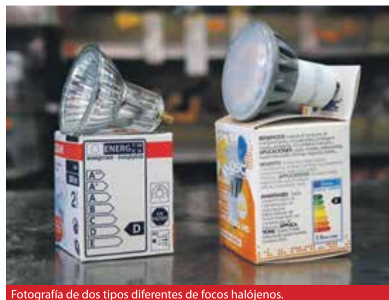
Fotografía de dos tipos diferentes de focos halógenos.

bombilla LED es dos o tres veces el de una incandescente, pero se ha estimado que la inversión se recupera entre uno y dos años además de la mayor duración de las primeras, como ya hemos comentado.