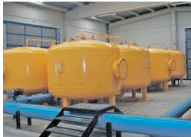
Sistema de Omnifiltraciones.

casos por debajo del valor paramétrico de 50 \mu\text{g/L} . Además, el cloro añadido al agua durante su tratamiento en la ETAP oxida el manganeso de forma progresiva, de forma que los niveles de manganeso van disminuyendo conforme el agua avanza desde la