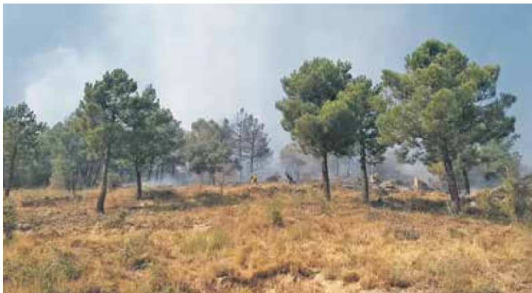
Bomberos actuando sobre el incendio en la Sierra de la Virgen ya controlado.

El pasado 30 de septiembre por la mañana se declaró un incendio en la Sierra de la Virgen, en el término municipal de Illueca. Sobre las 17.00 horas se declaró como controlado. En él llegaron a arder tres hectáreas de pinar lo que equivale a cinco campos de fútbol de primera división. Los bomberos de la DPZ desplazaron hasta la zona un camión todoterreno, otro camión nodriza y un vehículo de intervención rápida (VIR). En el operativo también trabajaron dos cuadrillas helitransportadas