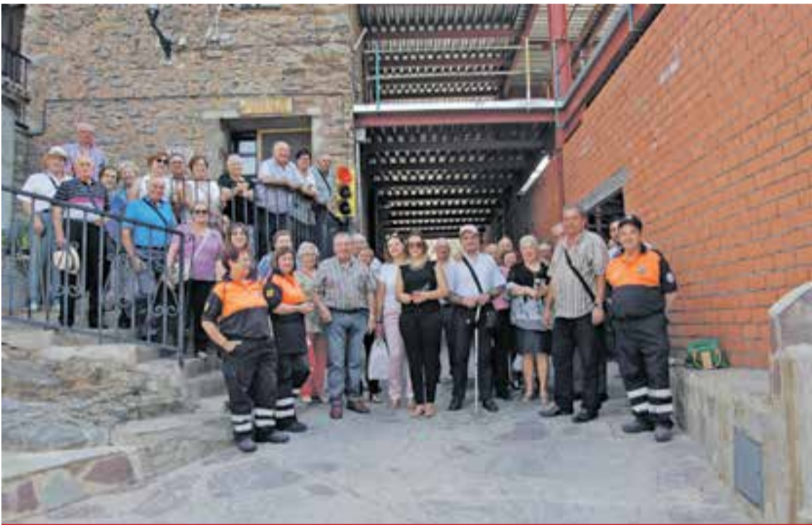
Los participantes en el Encuentro en la puerta del Albergue de Purujosa.

están llevando a cabo las obras de ampliación de las instalaciones. A pesar de que las obras aún no han finalizado, los mayores pudieron disfrutar de ese nuevo espacio durante la comida. Para finalizar, el Grupo Folklórico Aragonés "Otero del Cid" de Ateca amenizó la sobremesa al son de las jotas de nuestra tierra. ◀