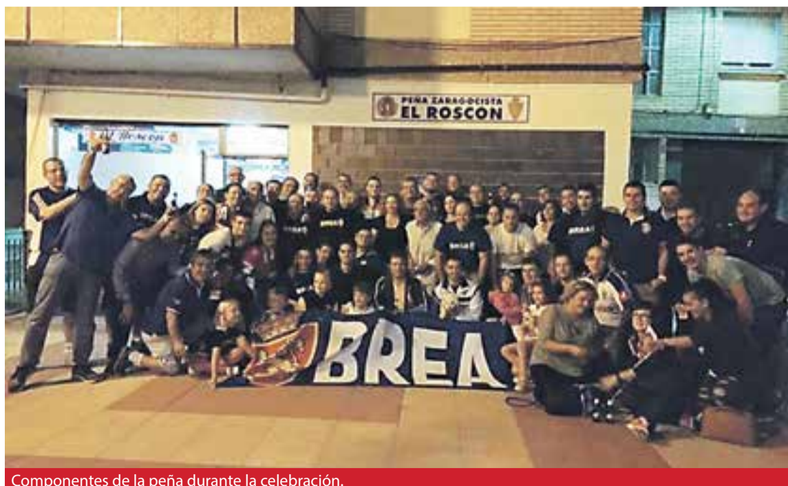
Componentes de la peña durante la celebración.

vez más, su compromiso, apoyo y vinculación con el sentimiento zaragocista. ☞