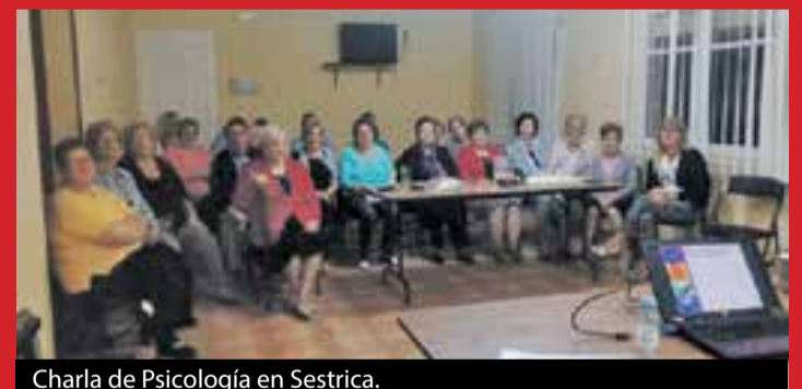
Charla de Psicología en Sestrica.

requiere de un aprendizaje de estrategias para hacerle frente y poder convivir con ella. Cuando la ansiedad interfiere de manera importante en nuestra vida, aparte de la medicación (que no cura, solo atenúa los síntomas) y es usada erróneamente como primera opción, es necesaria la ayuda de un profesional de la psicología. ◀