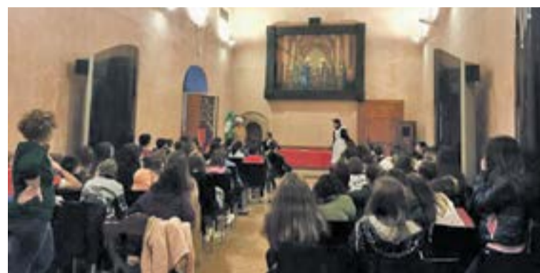
Representación teatral en la Sede Comarcal.