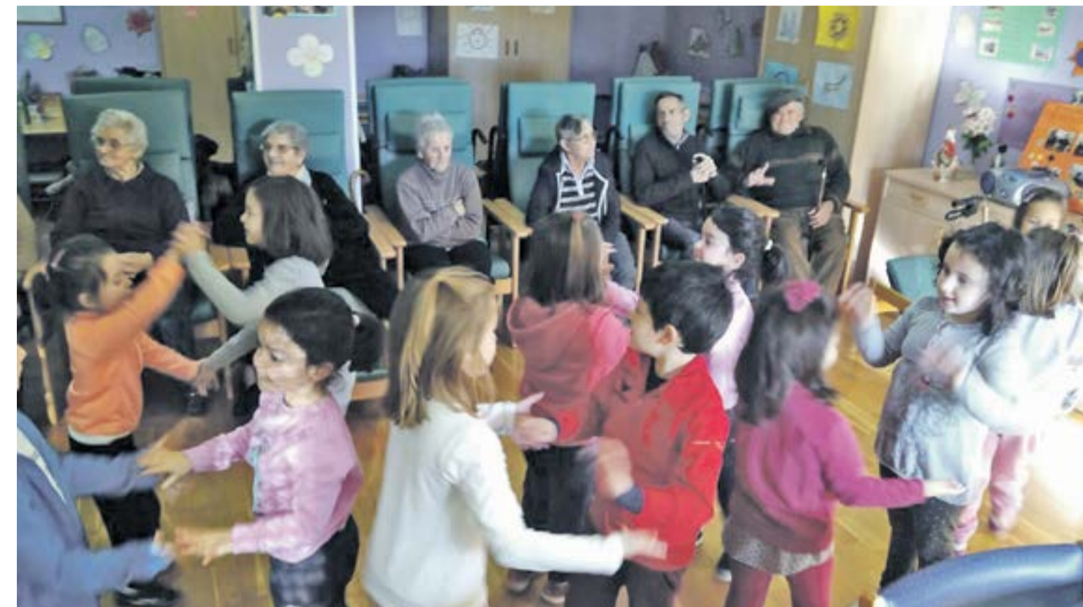
Taller intergeneracional, Centro de Día Brea de Aragón.

Y después del almuerzo, el taller intergeneracional ha finalizado con la realización de una manualidad consistente en un árbol navideño que cada uno se ha podido llevar a su casa.