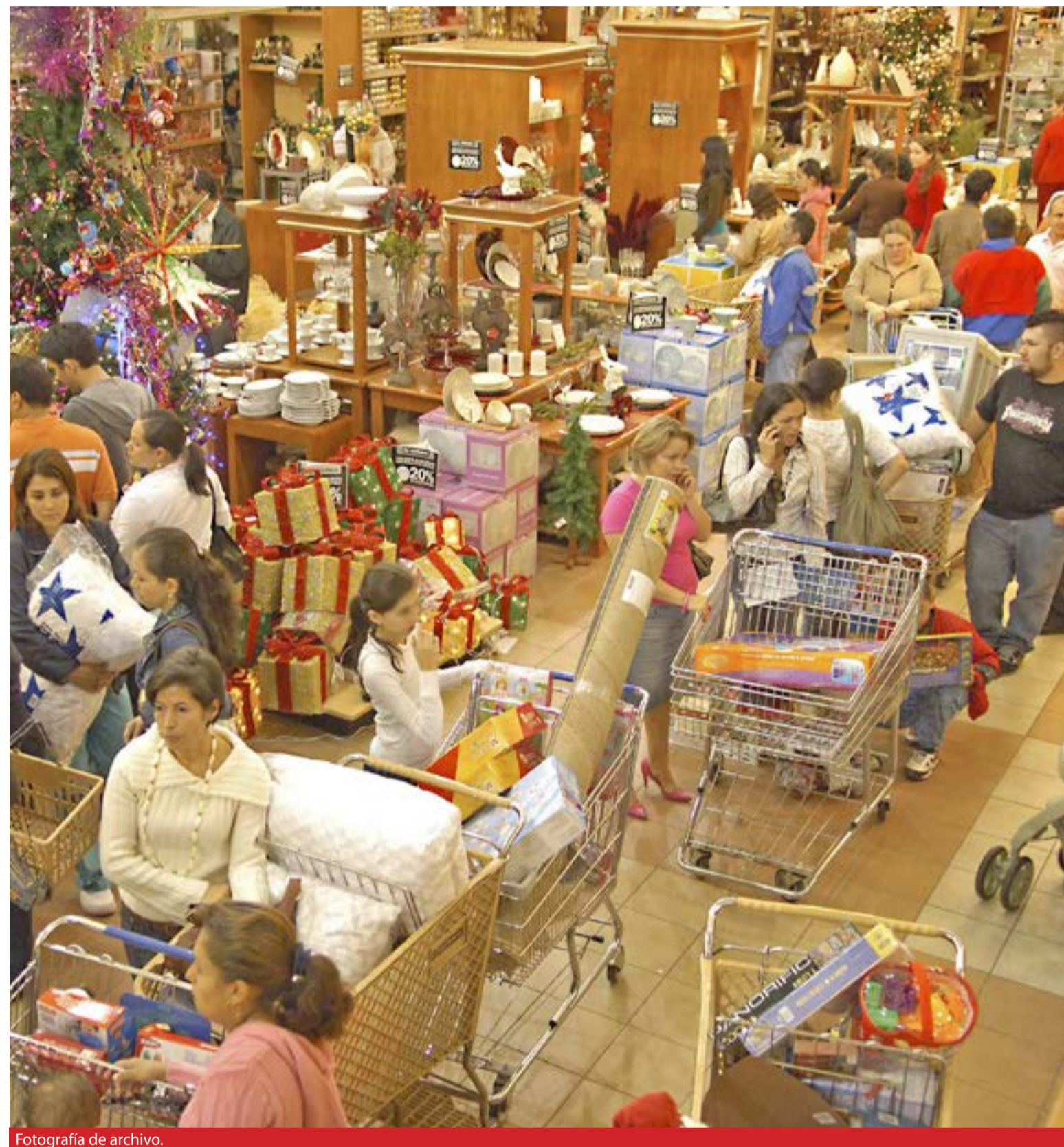
Fotografía de archivo.

• El establecimiento es libre de modificar su política de ventas en período de rebajas, como adoptar otras medidas de pago con tarjeta, el plazo de aceptación de cambios