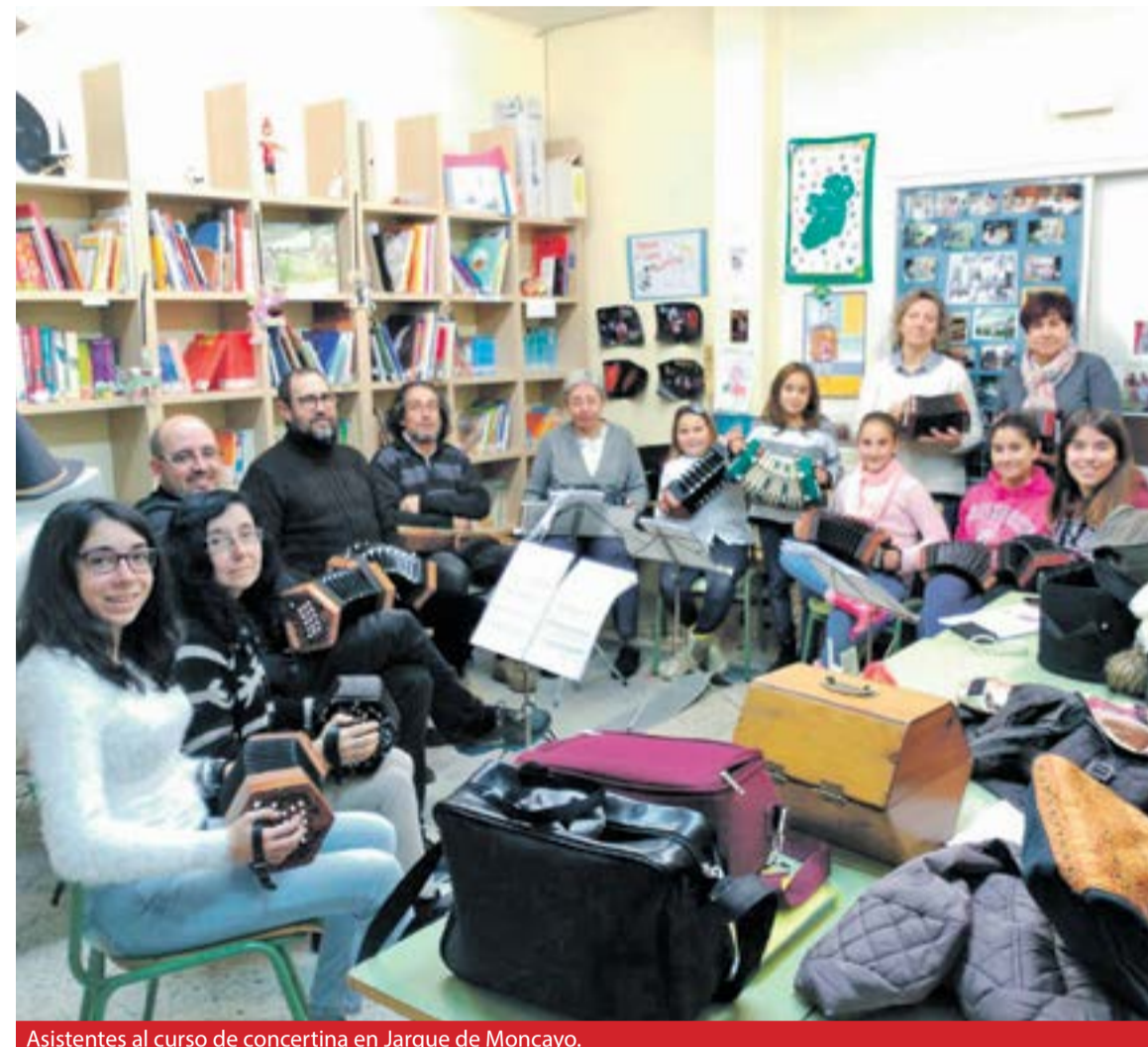
Asistentes al curso de concertina en Jarque de Moncayo.

forma hexagonal u octogonal y teclados cantantes en ambas caras o cubiertas. Aunque es más pequeño y más ligero que un acordeón, resulta un poco más complicado de tocar ya que tiene aproximadamente el mismo rango que un violín. ◀