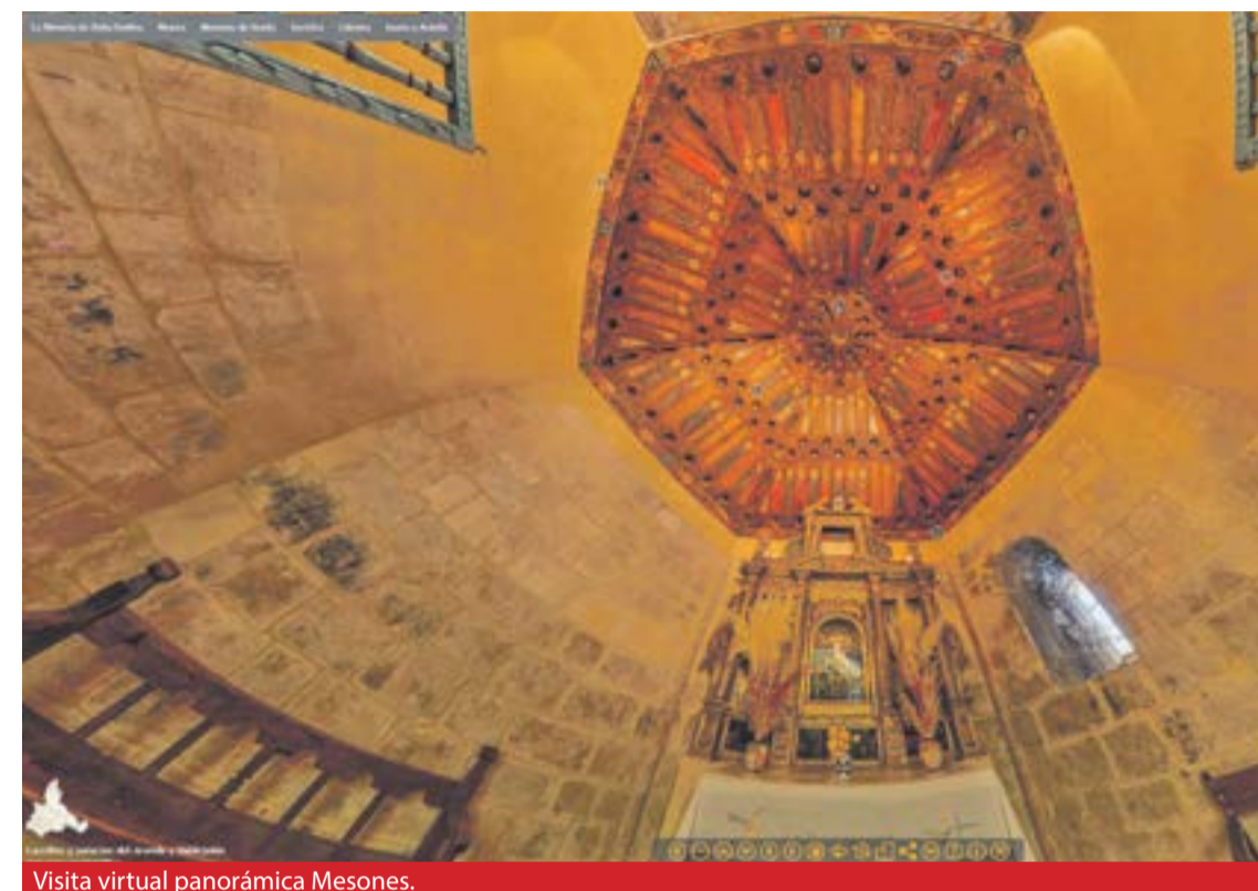
Visita virtual panorámica Mesones.