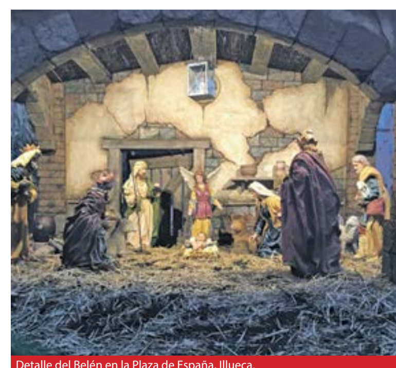
Detalle del Belén en la Plaza de España, Illueca.