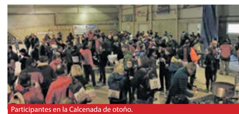
Participantes en la Calcenada de otoño.

organizada por la sección deportiva de la Asociación Amigos de la Villa de Calcena con la colaboración del Ayuntamiento y de otras entidades e instituciones como la Diputación de Zaragoza. El recorrido de 21 kilómetros para corredores y senderistas