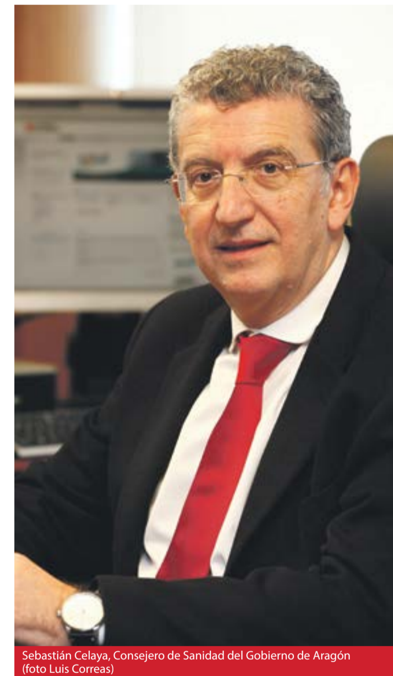
Sebastián Celaya, Consejero de Sanidad del Gobierno de Aragón

Además de una mejora notable en cuanto a la amplitud de los espacios, lo que redundará en el confort de profesionales y usuarios, gracias a las nuevas instalaciones se podrá incorporar el servicio de rehabilitación. Para ello, en la segunda planta del nuevo centro hay una sala polivalente de 41,13 metros cuadrados, junto con un vestuario y un almacén pensado para dicho servicio. En cuanto al resto de las actividades y servicios, se mantienen dos consultas de medicina de familia y enfermería y los actuales días de consulta de pediatría y matrona. ☛