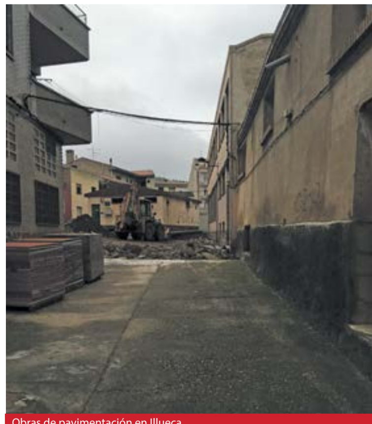
Obras de pavimentación en Illueca.

acciones enmarcadas dentro de los distintos planes de infraestructuras y equipamientos que subvenciona la Diputación de Zaragoza. ☛