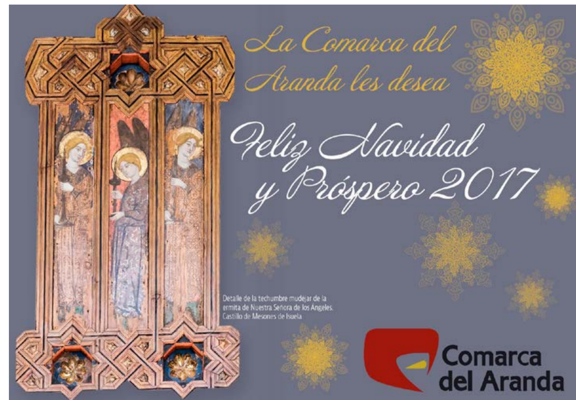
Detalle de la techumbre mudéjar de la ermita de Nuestra Señora de los Angeles. Castillo de Mesones de Isuela