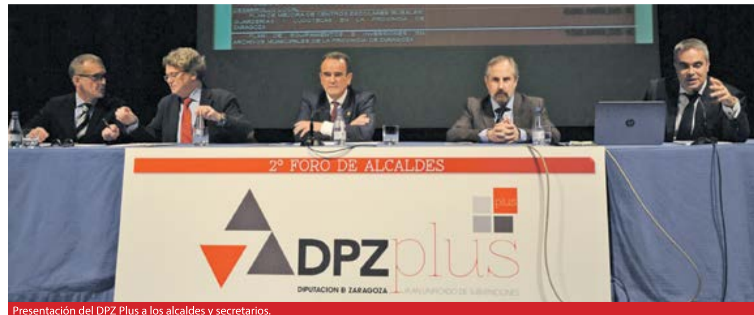
Presentación del DPZ Plus a los alcaldes y secretarios.