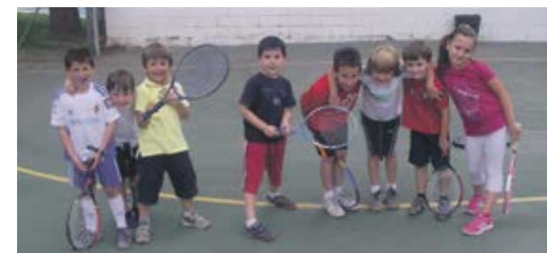
Alumnos de la Escuela comarcal de Tenis.

Departamento de Deportes de la Comarca del Aranda