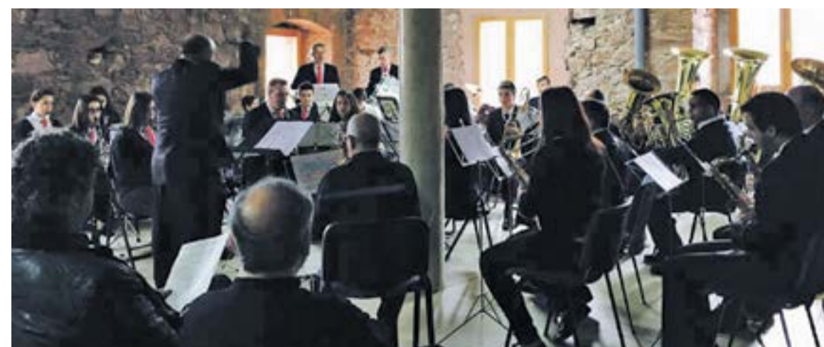
Concierto en Gotor.

Cultura y Patrimonio de la Diputación de Zaragoza. Una auténtica delicia para los numerosos asistentes. ◀