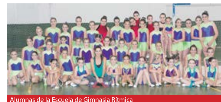
Alumnas de la Escuela de Gimnasia Rítmica

de gimnasia rítmica. Los padres podrán comprobar todo lo que sus hijas han aprendido en este primer trimestre en la Escuela de Gimnasia Rítmica.