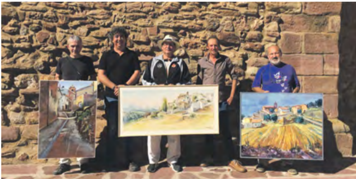
Los ganadores con sus obras junto a miembros del jurado.

El IV Concurso de Pintura Rápida organizado por la Comarca del Aranda se celebró el 2 de septiembre