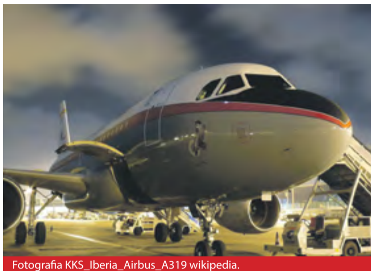
Fotografía KKS_Iberia_Airbus_A319 wikipedia.

1. Realizar una reclamación a la compañía aérea correspondiente. Lo puede hacer a través de las hojas de reclamaciones que las compañías aéreas deben tener a disposición en los mostradores de información o puntos de venta de billetes en los aeropuertos o bien usando el formulario para reclamar ante una compañía aérea (en la web de AESA).