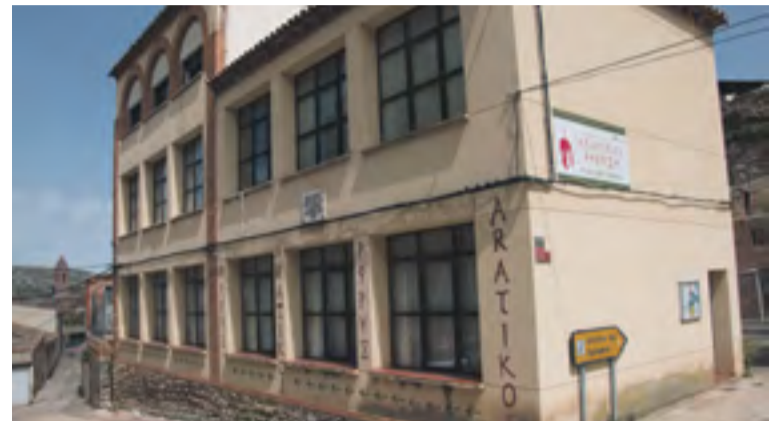
Espacio Expositivo Aratikos en Aranda.

Desde la Comarca del Aranda se apuesta fuerte por el turismo y se invierte continuamente en su fomento y desarrollo. Desde 2007 se ha abierto un nuevo centro turístico comarcal cada año y los precios de los servicios turísticos comarcales se han mantenido sin incrementos desde 2012. ◀