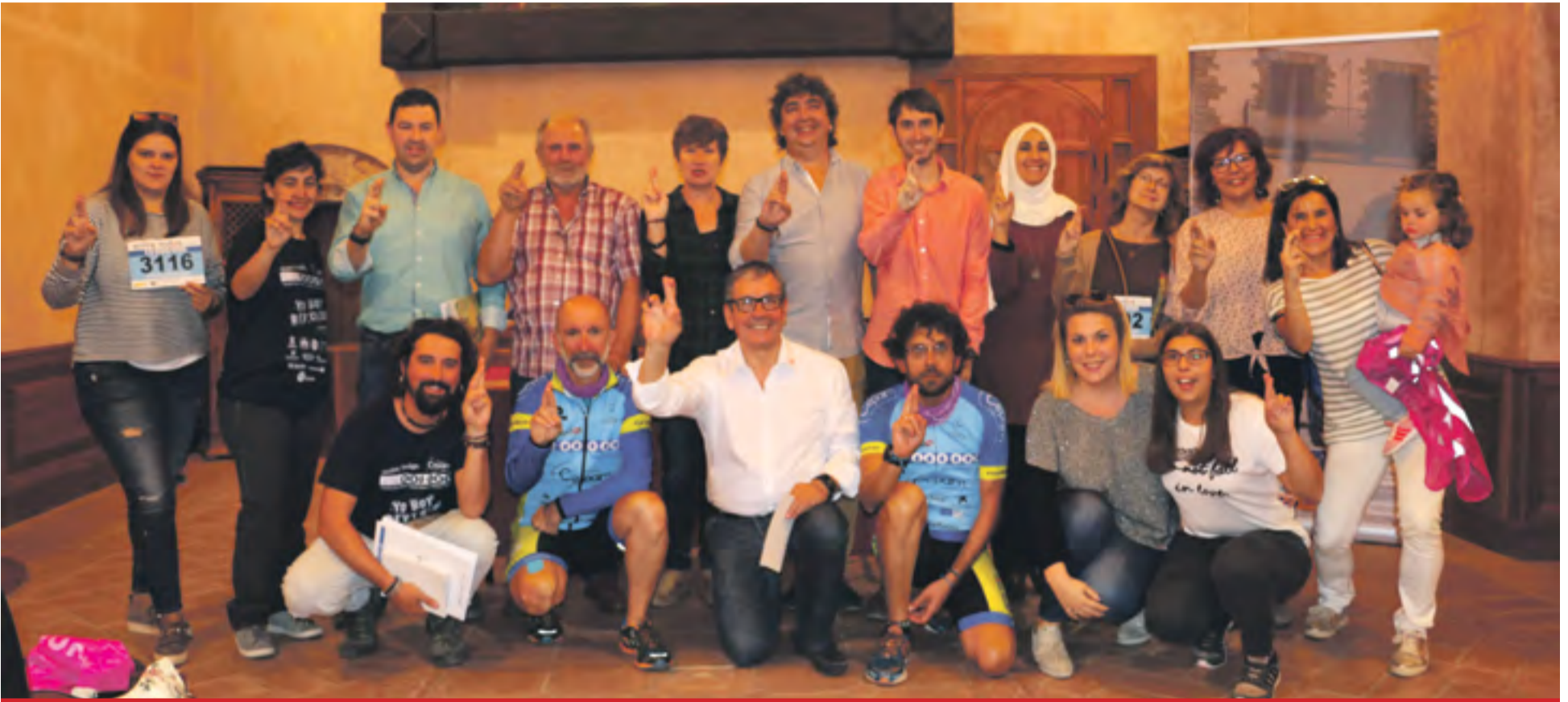
Miembros de la organización y representantes asistentes al acto.