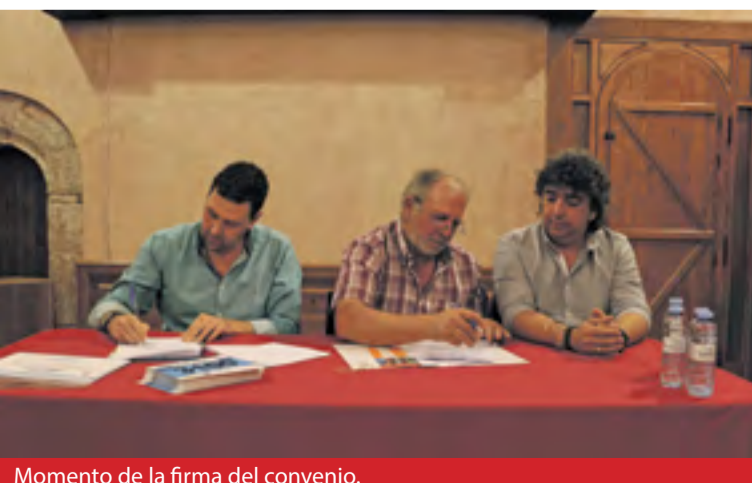
Momento de la firma del convenio.