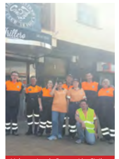
Voluntarios de Protección Civil.

estuvieran como refuerzo en Calceña acompañando a los voluntarios de Protección Civil de la Comarca del Aranda durante la jornada de celebración de la Calcenada.