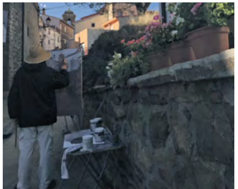
Uno de los pintores trabajando en su obra.

La pintura rápida es una modalidad que se realiza al aire libre y que requiere terminar la obra en una sola jornada o incluso en unas pocas horas. ☛