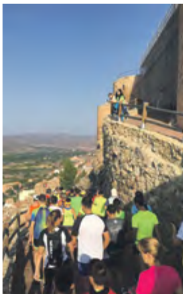
Participantes del 10K en la salida.