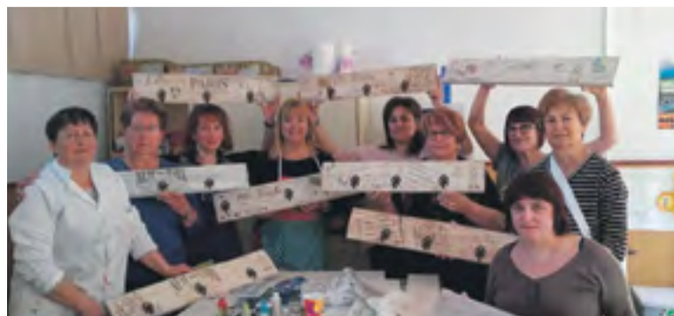
Socias de la Asociación Virgen del Capítulo.

La asociación siempre ha contado con el apoyo de la institución municipal, ocupando dos salones propiedad de la misma, y de la institución comarcal, ya que gracias al