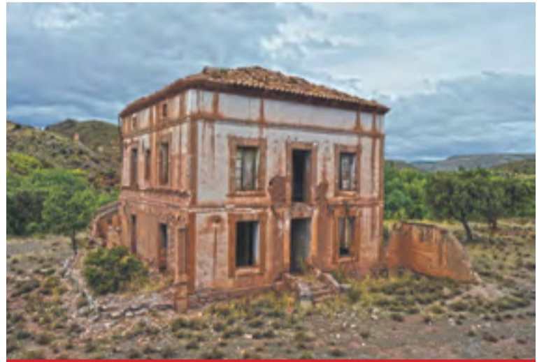
Fotografía incluida en el calendario de 2017, mes de abril.