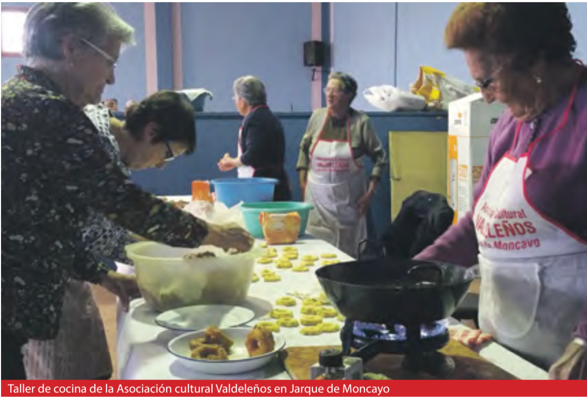
Taller de cocina de la Asociación cultural Valdeleños en Jarque de Moncayo

El gasto total derivado de la concesión de subvenciones asciende a 52.100 euros