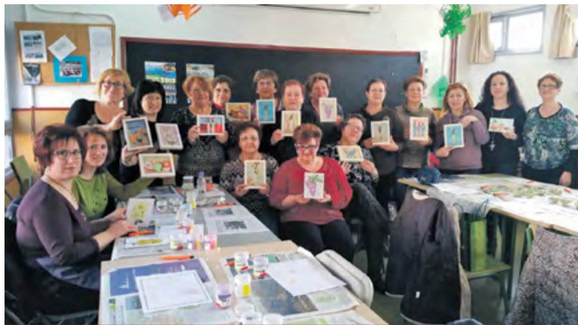
Mujeres de Trasobares mostrando sus manualidades.

Algo que resaltan las mujeres que conforman la junta o la han conformado es la gran participación de los vecinos de la localidad y su disponibilidad a ayudar cuando es necesario. Las actividades que más aceptación tienen son los viajes culturales y los talleres de manualidades o de cocina, sirviendo éstos últimos para pasar muy buenos ratos degustando las delicias culinarias que preparan las socias: postres tradicionales como buñuelos acompañados de rico chocolate caliente, platos típicos de la zona como las migas... Lo más complicado es que se involucren la mujeres de más edad de la localidad, pero esto se compensa con la gran ilusión y trabajo de las más jóvenes que tienen como objetivo principal el desarrollo personal de las mismas y que su municipio se convierta en un espacio de encuentro acogedor para todas las personas que, por uno u otro motivo, visitan Trasobares de forma habitual. ◀