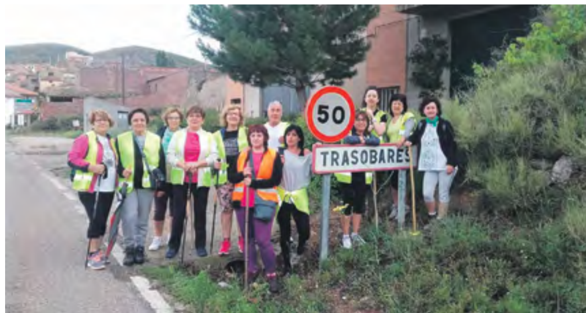
Las trasobarinas durante una andada.