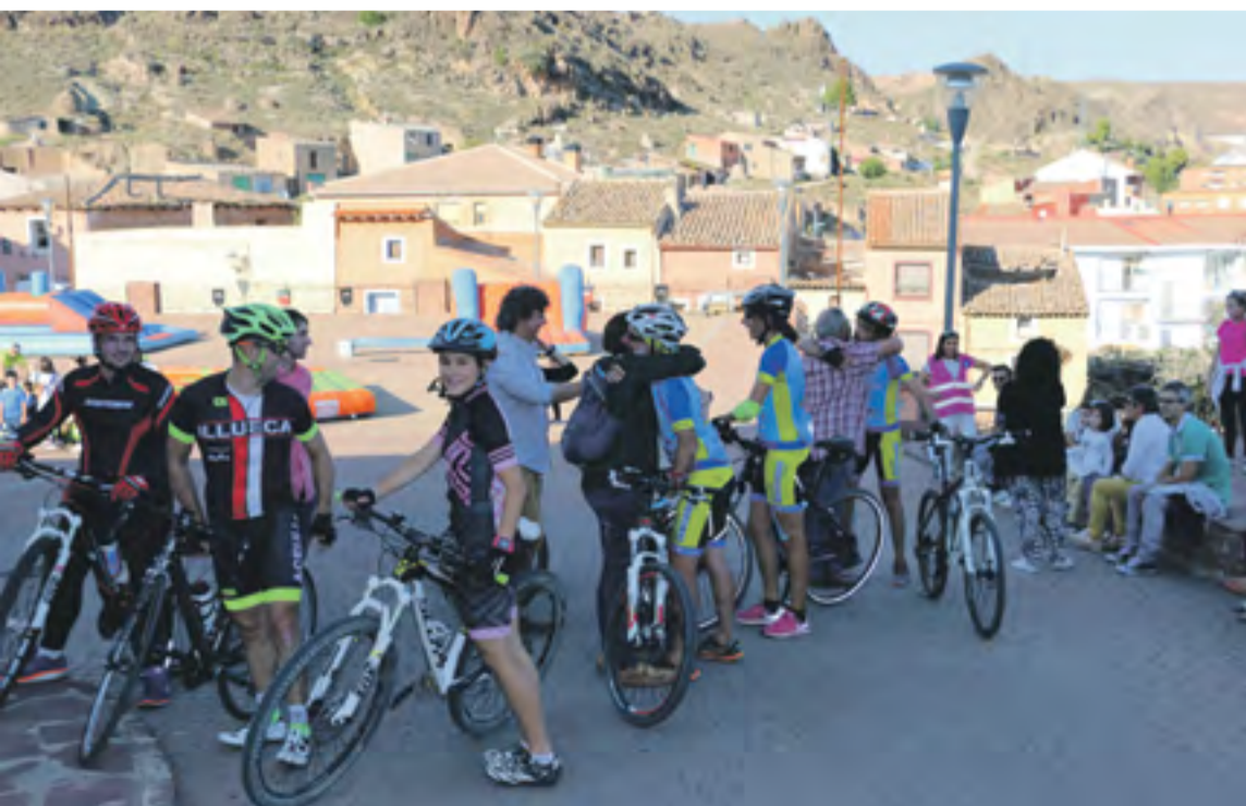
Llegada de los ciclistas de Cepaim acompañados del Club Ciclista Aceulli.