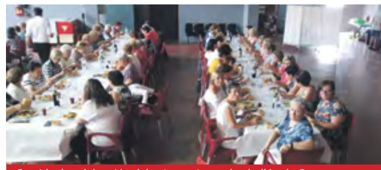
Comida de celebración del aniversario en el pabellón de Gotor.

La Junta de la asociación obsequió a cada socia con un bonito detalle. ☑