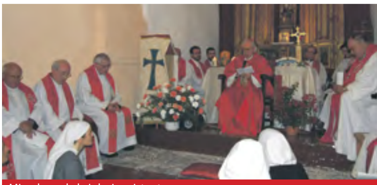
Miembros de la Iglesia asistentes.