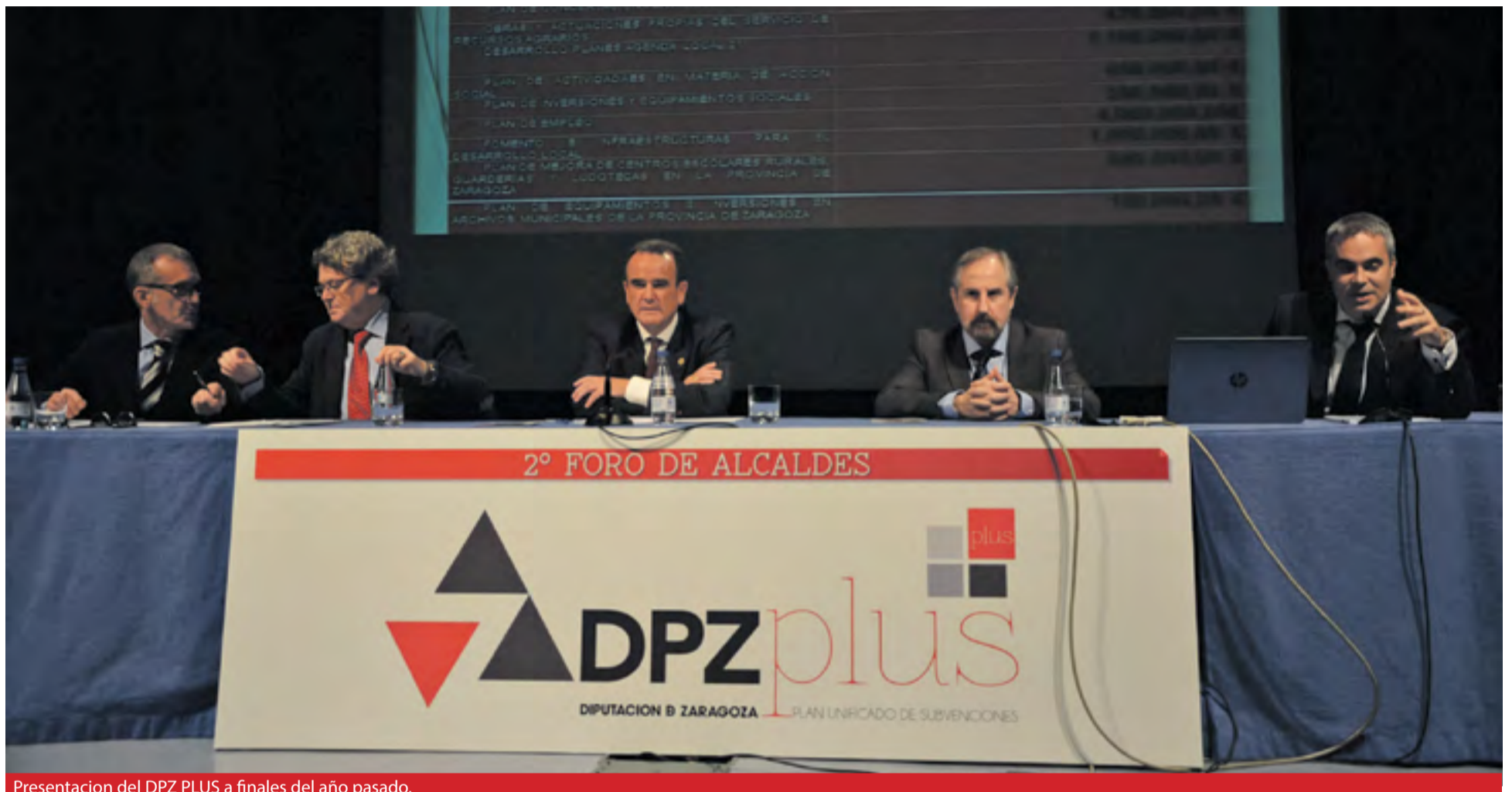
Presentación del DPZ PLUS a finales del año pasado.

El PLUS vuelve a contar con 50 millones de euros, de los que 46,5 se distribuirán como el año pasado y otros 3,5 millones de concertación lineales y sin finalidad