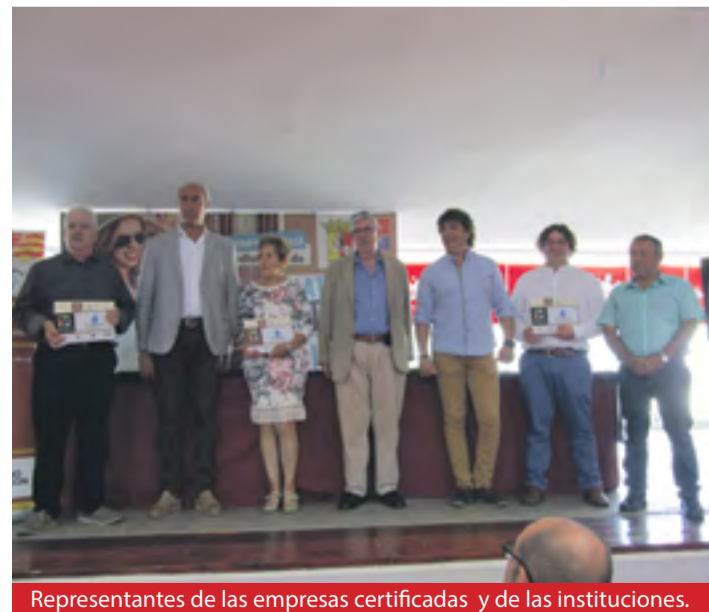
Representantes de las empresas certificadas y de las instituciones.

mente en las Comarcas de Calatayud y del Aranda, desarrollan su actividad en los sectores de los alojamientos -Complejo Turístico Rural "Lifara" de Aniñón y Apartamentos Rurales "Mundóbriga" de Munébrega- y de las almazaras -SAT 2563 Niño Jesús de Aniñón y Cooperativa Sierra Vicort de Sediles-. ◀