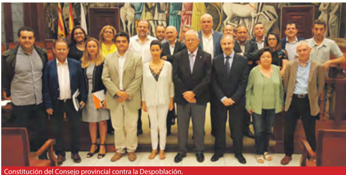
Constitución del Consejo provincial contra la Despoblación.

Este nuevo órgano tiene como fin catalizar las medidas propuestas por la universidad y los agentes sociales y económicos para potenciar el desarrollo rural en coordinación con otras instituciones