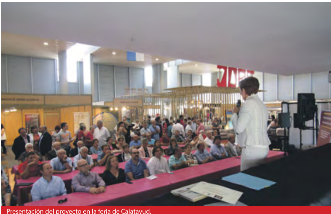
Presentación del proyecto en la feria de Calatayud.