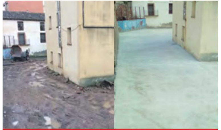
Patio de las escuelas de Aranda antes y después del acondicionamiento.