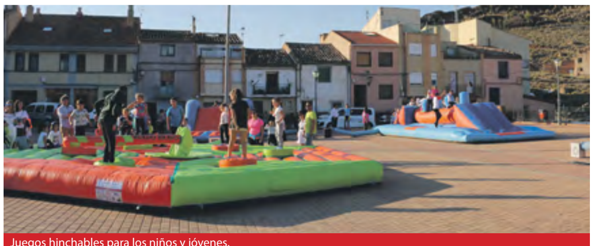
Juegos hinchables para los niños y jóvenes.