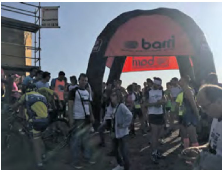
Corredores esperando la salida.

decio “la implicación de todos: de los participantes que acudieron a disfrutar de nuestros montes y pueblos, de los patrocinadores que colaboran económicamente para la celebración de la carrera y de los voluntarios que desinteresadamente aportan todo lo posible para que el Trail sea posible”.