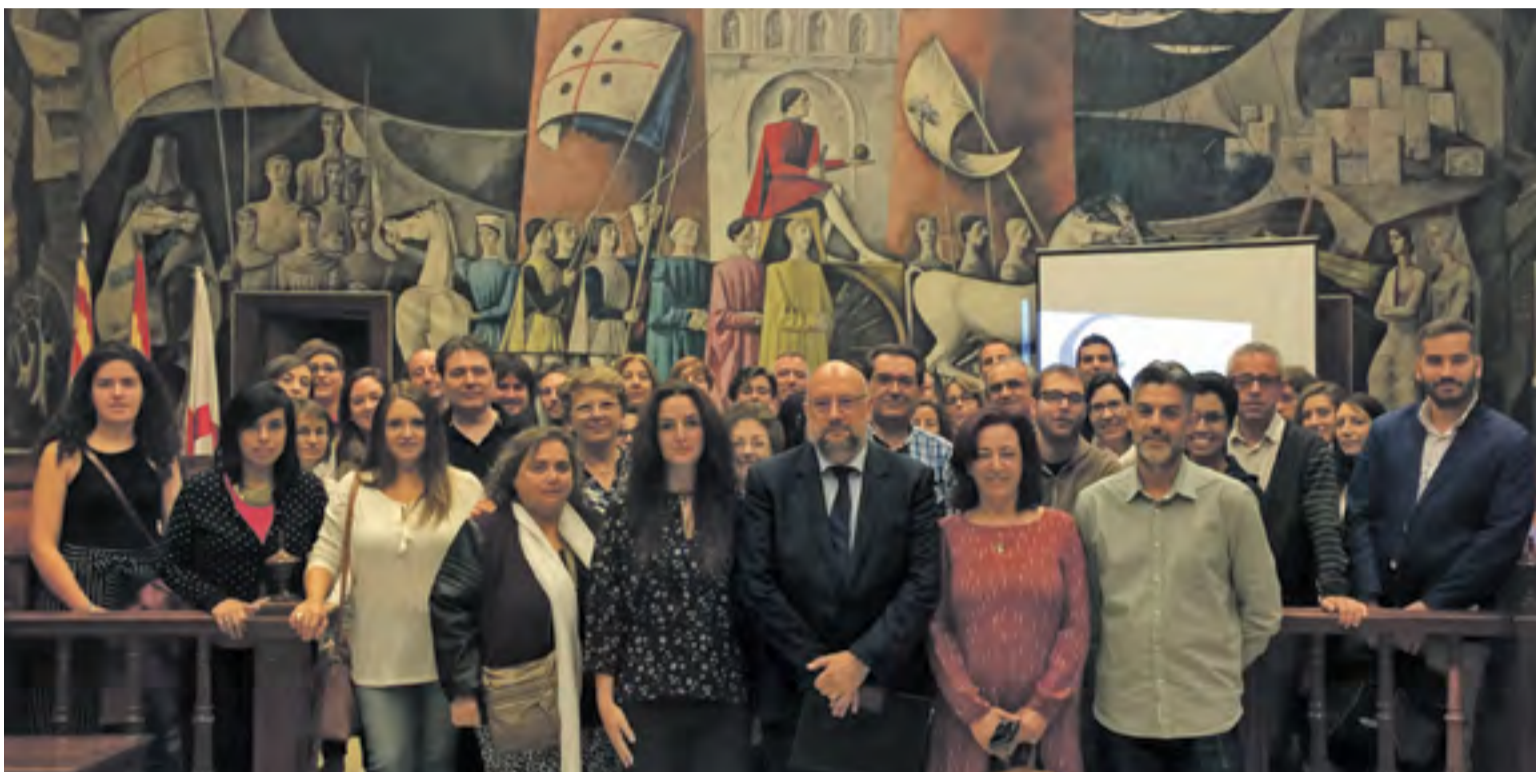
Asistentes a la sesión informativa.

La iniciativa se enmarca dentro del proyecto europeo Global Schools y tiene como objetivo generar una ciudadanía aragonesa crítica, activa y comprometida con la construcción de una sociedad justa y solidaria