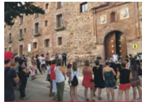
Visita guiada en el Convento de Gotor.