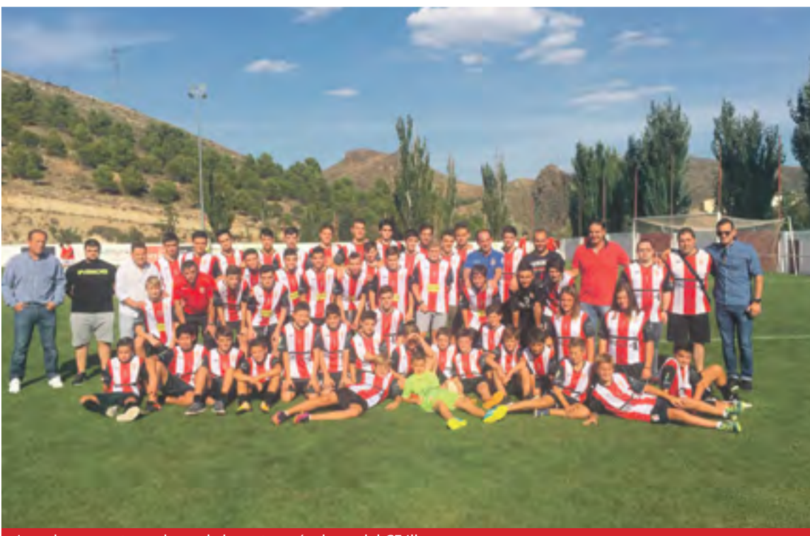
Jugadores y entrenadores de las categorías base del CF Illueca.

Alevín F8, Infantil, Cadete y Juvenil arrancan la temporada llenos de ilusión.