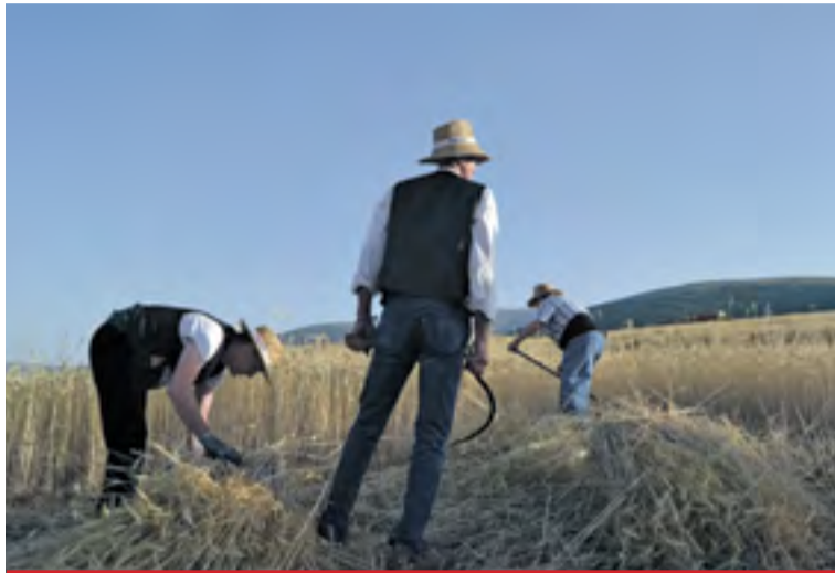
Fotografía incluida en el calendario de 2017, mes de agosto.

La participación está abierta hasta el 20 de octubre; puede ser individual o colectiva, con tema y formato libres, incluyendo en el trabajo la localización que plasma la imagen. Cada trabajo seleccionado recibirá un premio de 50 euros. ☛