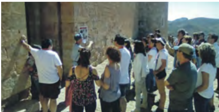
Visita teatralizada en el Castillo de Mesones.