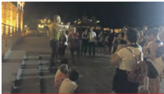
Visita teatralizada por el casco antiguo de Illueca.