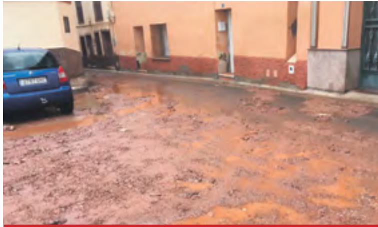
Imagen de Brea tras la tormenta.