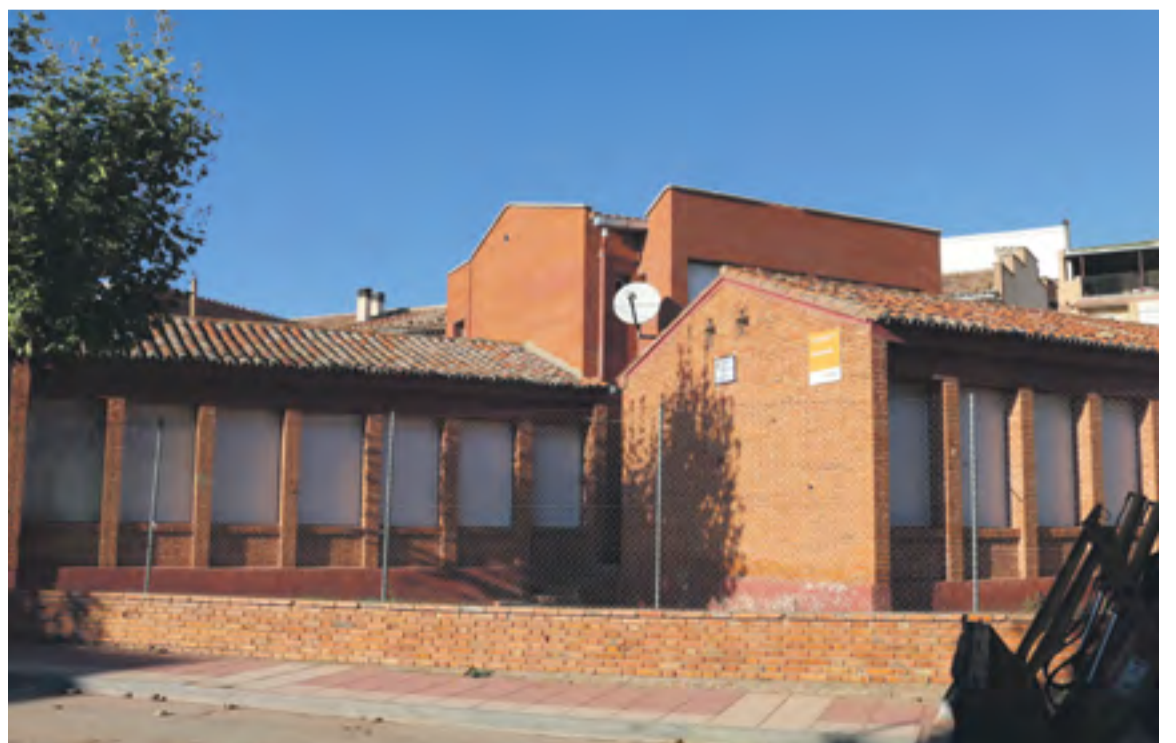
Nuevas persianas instaladas en la escuela de Mesones.

joras en las instalaciones del Colegio Vicort-Isuela y se han instalado nuevas persianas en las ventanas de las aulas. ☛