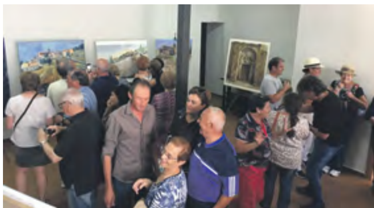
Exposición de las obras participantes.

vecharon para disfrutar de la exposición de todas las obras participantes e incluso algunos compraron las pinturas que más les gustaron.