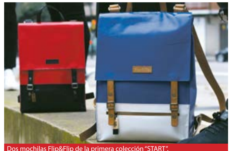
Dos mochilas Flip&Flip de la primera colección "START".