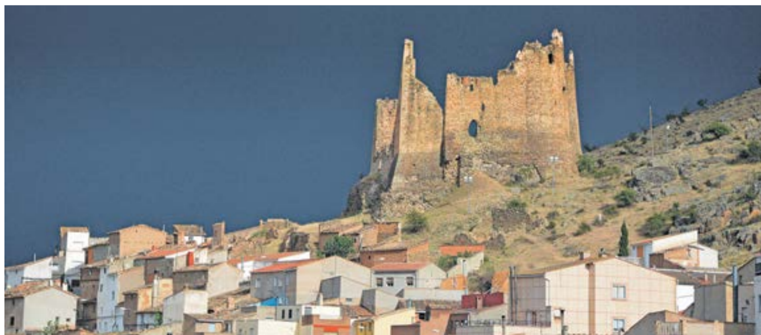
Vista panorámica de Jarque y su castillo.

Los trabajos que están contemplados son los siguientes: el vaciado general de escombros del interior del castillo; el saneado y consolidación de los restos de almenados, parapetos y adarves; la estabilización de los muros, el cosido de las grietas y la conso-