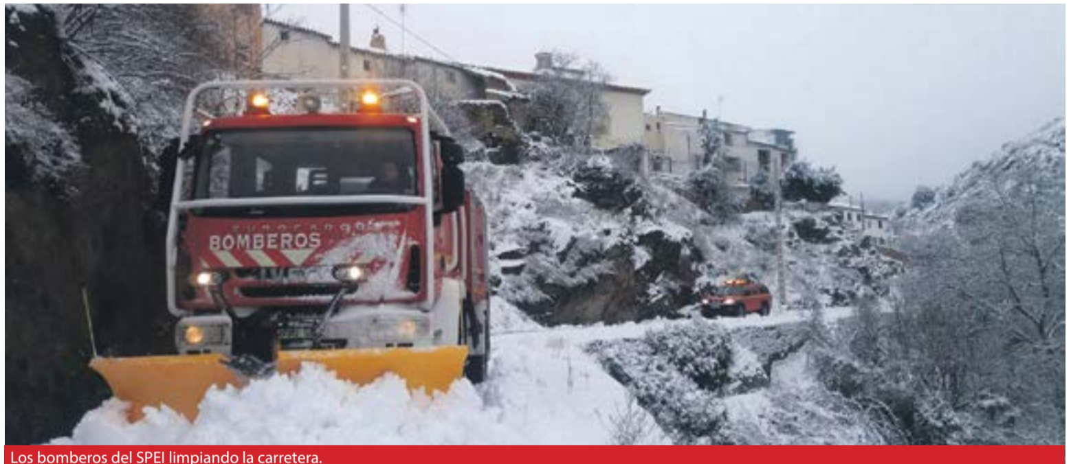
Los bomberos del SPEI limpiando la carretera.

Dentro del apartado de incendios, los fuegos agrícolas volvieron a ser los más frecuentes con 665 actuaciones. Además, los bomberos de la Diputación de Zaragoza sofocaron 159 incendios en viviendas y otros edificios; 72 fuegos en industrias y almacenes; 109 incendios en camiones y turismos; y 141 fuegos urbanos –árboles, contenedores, solares...–.