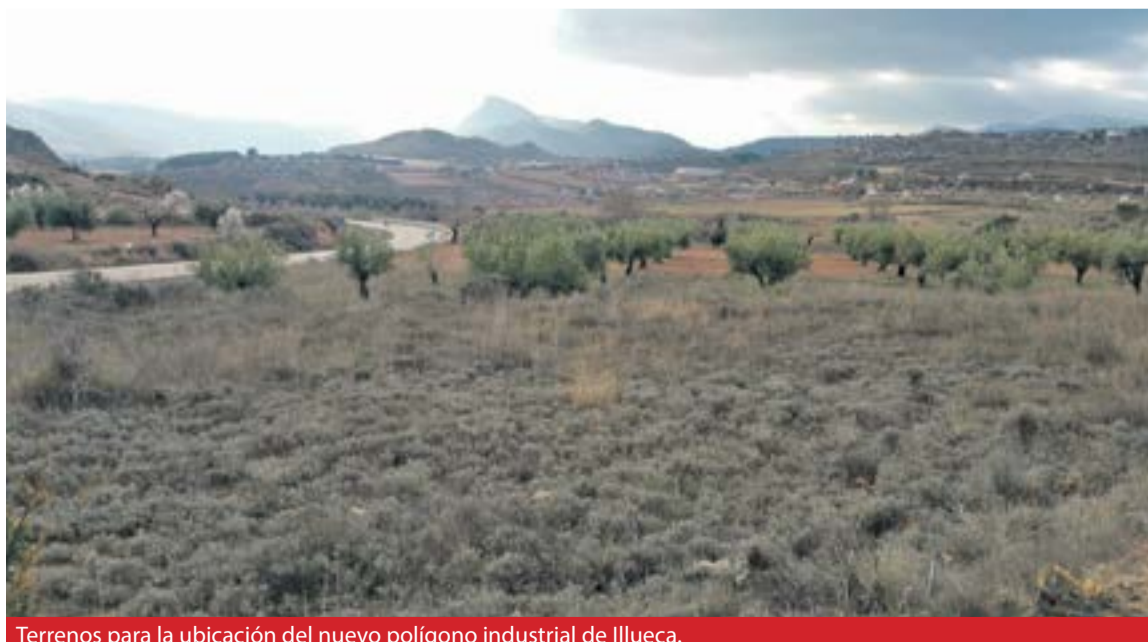
Terrenos para la ubicación del nuevo polígono industrial de Illueca.

Por otra parte, desde el consistorio se va a elaborar un proyecto urbanístico para la rehabilitación de la zona del Castillo como punto de partida para la mejora del casco antiguo de Illueca. ◀