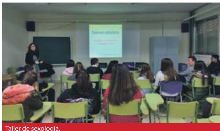
Taller de sexología.

En una encuesta realizada a adolescentes españoles de 14 a 29 años, sólo el 18,8% habían obtenido la información sexual de su padre o de su madre; y la mayoría de ellos, casi el 65%, se habían informado preferentemente a través de sus amigos.