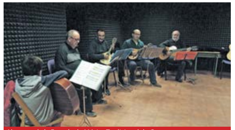
Alumnos de la Escuela de Música Tradicional de Gotor.