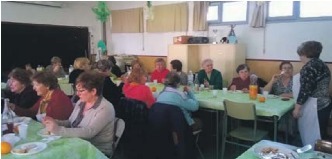
Mujeres de la Asociación Virgen del Capítulo de Trasobares en la celebración del Día de la Mujer Trabajadora.