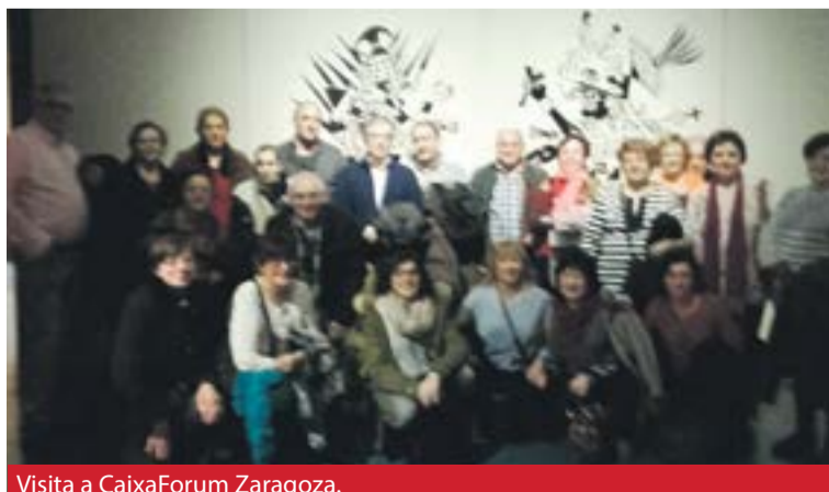
Visita a CaixaForum Zaragoza.

Las mujeres de la Asociación Virgen del Capítulo de Trasobares disfrutaron en CaixaForum Zaragoza de una interesante visita guiada por la exposición "El arte mochica del antiguo Perú"; una experiencia muy enriquecedora, en la que pudieron descubrir el gran conocimiento de las narrativas cosmológicas y mitológicas que permitían explicar el mundo según esta antigua sociedad. ☛