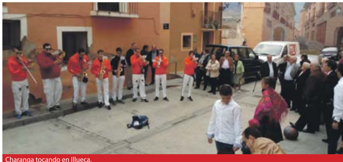
Charanga tocando en Illueca.

La banda municipal de Brea de Aragón se creó en 2006 por un grupo de personas de diferentes edades, sin nociones de música pero con una gran ilusión por aprender y disfrutar. Tras meses de intensa preparación musical, la banda municipal celebró su primer concierto en la Iglesia Parroquial de Brea. Desde entonces ha participado en procesiones, pasacalles, conciertos populares y muchos otros