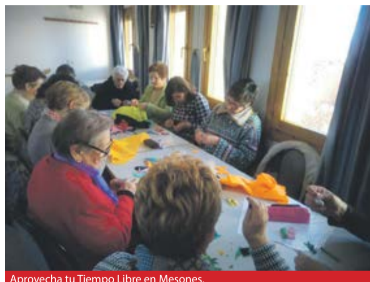
Aprovecha tu Tiempo Libre en Mesones.

El proyecto surge en el año 2009 y en la actualidad priman los mismos objetivos: dinamizar a las personas adultas y mayores de toda la comarca para que puedan aprovechar su tiempo libre, evitando el aislamiento y la soledad, la pérdida de memoria, potenciando las relaciones sociales y creando nuevos hábitos de relación entre ellos. ◀