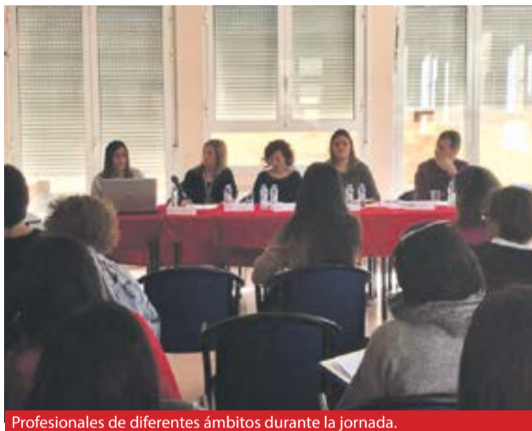
Profesionales de diferentes ámbitos durante la jornada.

requieran una intervención de Atención Temprana, así como de las necesidades puntuales de cada menor.