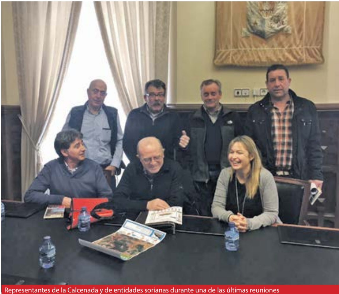
Representantes de la Calcenada y de entidades sorianas durante una de las últimas reuniones

La Fundación para el Desarrollo Social, entidad que gestiona la residencia, interpuso un recurso de reposición contra la denuncia del actual contrato de gestión por parte de la Comarca