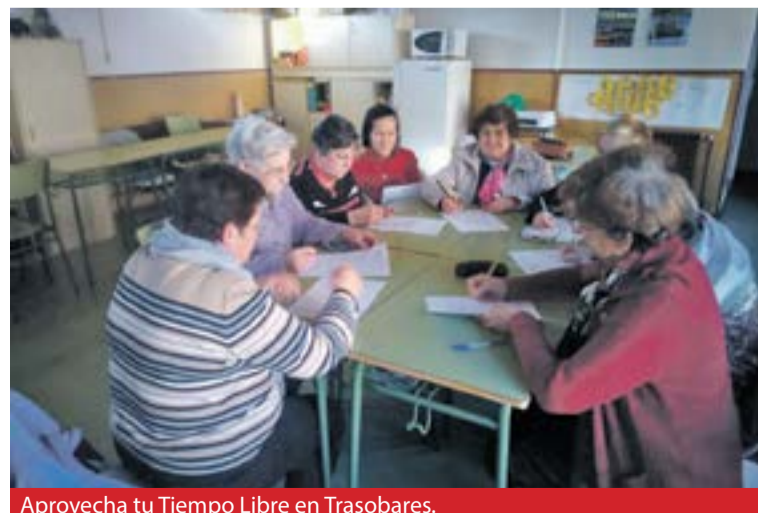
Aprovecha tu Tiempo Libre en Trasobares.