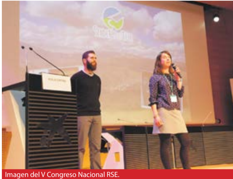
Imagen del V Congreso Nacional RSE.

La pasión de Senderos de Teja por los pueblos es su motor. El 90% del territorio español es rural y sólo el 20% de la población vive en él. A través de acciones adaptadas a las particularidades de cada territorio, estos jóvenes han logrado un impacto social positivo mediante el asentamiento de la población. La gestión que desarrollan en el Albergue Municipal de Calcena y en el Camping Municipal de Trasobares son dos de sus actuaciones más destacadas, en combinación con la práctica de la escalada en un territorio especialmente deseado para los aficionados a este deporte. Pero los integrantes de Senderos de