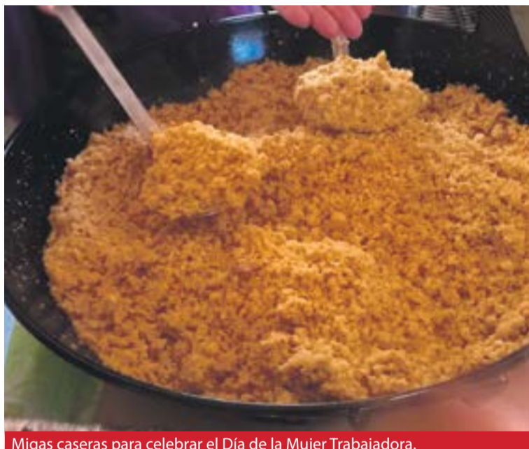
Migas caseras para celebrar el Día de la Mujer Trabajadora.

El broche de oro de la semana de la mujer trabajadora correrá a cargo del grupo Escuela cómica suicida, con su actuación en la