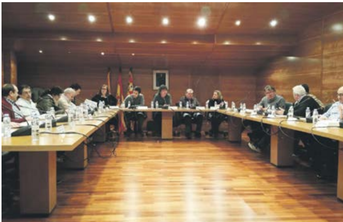
Consejo comarcal celebrado el lunes 6 de marzo.

Lugar: 4ª Planta. Sala de Plenos Comarca del Aranda