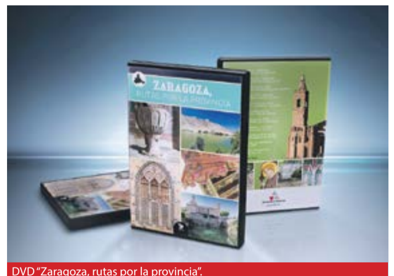
DVD "Zaragoza, rutas por la provincia".

La serie se inició con 'La tierra que vio nacer a Fernando II de Aragón', un viaje por Sos del Rey Católico y por otras localidades de las Altas Cinco Villas y de la Jacetania zaragozana. Después se editó 'Castillos y palacios del Aranda y Valdejalón', que remonta los ríos Jalón, Aranda e Isuela abarcando también varios municipios de la Comunidad de Calatayud. Y también se