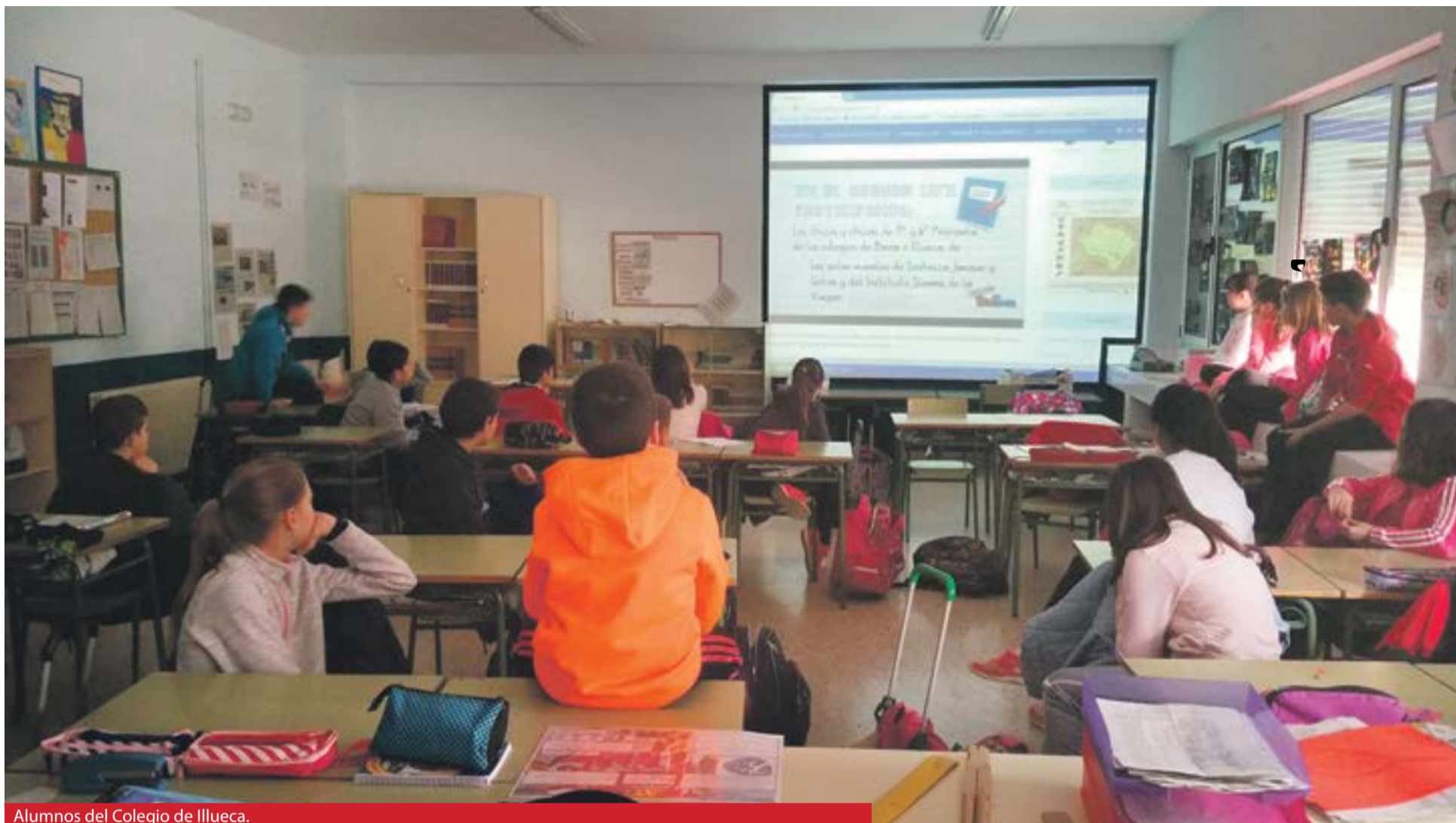
Alumnos del Colegio de Illueca.