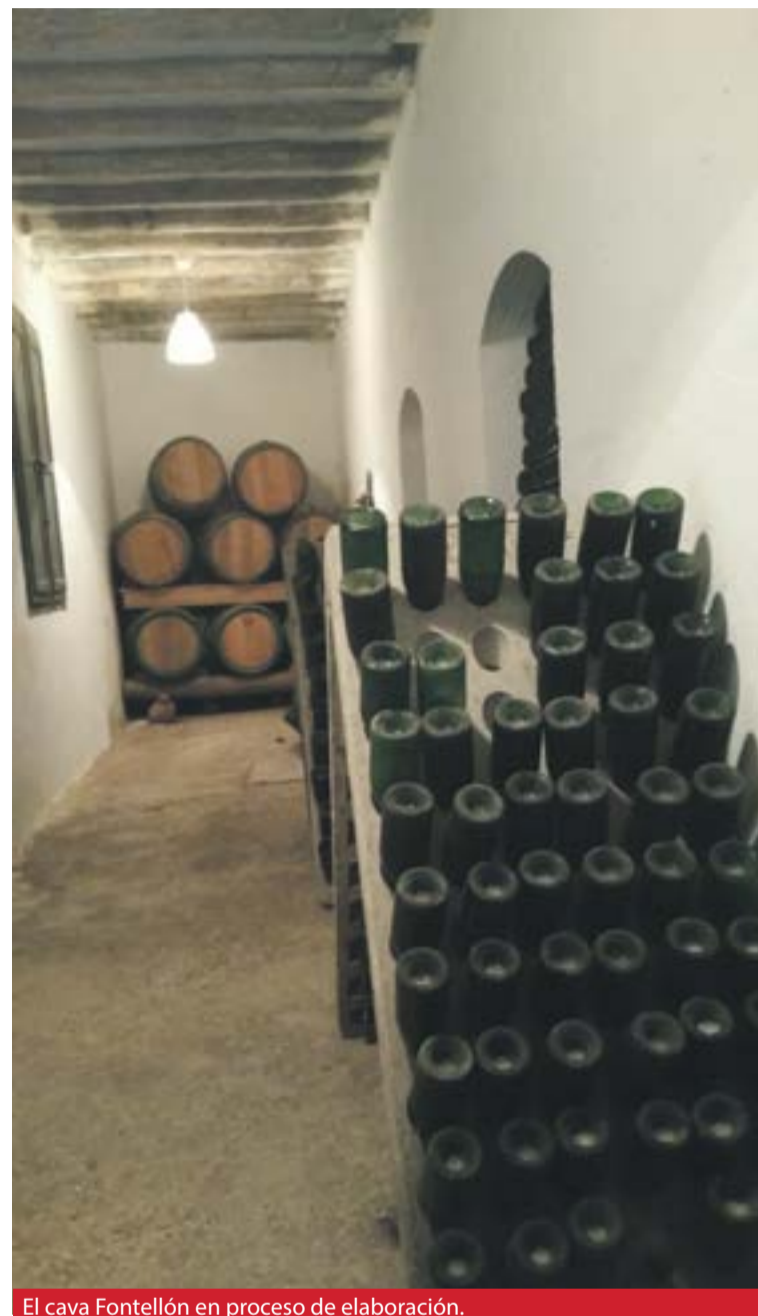
El cava Fontellón en proceso de elaboración.

Pues podemos decir orgullosos que es un cava muy reconocido y muy valorado en otras comunidades autónomas con gran tradición de cava donde hemos estado llevando nuestras botellas durante años. Hace un tiempo teníamos incluso un punto de venta