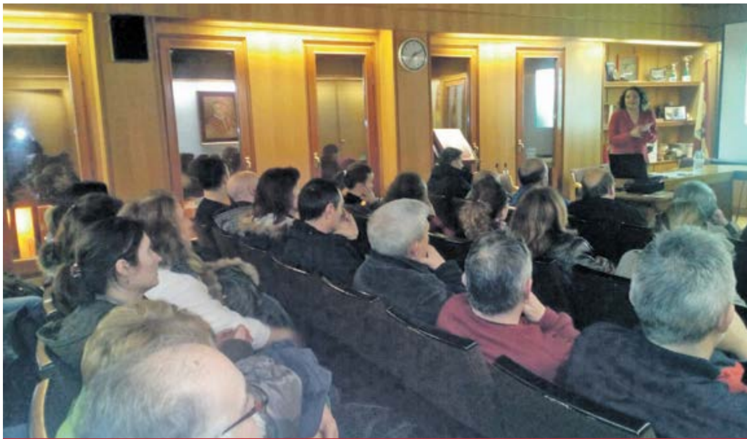
Charla informativa sobre las reclamaciones por cláusulas suelo.

res el cálculo del importe a percibir en cada caso, incluidos los intereses, se han creado simula-