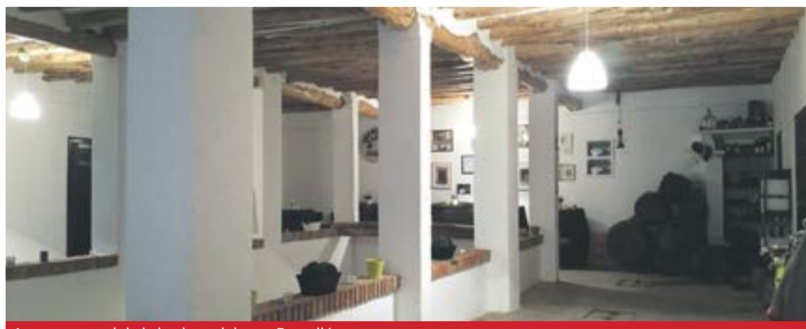
Aspecto actual de la bodega del cava Fontellón.