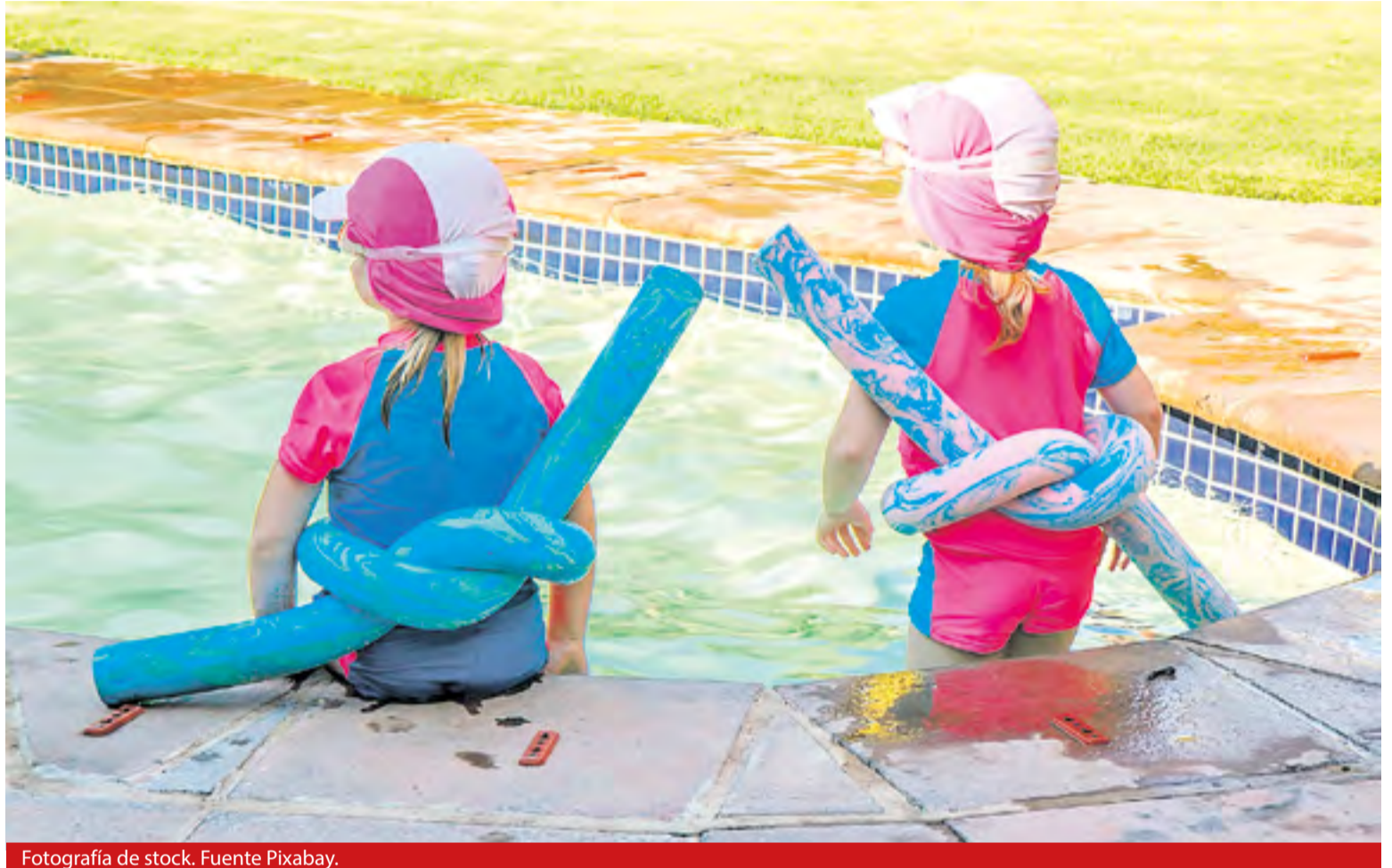
Fotografía de stock.

Vestuarios y aseos, el recinto debe de tener aseos y vestuarios limpios y desinfectados diariamente a disposición de los usuarios