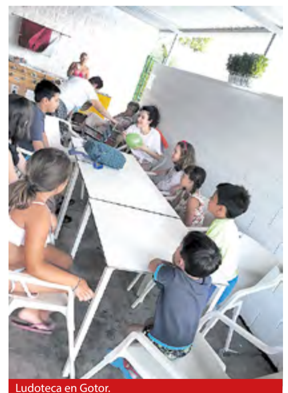
Ludoteca en Gotor.