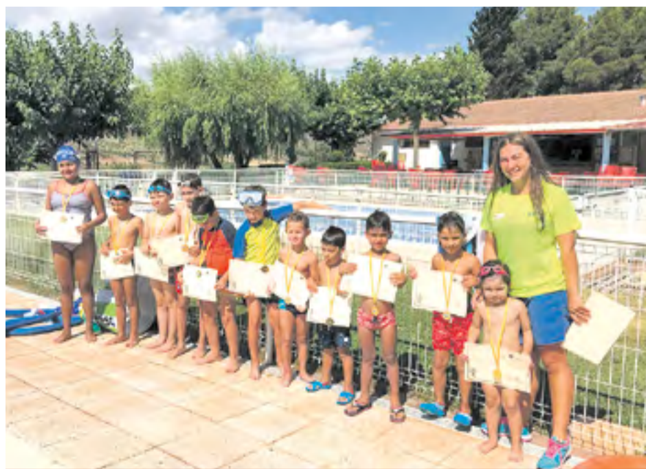
Curso de natación en Mesones.