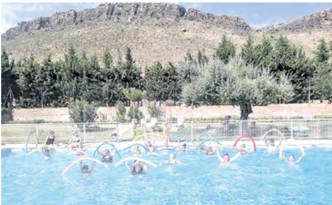
Aquagym en Mesones.