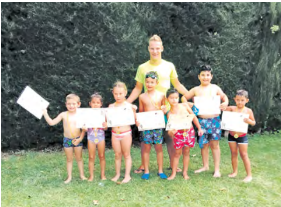
Curso de natación en Jarque.