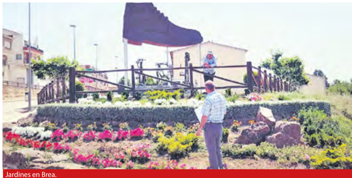
Jardines en Brea.

Patrimonio vegetal y paisajístico, medio ambiente y sostenibilidad, y actividades sociales, explotación del turismo y comunicación. ◀