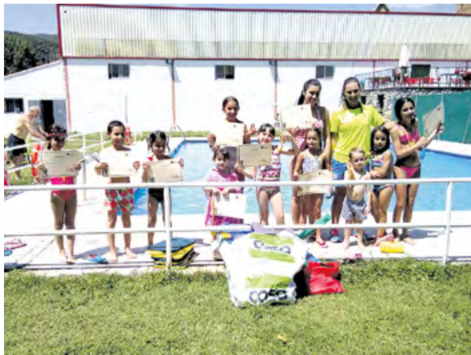
Curso de natación en Trasobares.