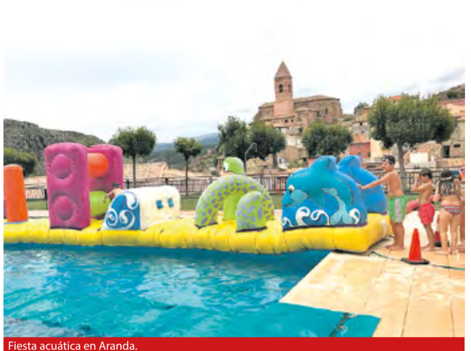
Fiesta acuática en Aranda.