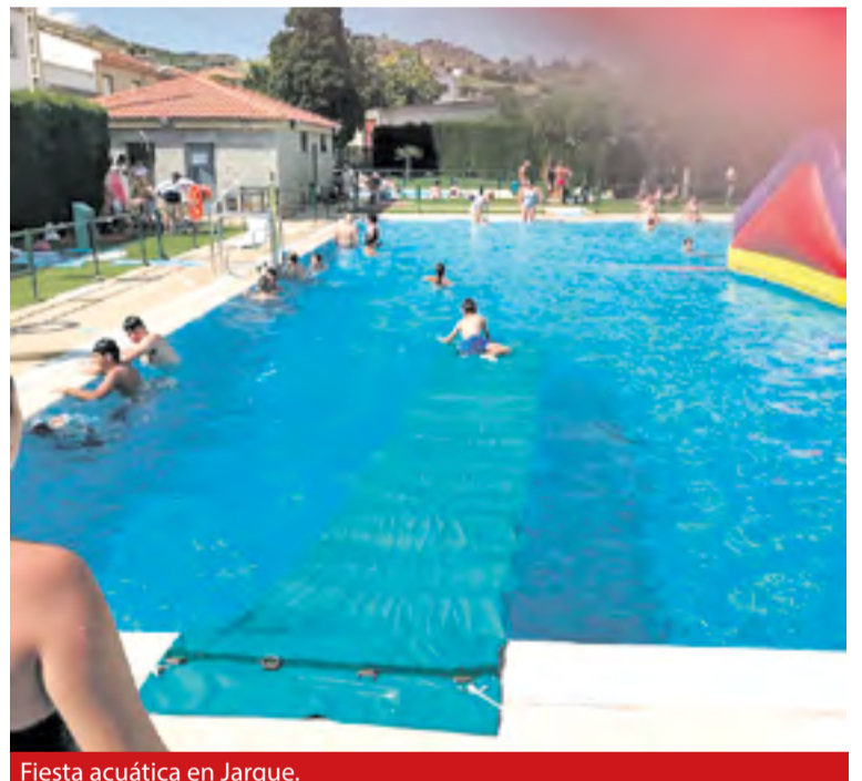
Fiesta acuática en Jarque.