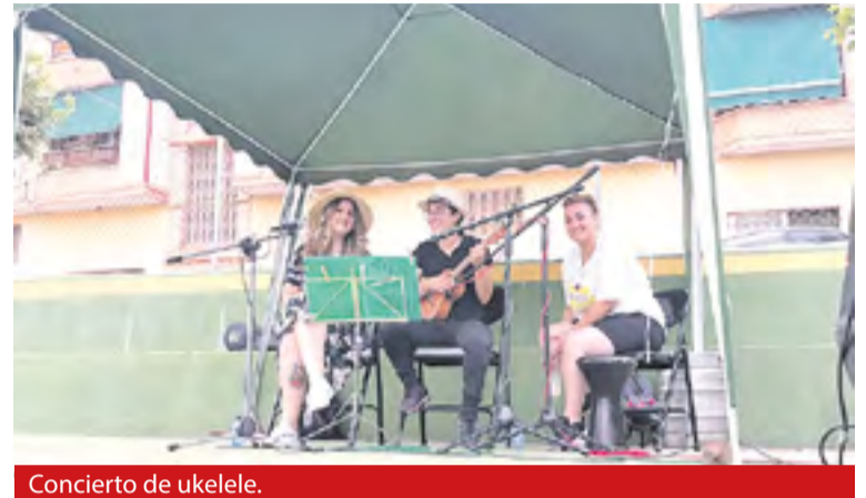
Concierto de ukelele.