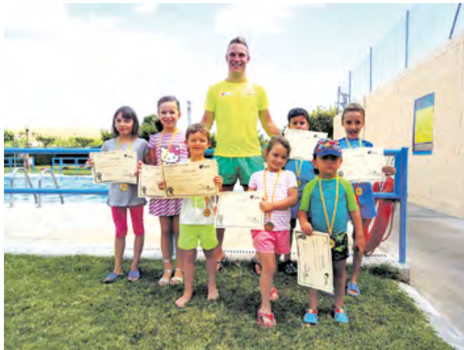
Curso de natación en Gotor.