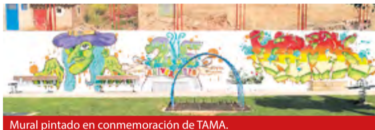
Mural pintado en conmemoración de TAMA.