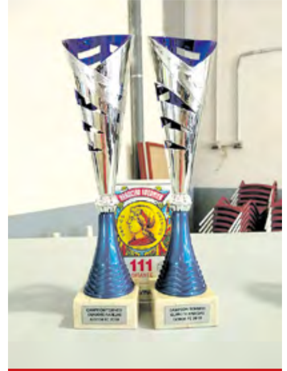
Trofeos del torneo de guiñote.