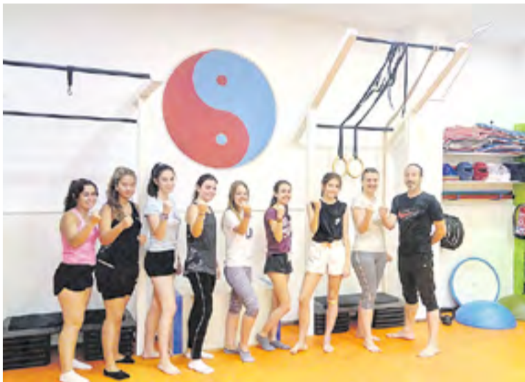
Participantes en el curso de defensa personal.