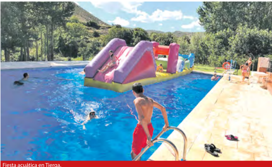
Fiesta acuática en Tierga.