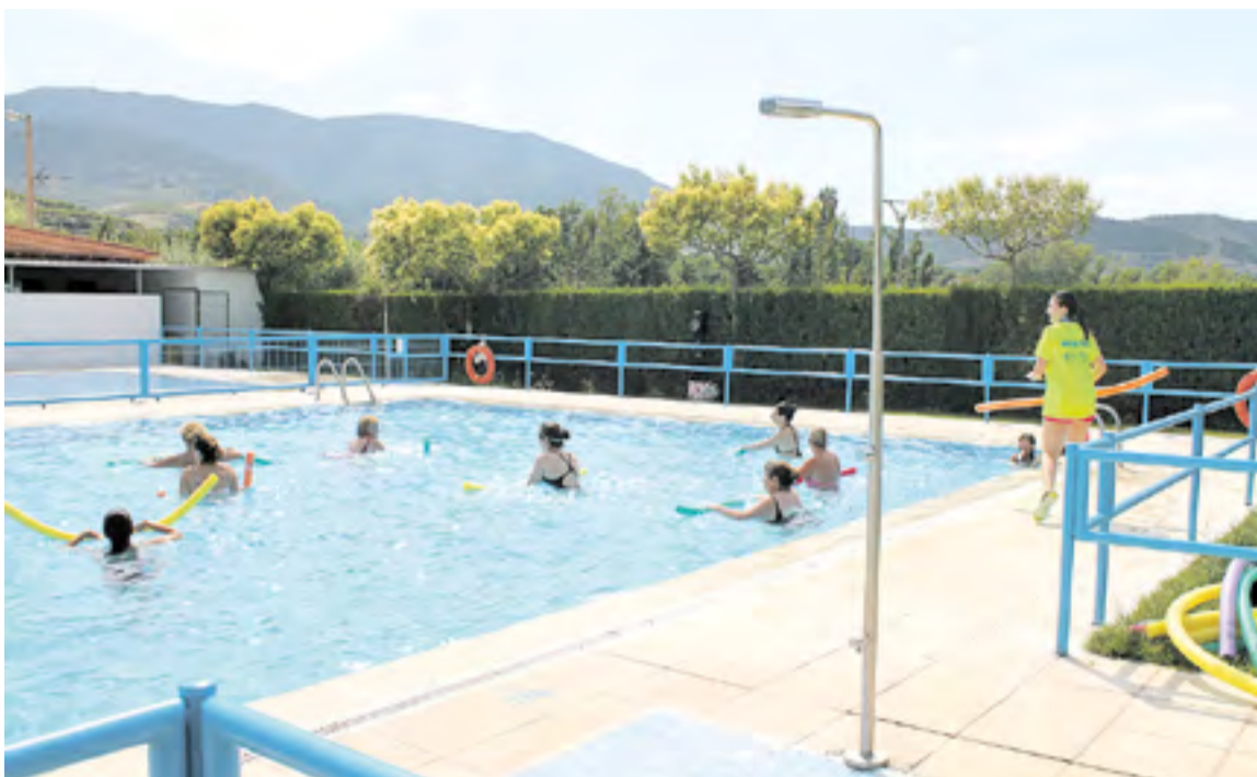
Aquagym en Gotor.