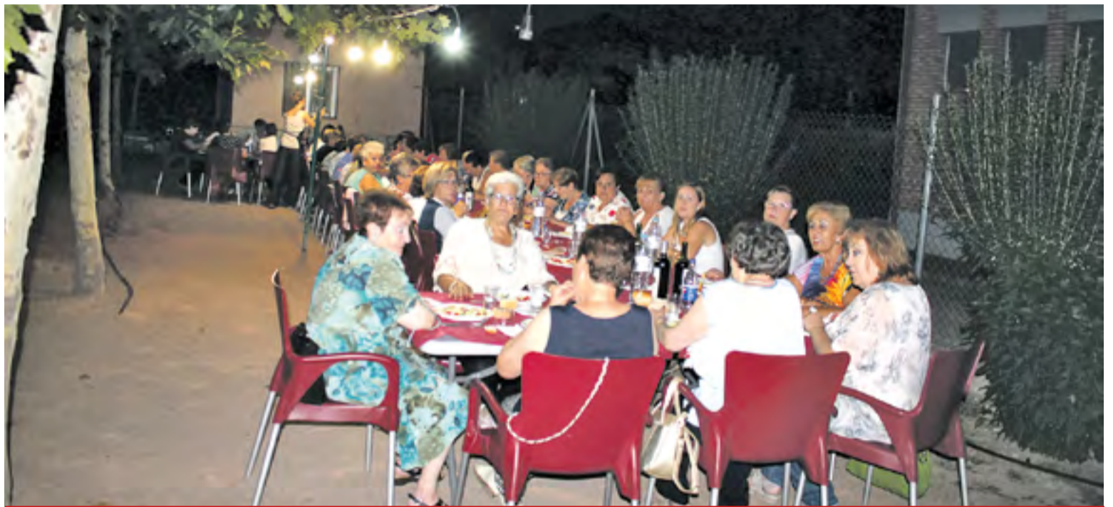
Cena de la asociación en las fiestas de Santiago y Santa Ana.

La verdad es que sí. Muchas de nosotras pertenecemos a la asociación, además de otros factores, porque nuestras madres o nuestras familiares pertenecían a ella.