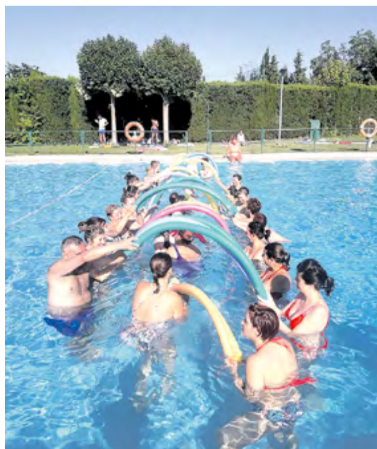
Aquagym en Jarque.