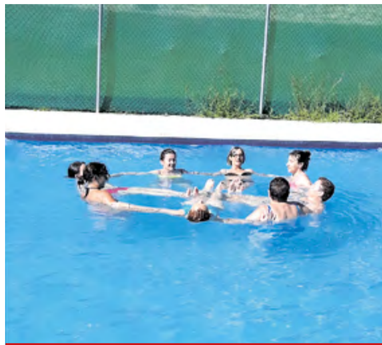
Aquagym en Trasobares.