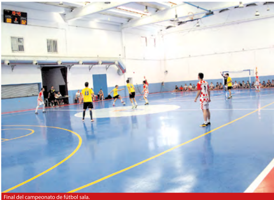
Final del campeonato de fútbol sala.