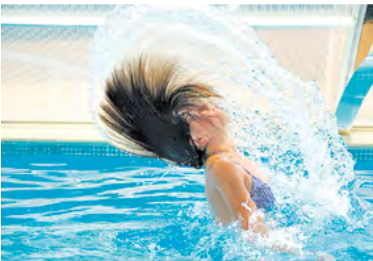
Fotografía de stock. Fuente Pixabay.

Es importante el cumplimiento de las normas tanto por parte del usuario como de la gestora de la piscina pública para evitar los indeseados accidentes que ocurren en estos lugares durante el verano; y así, de esta manera, disfrutar al máximo de unos días de descanso y ocio. ☑