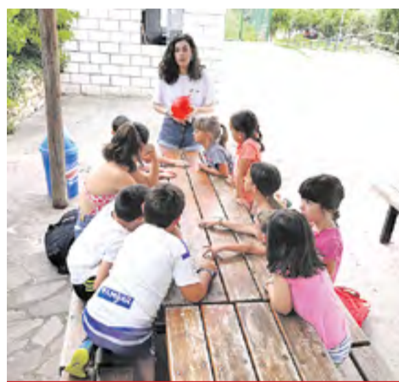
Ludoteca en Trasobares.