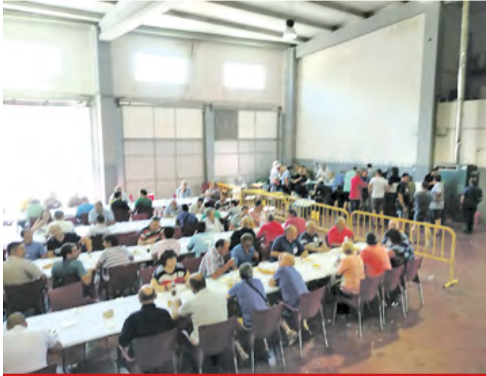
Integrantes del concurso.

Además, con la inscripción, todos los participantes tenían incluido el almuerzo y la comida. El acto fue organizado por el Gotor FC, con la colaboración del Ayuntamiento de Gotor y de la Comarca del Aranda. 🍴