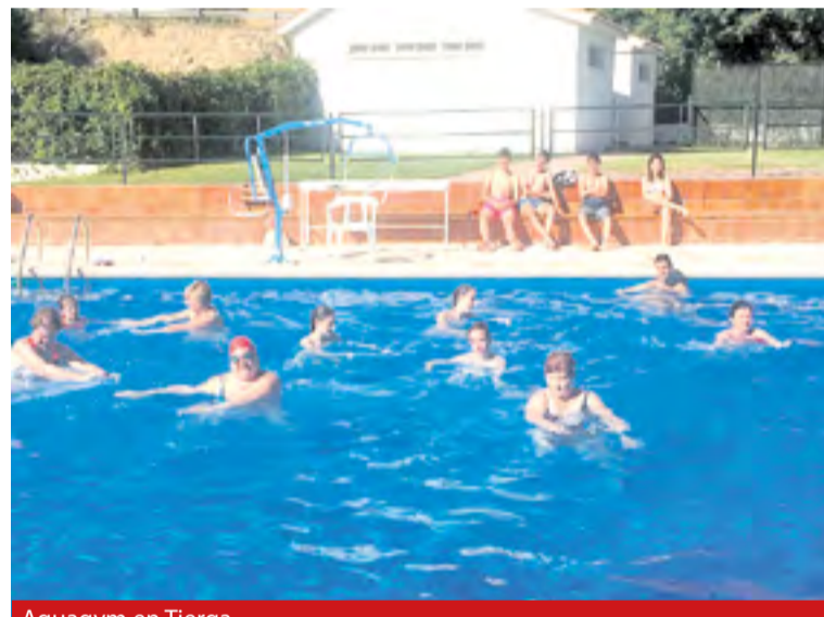
Aquagym en Tierga.