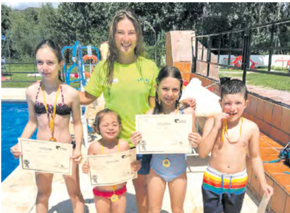
Curso de natación en Tierga.