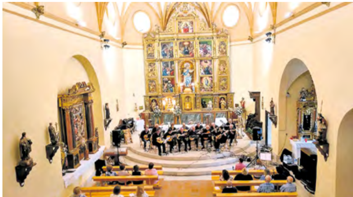
Concierto en la Iglesia de la Asunción.