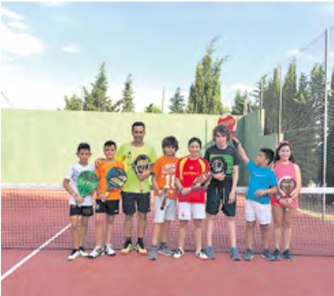
Participantes en el Campus de pádel en Mesones.