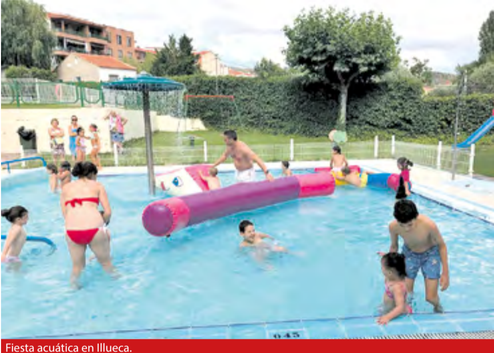
Fiesta acuática en Illueca.