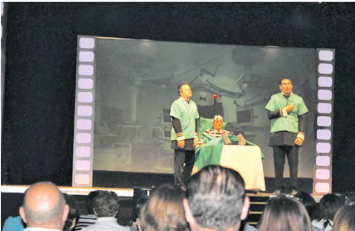
Actuación del grupo Clownic.

Los participantes que quieran tener derecho a la comida gratuita organizada por el Ayuntamiento de Calcena, deberán inscribirse antes del 24 de agosto. Para el resto, hay plazo hasta el mismo día del concurso (1 septiembre). ◀