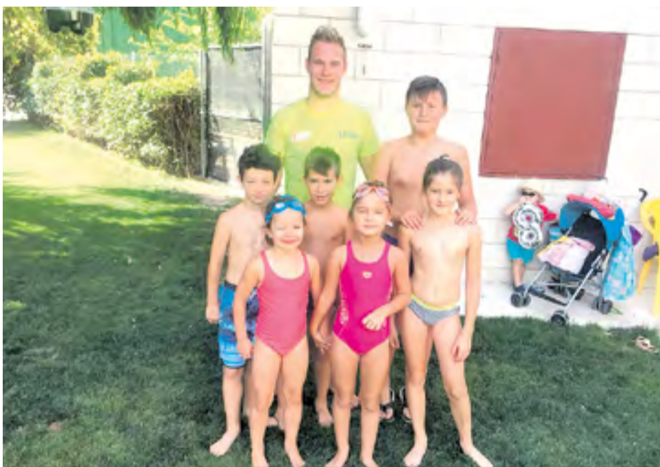
Curso de natación en Sestrica.