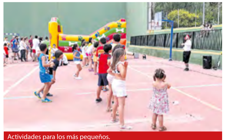
Actividades para los más pequeños.