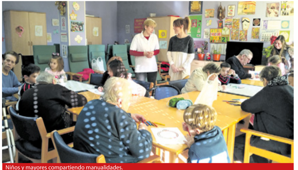
Niños y mayores compartiendo manualidades.

Para finalizar, los usuarios regalaron a los niños un detalle hecho por ellos y compartieron un aperitivo.