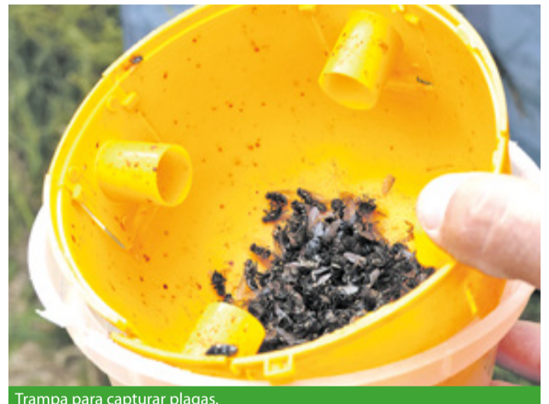
Trampa para capturar plagas.