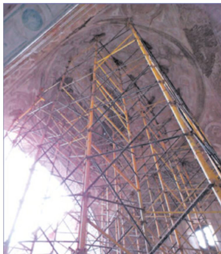
Estado actual de la cúpula policromada del presbiterio.

la parroquia. Fue declarado Monumento Histórico-Artístico en 1984, así como Bien de Interés Cultural en 2001. ◀