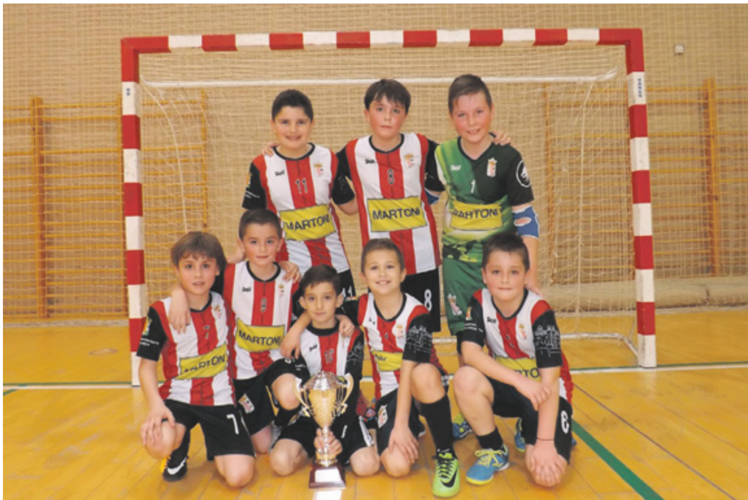
El equipo benjamín del C.F. Illueca con la copa de campeones.