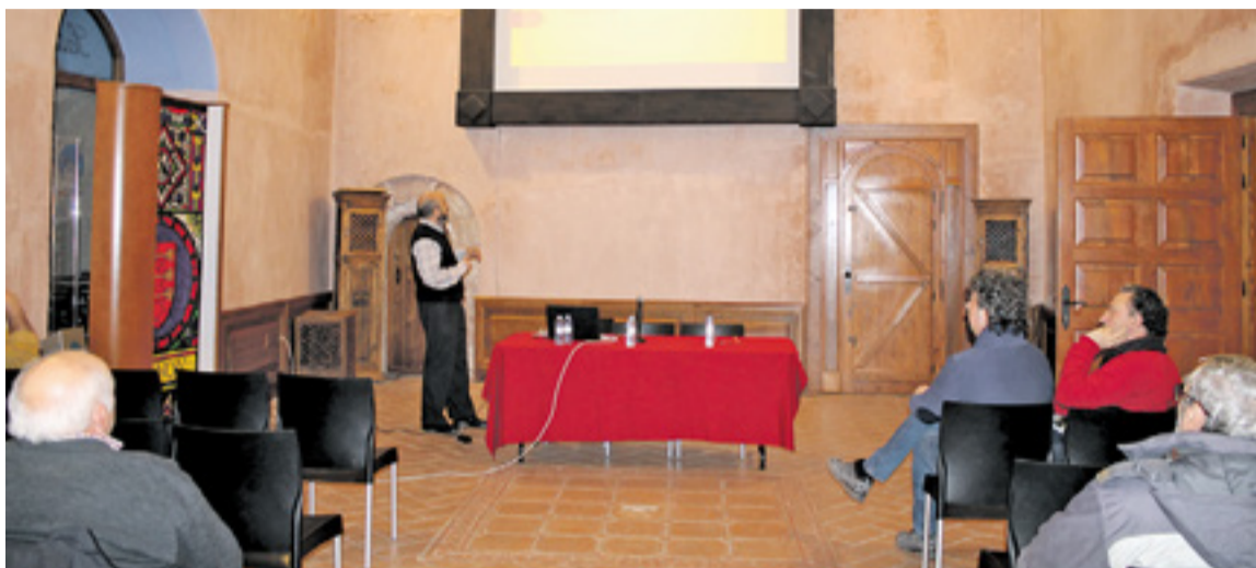
Reunión informativa en la Sala Dorada.

Esta iniciativa se pretende extender a otras producciones como el aceite, tomando el mismo modelo de calidad de producto y de servicio. ◀