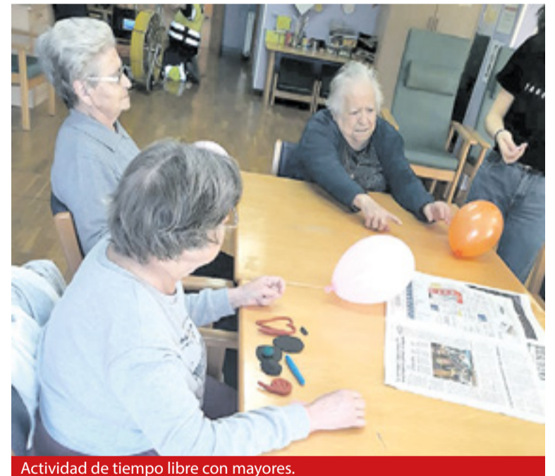
Actividad de tiempo libre con mayores.