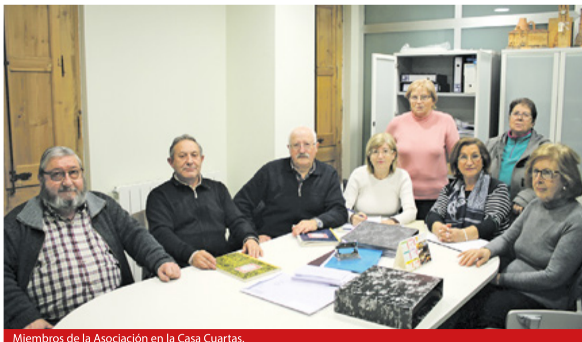
Miembros de la Asociación en la Casa Cuartas.

La Asociación de la Tercera Edad de Brea de Aragón lleva casi treinta años en funcionamiento. Actualmente se encuentra ubicada en la Casa Cuartas pero anteriormente se situaba en la Sociedad de Artesanos, donde perduraron más de veinte años.