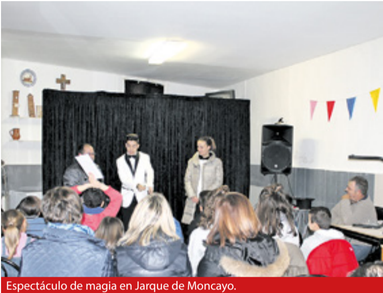
Espectáculo de magia en Jarque de Moncayo.

a más de uno. Desde la Comarca y en colaboración con los Ayuntamientos de estas localidades se pretende por segundo año consecutivo fomentar y dar a conocer este programa. ◀