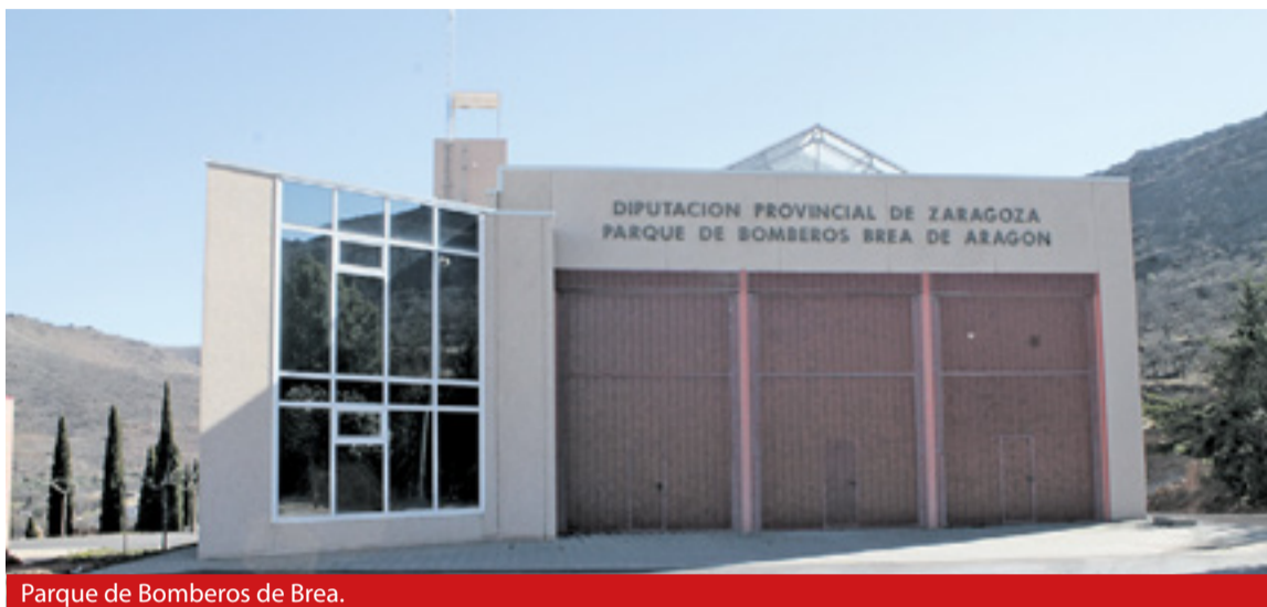
Parque de Bomberos de Brea.