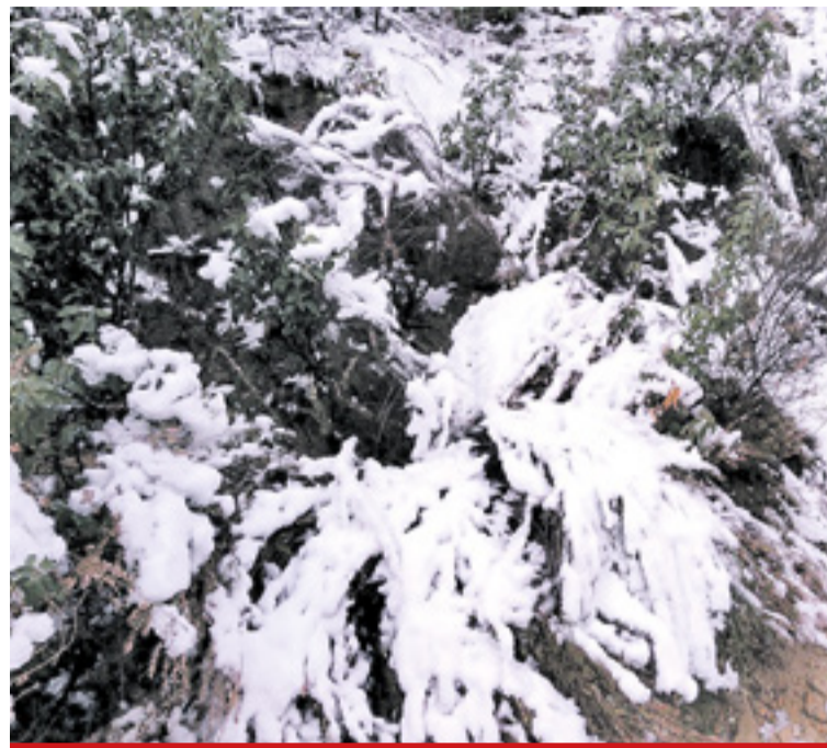
Sierra de Illueca.