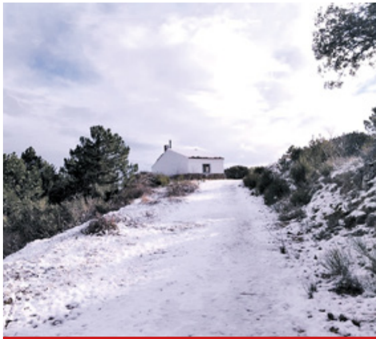
El Refugio de Illueca.

Otro de los lugares en los que se apreciaba esta imagen invernal ha sido en varios tramos de la Sierra de la Virgen. ◀