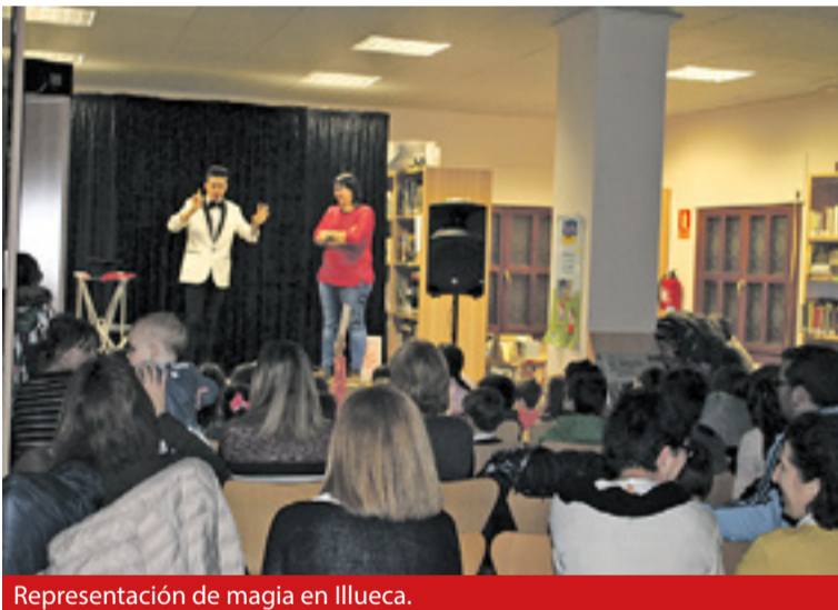
Representación de magia en Illueca.