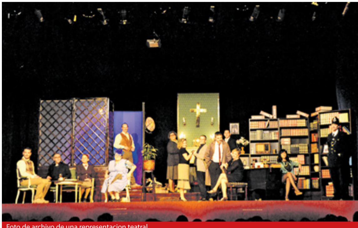
Foto de archivo de una representación teatral.

En paralelo, el Gobierno de Aragón y las diputaciones provinciales firman un convenio de colaboración por el que se comprometen a financiar, respectivamente, la mitad de las actuaciones pro-