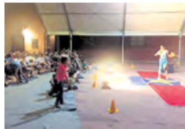
Actuación de 2017.