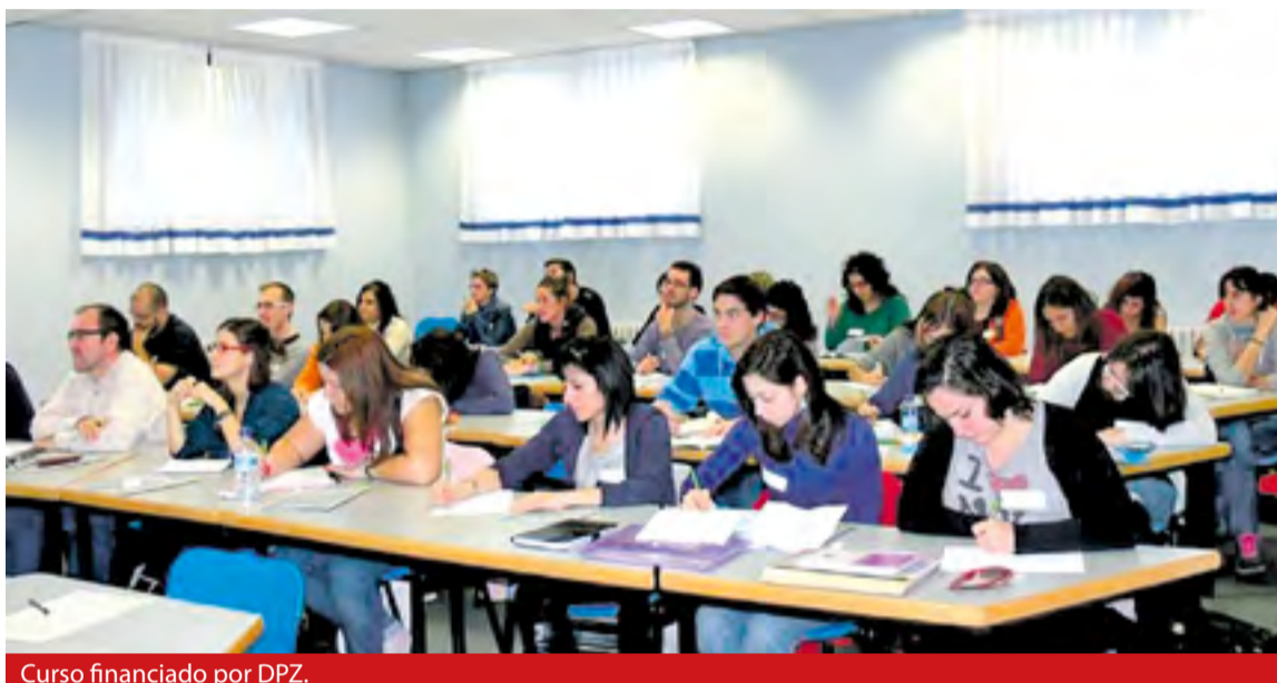
Curso financiado por DPZ.

A esta convocatoria pueden acogerse todos los ayuntamientos de la provincia de Zaragoza, excepto la capital, y también las