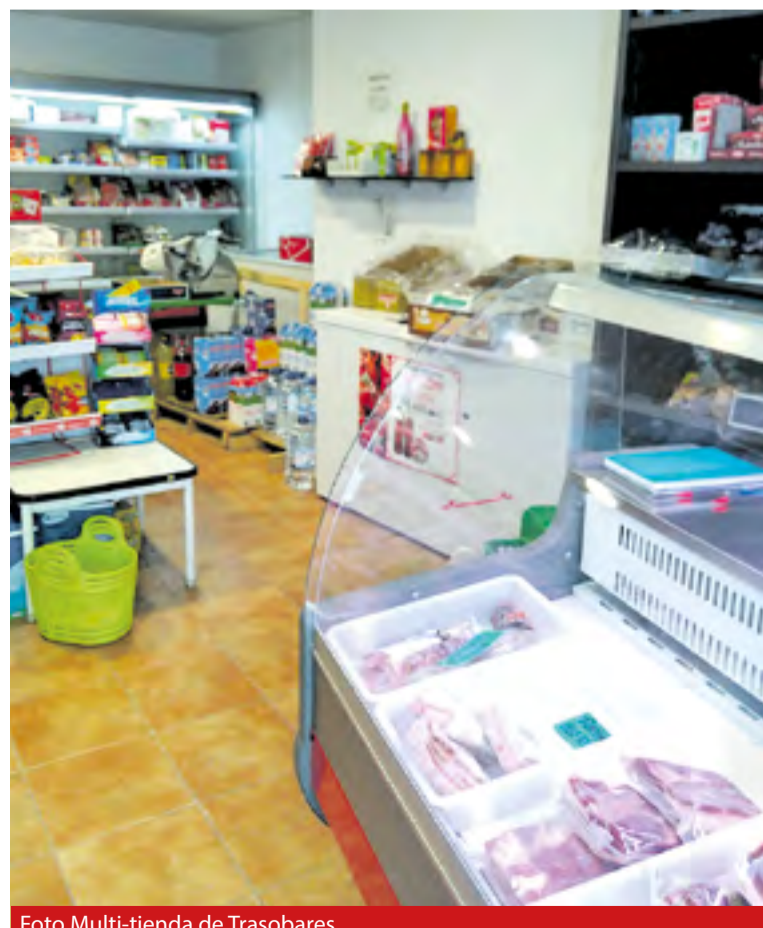
Foto Multi-tienda de Trasobares.