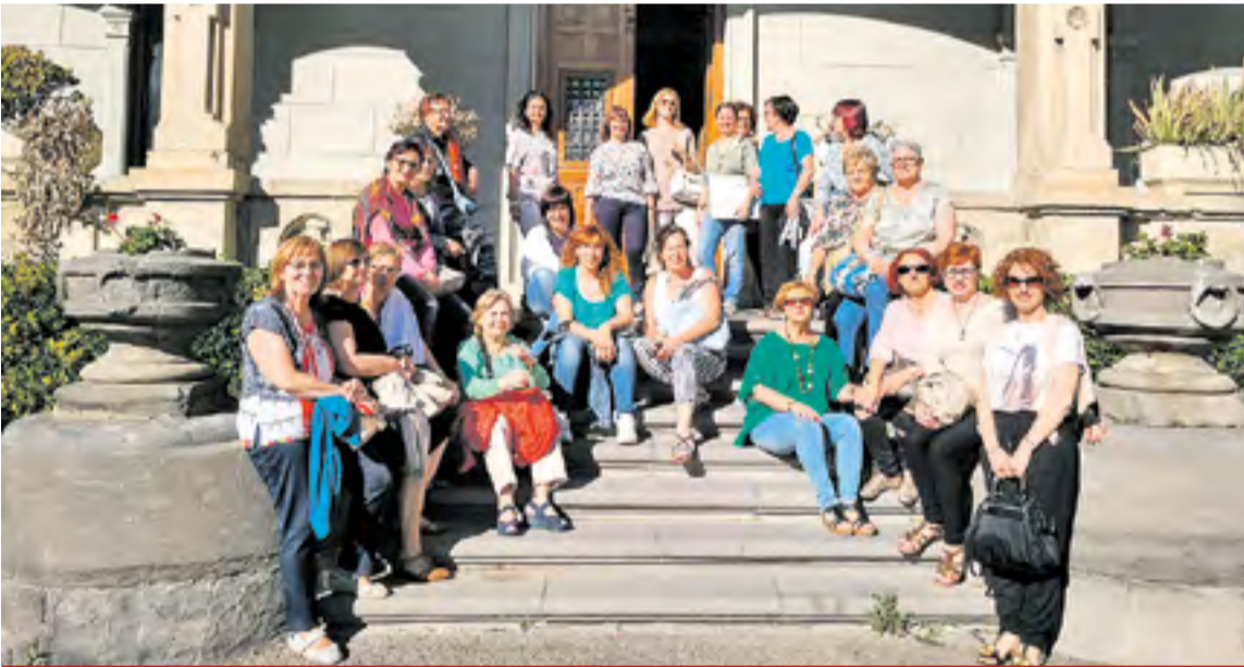
Entrada del Palacio de Larrinaga.