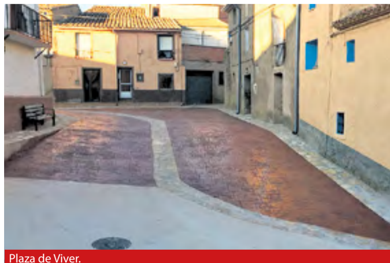
Plaza de Viver.

realizada por el Ayuntamiento de Sestrica. ◀