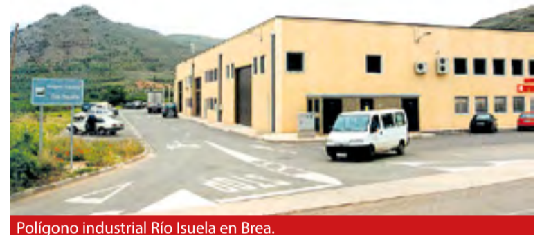
Polígono industrial Río Isuela en Brea.

El programa Desafío es una de las líneas de trabajo que se están desarrollando para luchar contra la despoblación y va dirigido a es-