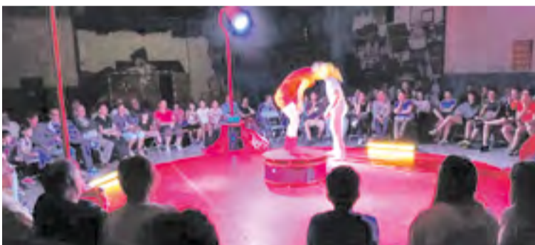
Actuación de 2017.