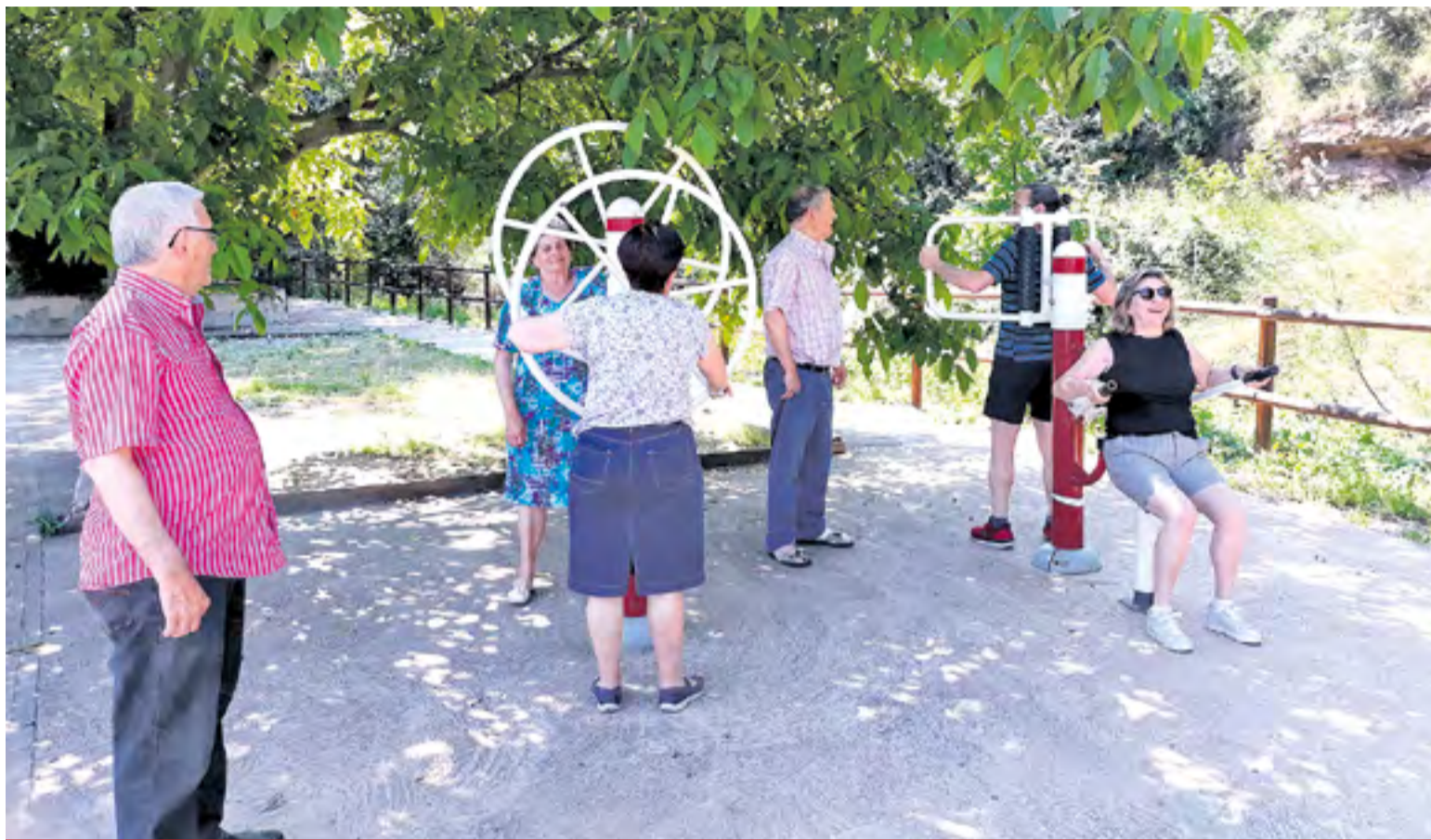
Actividades del programa Aprovecha tu tiempo libre.