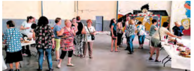
Concurso de Tapas y Postres en el pabellón.