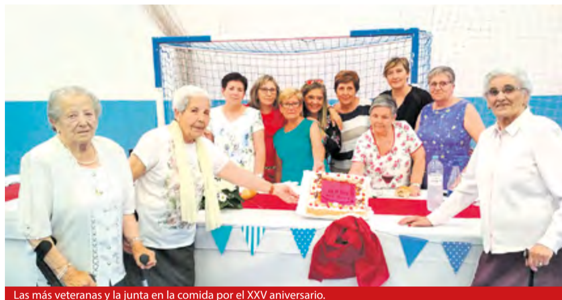
Las más veteranas y la junta en la comida por el XXV aniversario.

Por otro lado, en octubre recogemos dinero para realizar los corazones del cáncer. Parte de ellos