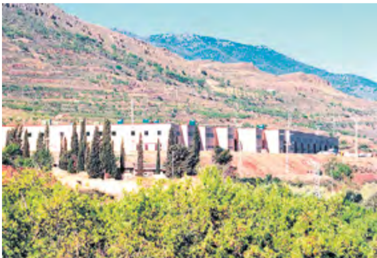
Polígono industrial Río Aranda en Brea.