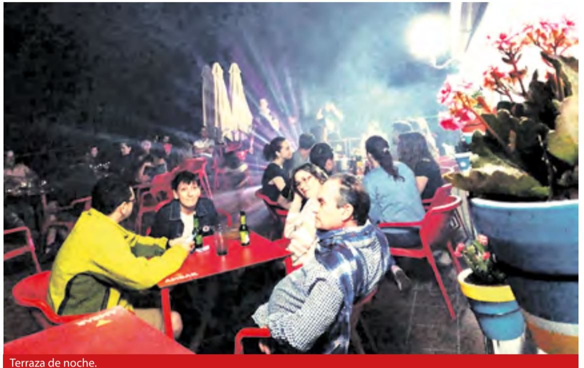
Terraza de noche.

Durante el Invierno el Ayuntamiento de Trasobares ha mejorado la instalación creando una amplia terraza en el Camping que invita a la tranquilidad, a los encuentros, a los buenos ratos, y al