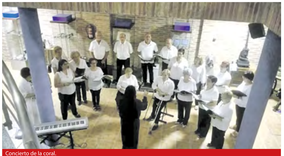
Concierto de la coral.

El plazo para nuevas inscripciones está abierto y se debe solicitar información en el ayuntamiento de la localidad. “No hace falta tener un oído privilegiado para pertenecer al coro. Animo a inscribirse a cual-