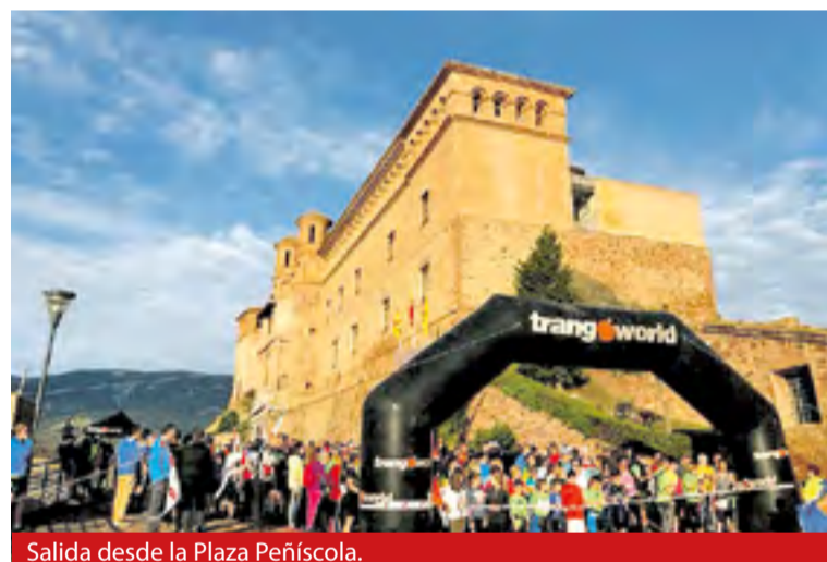
Salida desde la Plaza Peñíscola.

Por su parte, el recorrido medio consistía en realizar 20 kilómetros con una duración de cinco horas,