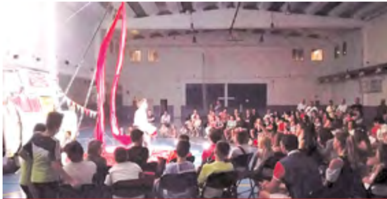
Actuación de 2017.

El Departamento de Cultura de la Comarca del Aranda ha programado nuevas actuaciones que pretenden entretener y divertir a todos los públicos. Desde circo y clown hasta teatro y monólogos, los espectáculos tienen en común el humor y la sorpresa. ◀