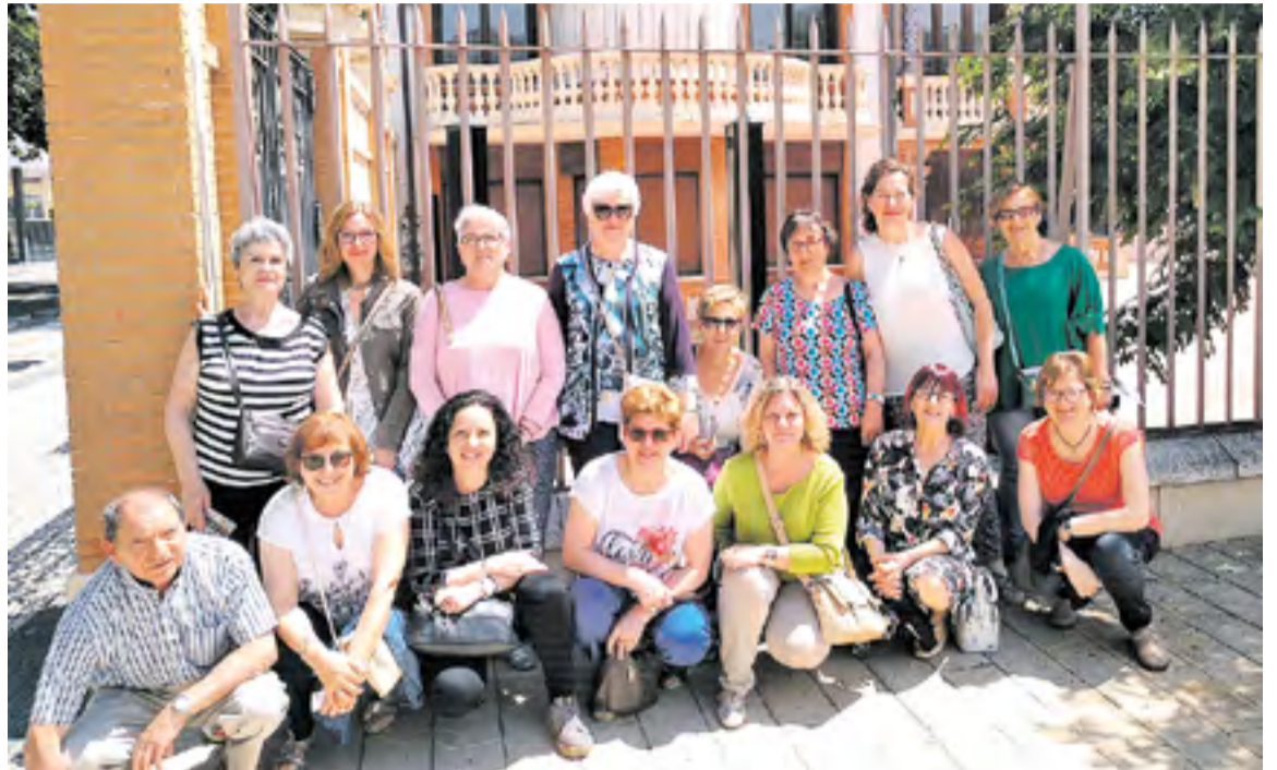
Exterior de la Casa Solans.

A pesar de tan interesantes actividades, no todo han sido buenos momentos: Desde la Asociación de Mujeres Virgen del Capítulo de Trasobares muestran su pesar y ofrecen todo su apoyo a una de sus socias por la pérdida inesperada de su hija. ☹