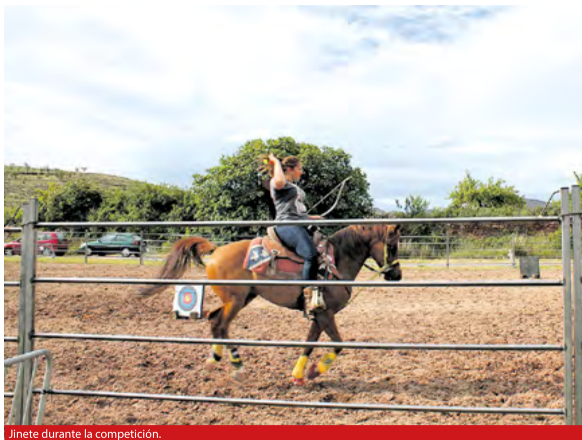
Jinete durante la competición.