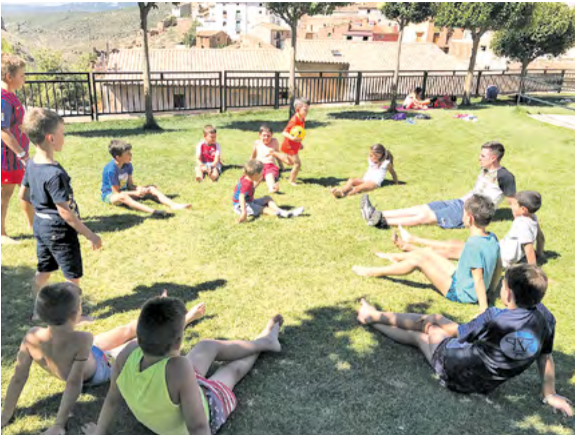
Ludoteca en Aranda 2017.