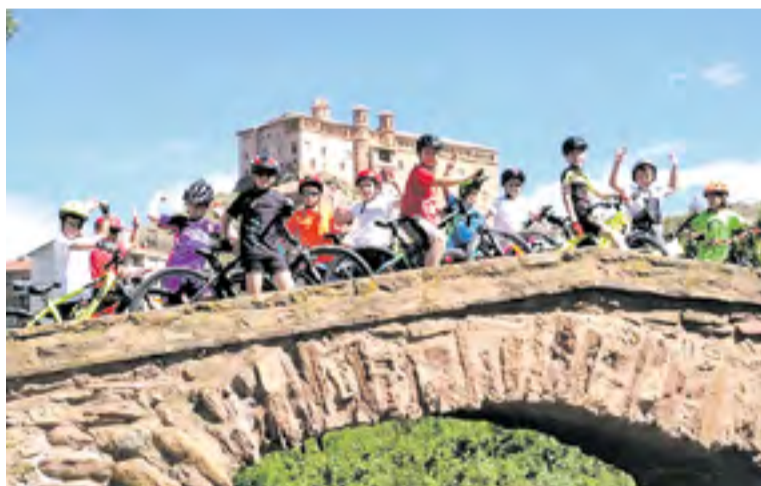
Participantes en el encuentro de la bici.

participantes quedaron en la Plaza Peñíscola para llegar juntos al polideportivo. Posteriormente se desarrollaron las actividades de habilidad y se realizó una gymkhana. Al terminar se ofreció un almuerzo y un obsequio para los jóvenes ciclistas. ◀