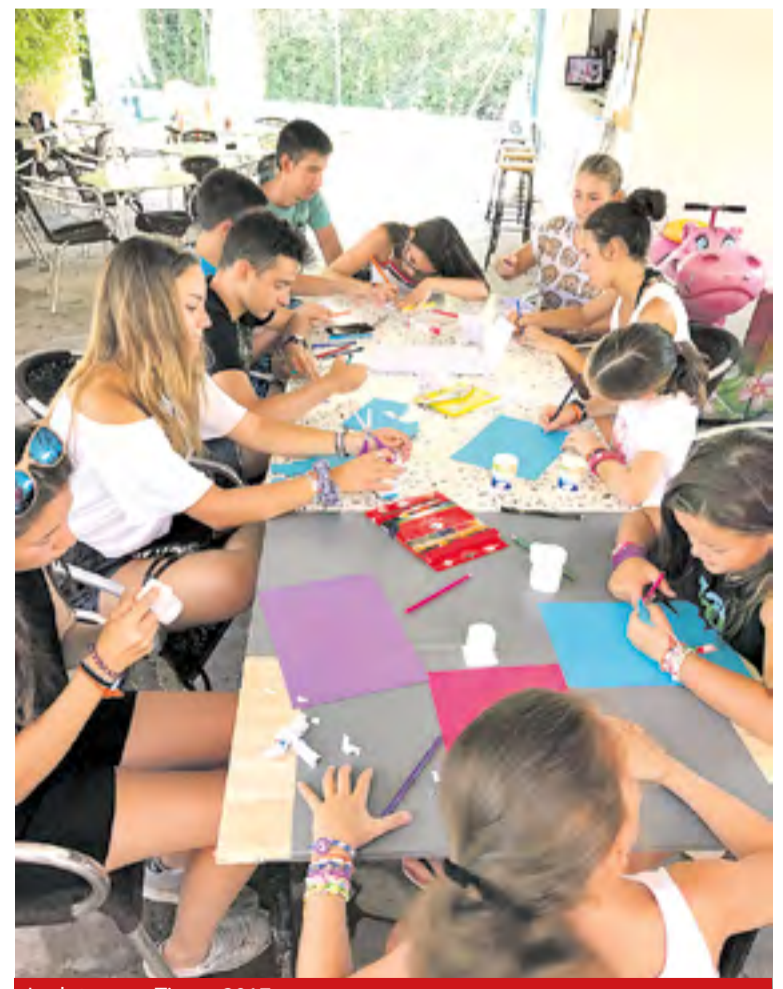
Ludoteca en Tierga 2017.