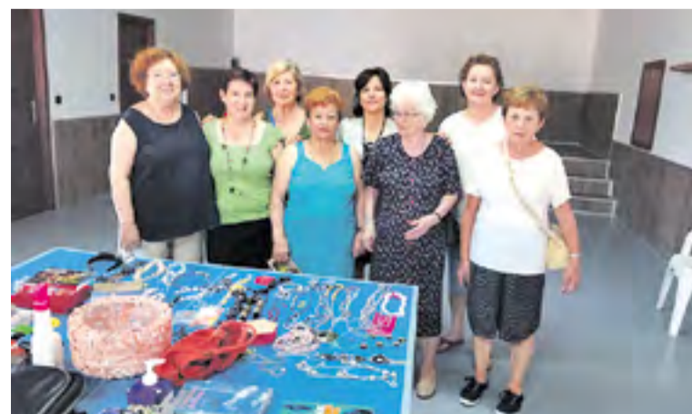
Mercado del trueque en Oseja (edición anterior).

¡Anímate a participar y no olvides traer objetos que no vayas a utilizar! ☺