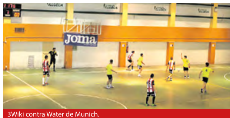
3Wiki contra Water de Munich.

La gran final tuvo lugar el domingo día 10 a las 18:00. El Pozo de Mourcia, procedente de Madrid, fue el equipo que se alzó con la victoria y obtuvo 1.600 euros de recompensación y un trofeo. Por su parte el Carlosreula.com, procedente de Zaragoza, se quedó en segundo lugar y obtuvo 700 euros y un trofeo. Además, se