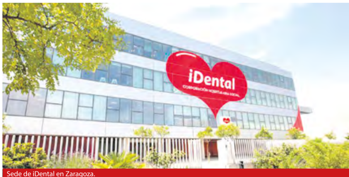
Sede de iDental en Zaragoza.

• En caso de tener un crédito vinculado, que es aquel que se entiende que se ha pedido exclusivamente para financiar un contrato de compra de un bien o la prestación de un servicio específico,