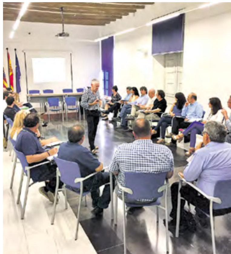
Encuentro sobre la despoblación celebrado en Calatayud.

Las ponencias terminaron con un interesante debate final en el que tomaron la palabra alcaldes y concejales de la Comarca, así como otros técnicos de entre los asistentes. ■