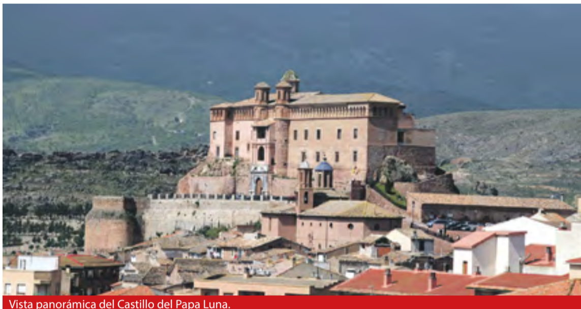
Vista panorámica del Castillo del Papa Luna.

En un segundo intento, en marzo de 2018, el pleno del ayuntamiento de Illueca aprobó la declaración de nulidad del acuerdo de cesión de uso de parte del castillo a la institución comarcal y solicitó de nuevo al Consejo Consultivo de Aragón la revisión del mismo, con diferentes alegaciones e incluso alguna contradicción, tal y como se refleja en el segundo dictamen desfavorable emitido por el organismo jurídico. ◀