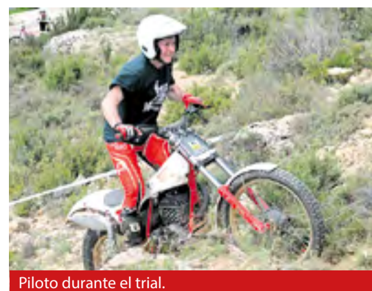
Piloto durante el trial.