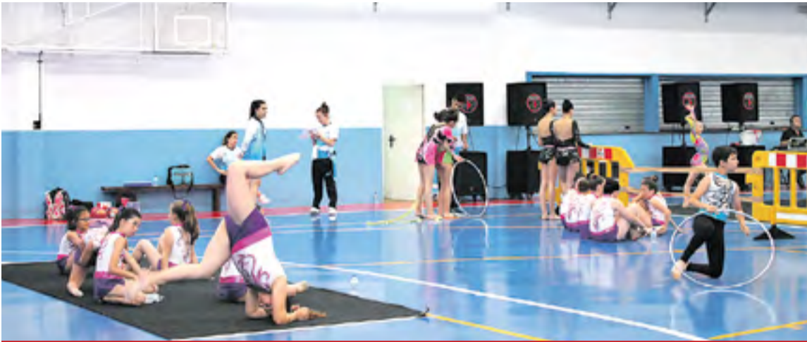
Gimnastas durante la competición.

200 jóvenes de entre cuatro y diecisiete años demostraron sus dotes en la competición