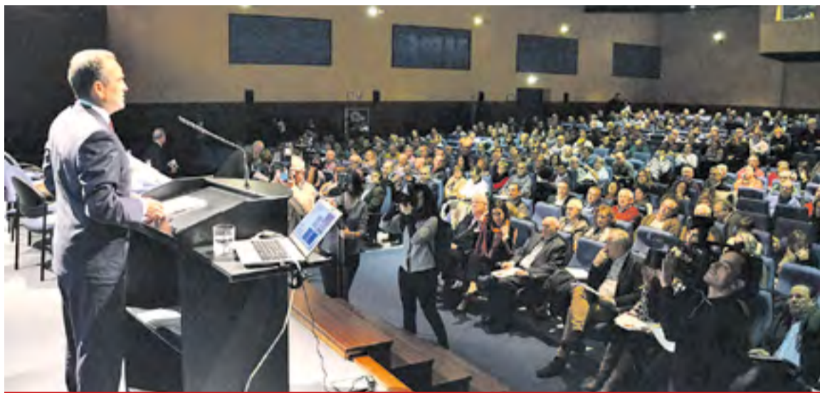
Imagen de archivo de la presentación del Plus a finales de 2016.

“El plan unificado de subvenciones, que fue una iniciativa to-