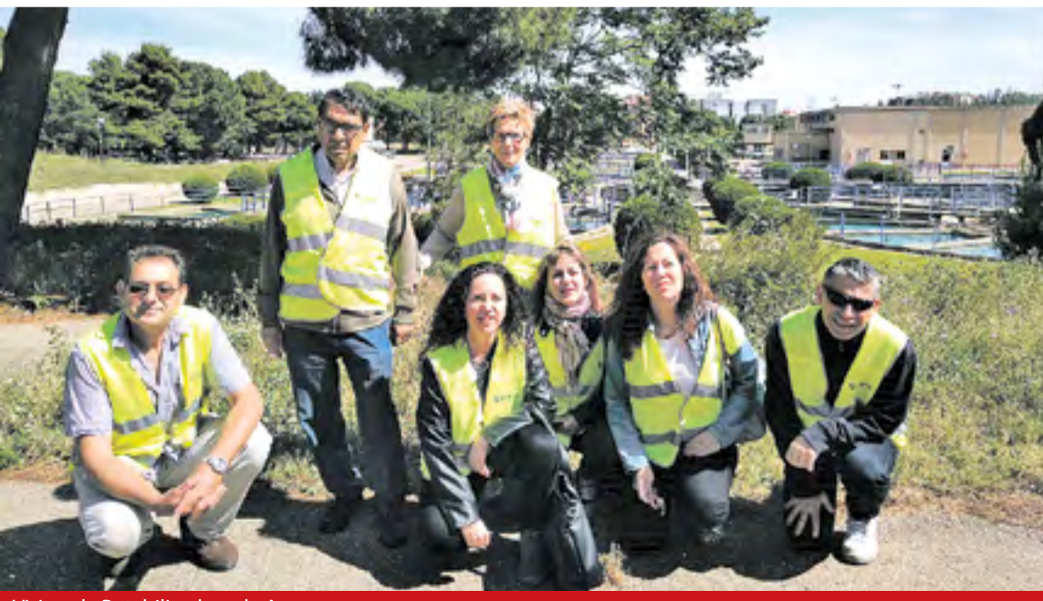
Visita a la Potabilizadora de Aguas.