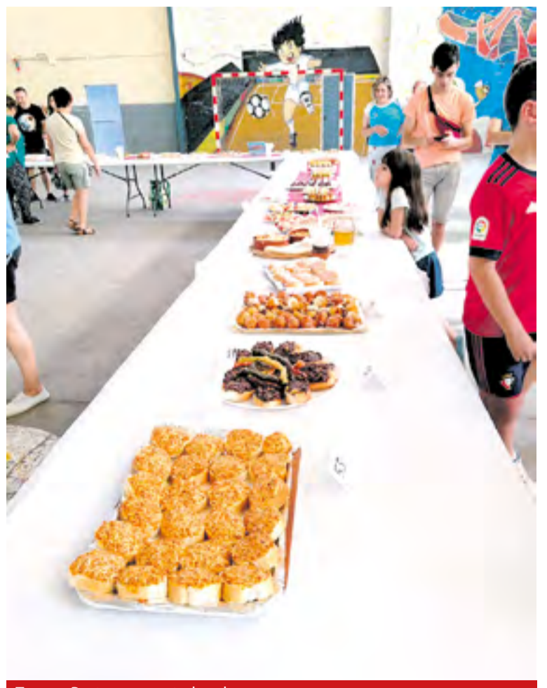
Tapas y Postres presentados al concurso.