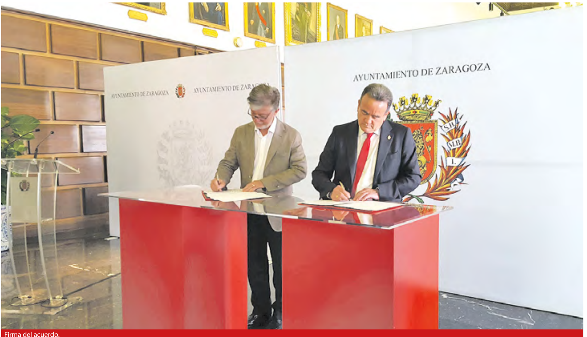
Firma del acuerdo.

La DPZ da así un paso muy importante para la puesta en marcha del proyecto Ecoprovincia, que hará posible que los municipios zaragozanos cumplan la obligación de reciclar al menos el 50% de sus basuras