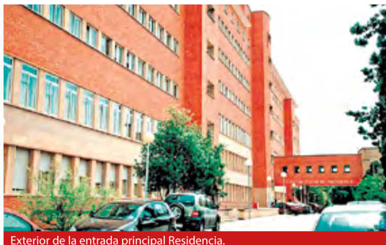
Exterior de la entrada principal Residencia.

Las solicitudes pueden presentarse hasta el 6 de julio y los residentes en los municipios de la provincia tienen una bonificación