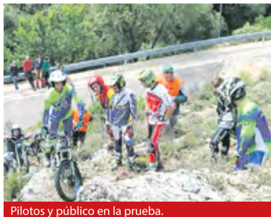
Pilotos y público en la prueba.

En Calcena las pruebas son realmente dificultosas al caracterizarse el terreno por grandes pendientes pronunciadas y estar formado por piedras sueltas. En la actualidad, en Aragón faltan pilotos que se quieran dedicar al deporte del Trial. ◀