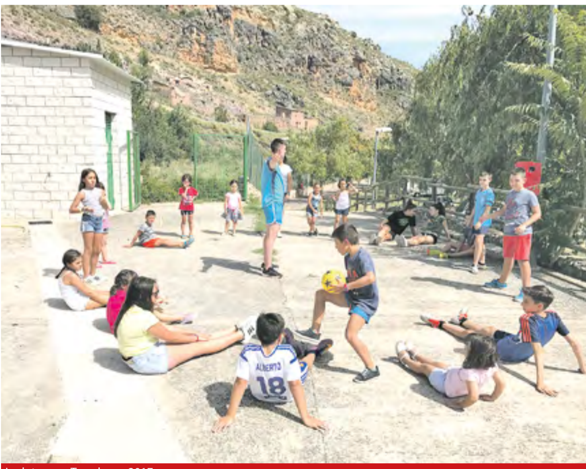
Ludoteca en Trasobares 2017.