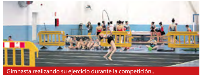
Gimnasta realizando su ejercicio durante la competición..