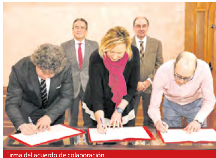
Firma del acuerdo de colaboración.

Dicho convenio también contempla la posibilidad de participación o colaboración de otros actores, como AREX –que ya ha estado colaborando con el sector con acciones de apertura a los mercados internacionales, mediante asesoramiento a través de canales tradicionales como las ferias o misiones comerciales, así como de canales online (e-commerce, etc.)–, o el Instituto Tecnológico de Aragón (ITA), centro tecnológico de referencia para la transformación digital y la implantación de las tecnologías 4.0 en la empresa.