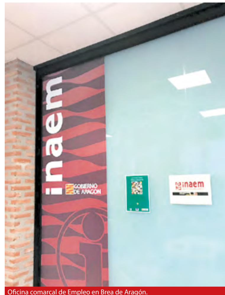
Oficina comarcal de Empleo en Brea de Aragón.

Los Centros Especiales de Empleo pueden solicitar ayudas destinadas a fomentar la integración laboral de las personas con discapacidad en estos centros, promoviendo el mantenimiento de sus puestos de trabajo, y para el funcionamiento de sus Unidades de Apoyo a la Actividad Profesional. A la primera de estas dos líneas de subvenciones se destina una partida de 4.500.000 euros y a la segunda, 775.000