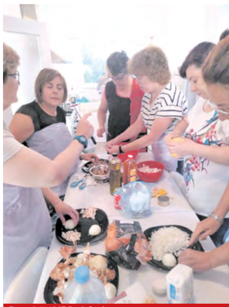
Clase práctica del Taller de Empleo.