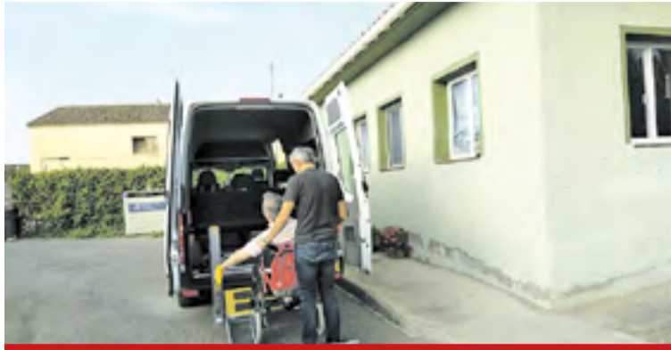
Imagen de un vehículo adaptado para el servicio.

• Traslado y acompañamiento de personas con discapacidad o en situación de dependencia a Cen-