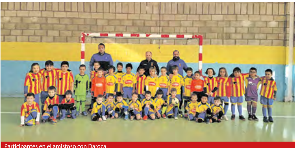
Participantes en el amistoso con Daroca.

de Daroca obsequiaron a todos con un succulento picoteo.