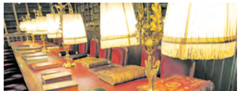
Biblioteca del Palacio de Sástago.