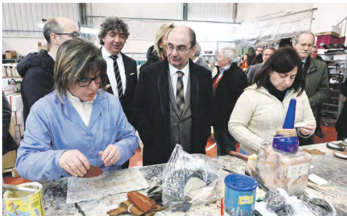
Javier Lambán visita una fábrica de calzado en Illueca.

La mayor parte de las empresas se agrupan en la denominada Asociación de Fabricantes de Calzado y Afines de Zaragoza y Provincia (AFCYA). La gran mayoría son empresas dedicadas a la fabricación de calzado de piel de diferentes estilos. También la componen empresas auxiliares dedicadas a la comercialización de pieles, suelas, etc. Son, esencialmente, pequeñas o, a lo sumo, medianas empresas. ◀