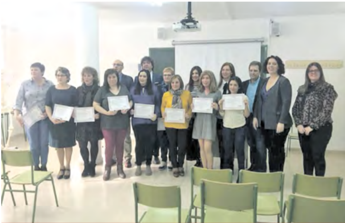
Entrega de diplomas del Taller de Empleo 2018.

Ha sido un año muy intenso, las alumnas decían en la clausura que ha sido una montaña rusa que concluye con 10 mujeres preparadas y que al mismo tiempo abre las puertas a un nuevo Taller de Empleo que dará comienzo el día 1 de febrero. ☑