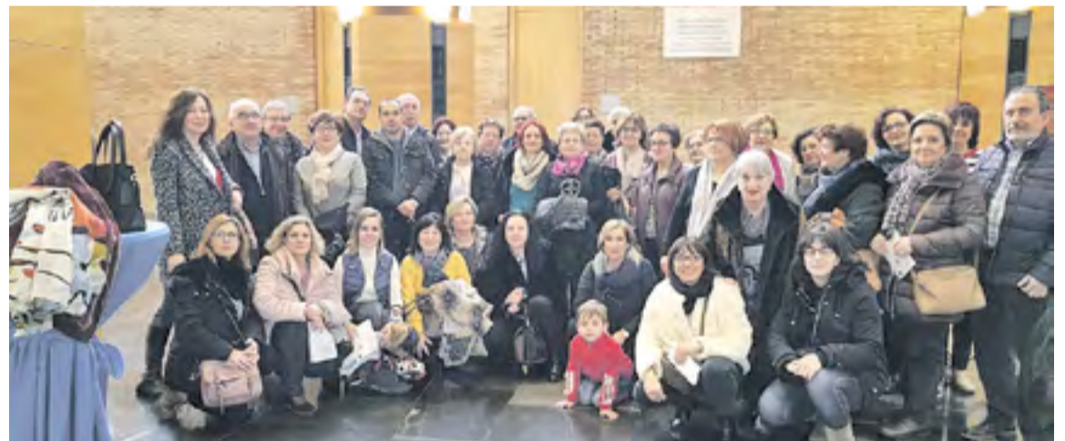
Visita al Auditorio de Zaragoza.