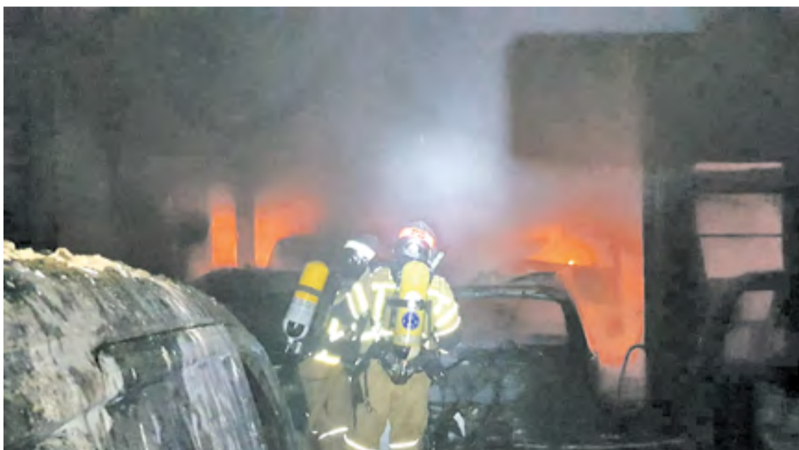
Bomberos de Diputación de Zaragoza apagando un fuego.

A estos proyectos se suman otras innovaciones puestas en marcha en los últimos años para mejorar la respuesta del SPEI a los distintos tipos de emergencias, como el grupo de guías caninos –que en 2018 participó en 12 búsquedas de personas desaparecidas–; el grupo de rescate acuático en superficie –que tuvo un especial protagonismo durante la crecida extraordinaria del Ebro–; el grupo de rescate vertical o los vehículos de intervención rápida (VIR). Además, el año pasado el SPEI incorporó otros tres nuevos camiones a su flota de vehículos, más ligeros y versátiles que los anteriores, capaces de transportar hasta 2.000 litros de agua y con todo el material necesario para intervenir tanto en incendios como en accidentes. 🐾