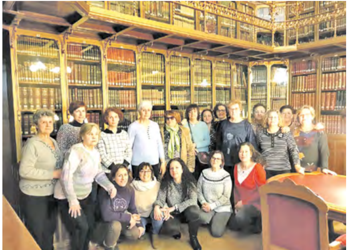
Grupo en la Biblioteca del Palacio de Sástago.

El domingo 20 de enero, las trasobarinas tuvieron la oportunidad de conocer el interior del Auditorio de Zaragoza. Un complejo integrado por el Auditorio - Palacio de Congresos y Sala Multiusos. También disfrutaron de uno de sus conciertos, incluidos en el 39º Ciclo de Introducción a la Música, con la Joven Orquesta de Bandas Sonoras que interpretó el repertorio "La Música clásica y el cine" bajo la dirección de Antonio Lajara. ◀