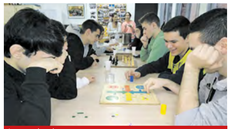
Juegos y chocolate.