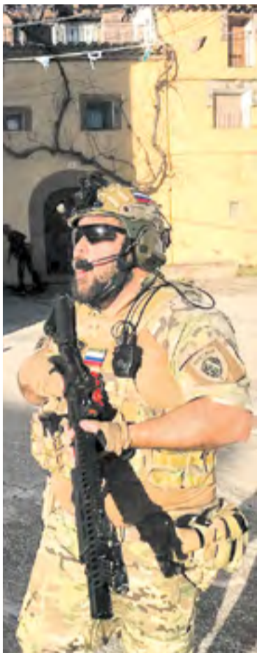
Participantes en el Airsoft de Calcena.