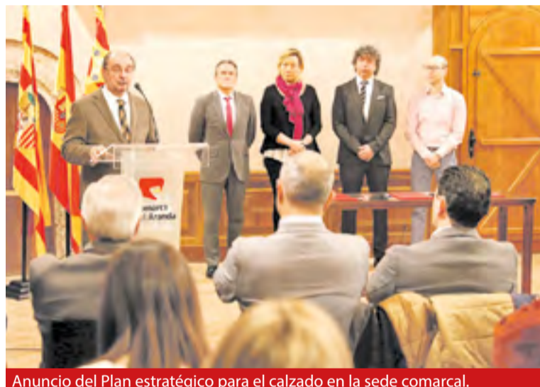
Anuncio del Plan estratégico para el calzado en la sede comarcal.

de asistencia en la definición e implantación de un marco estratégico de actuación en el sector del calzado.