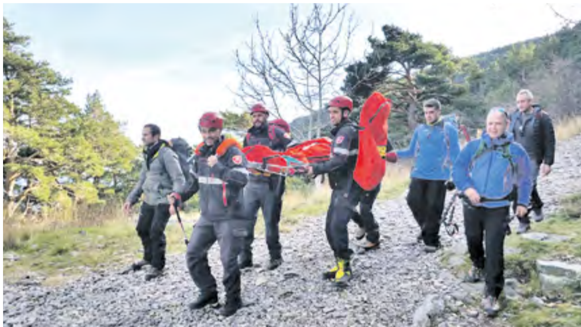
Actuación de los bomberos de Diputación de Zaragoza.

A todas esas actuaciones por emergencias o incidencias se suman los servicios preventivos y de apoyo a los municipios, entre los que el año pasado destacaron 251 retenes de prevención y seguridad para actividades que