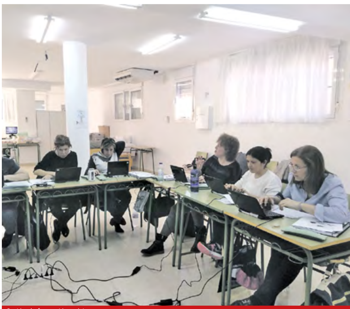
Sesión de formación teórica.