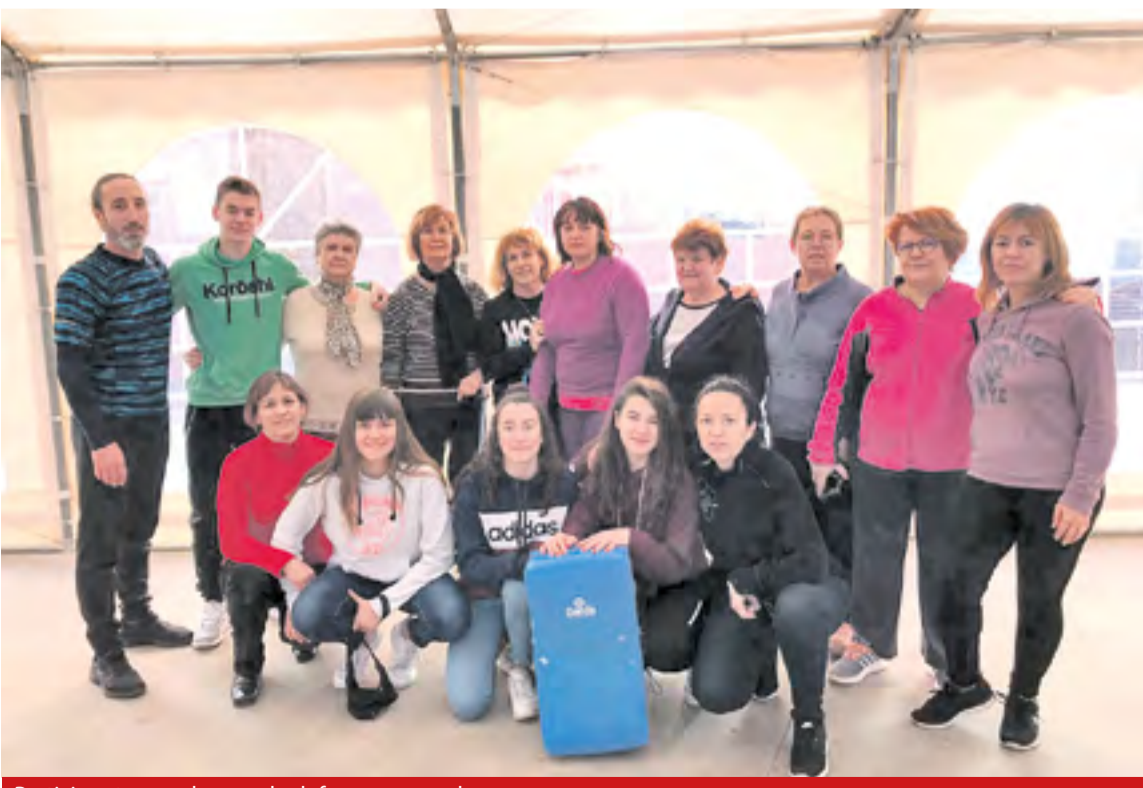
Participantes en el curso de defensa personal.