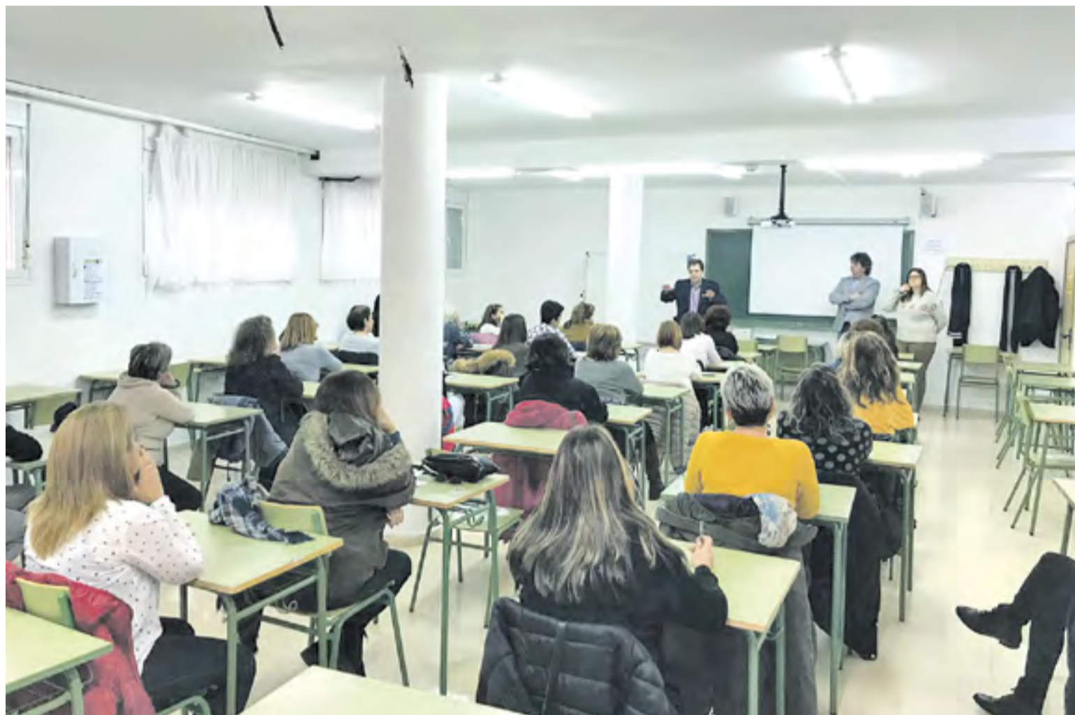
Presentación del nuevo Taller de Empleo comarcal.

Este programa mixto de empleo y formación, está destinado a mujeres desempleadas de 25 años o más que residan en cualquiera de los municipios de la comarca del Aranda.