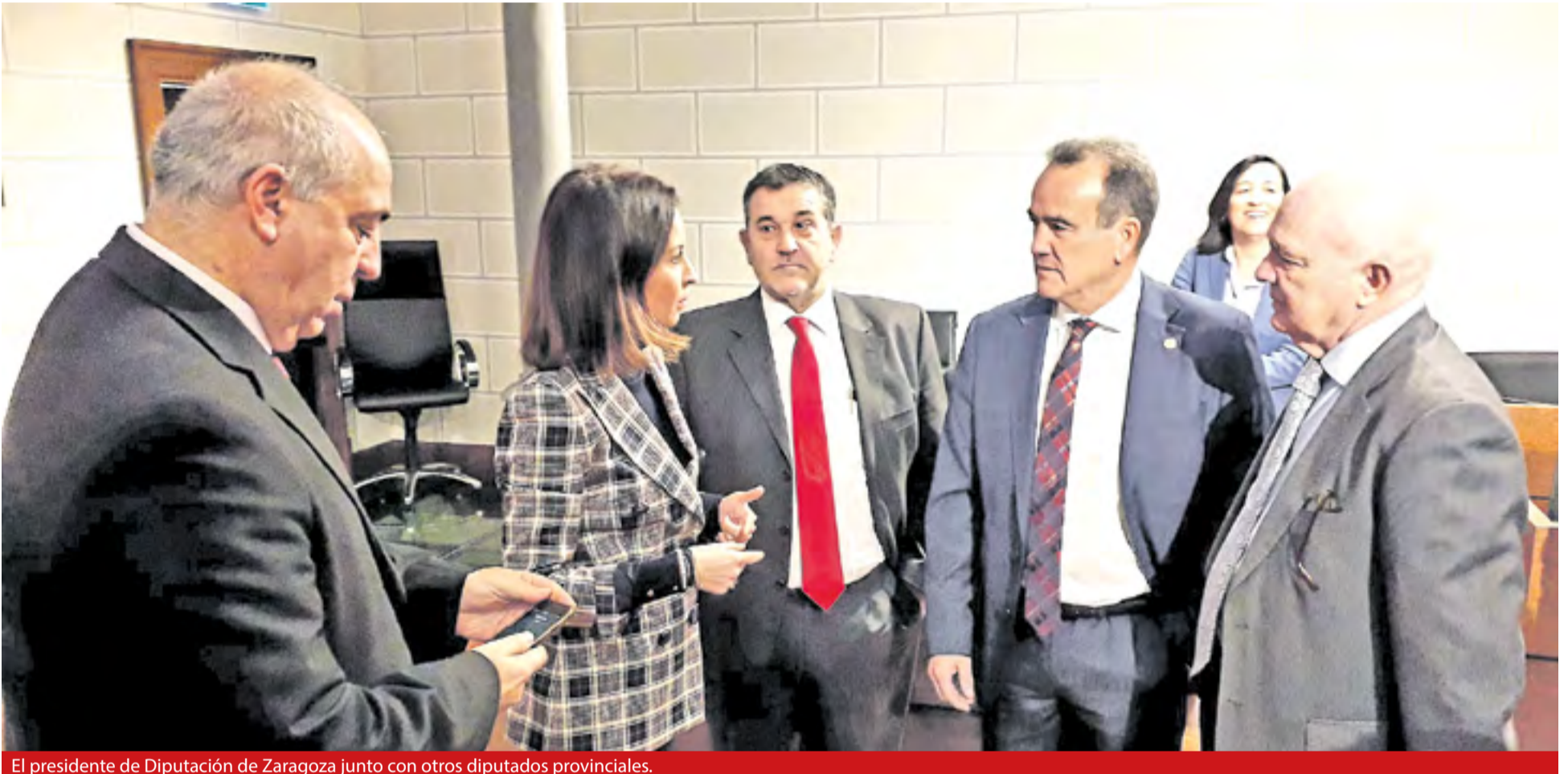
El presidente de Diputación de Zaragoza junto con otros diputados provinciales.

Además de la población, se han tenido en cuenta el grado de influencia de cada localidad sobre el resto del territorio, la extensión de su término municipal, un índice de desarrollo y otro que refleja la capacidad tributaria