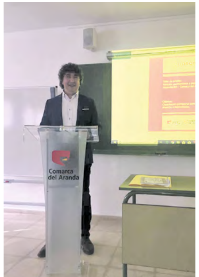
Clausura del Taller de Empleo.

FE DE ERRATAS: En el ejemplar de diciembre de 2018, número 029, en la página 6, publicamos que la Comarca del Aranda había aportado 150.000 euros al Taller de Empleo. El dato no es correcto.