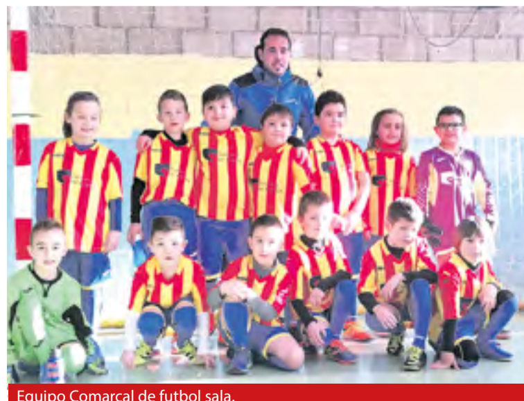
Equipo Comarcal de futbol sala.