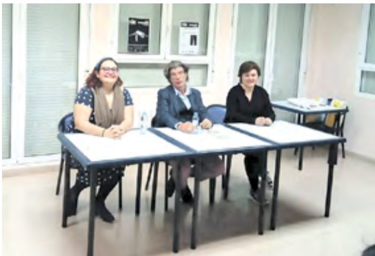
Charla de Bolea con las representantes del IES y de la Comarca del Aranda.