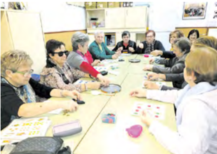
Juegos de mesa.