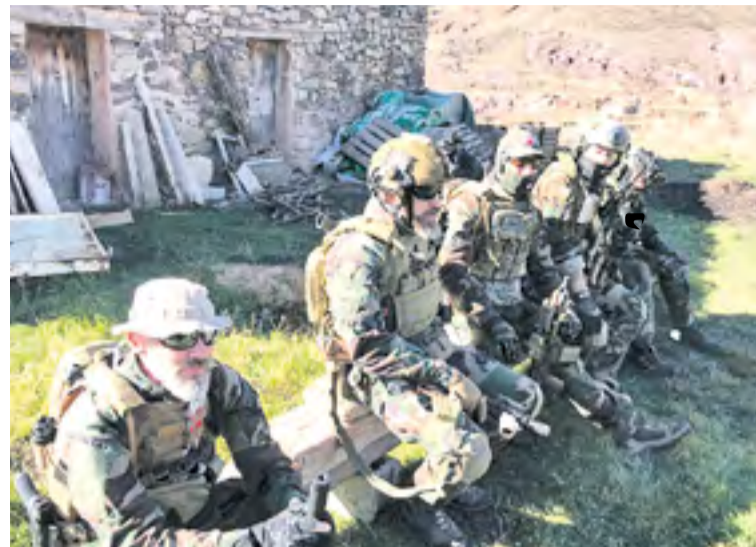
Un momento de descanso.

La buena preparación física y táctica de los participantes es imprescindible para seguir una estrategia bien definida y alcanzar los objetivos marcados por la organización de la prueba.